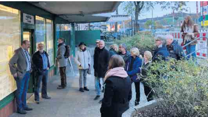
Bürgermeister Christoph Nicodemus eröffnet die Ausstellung des Realisierungswettbewerbs „Steinhofplatz/ehemalige Feuerwehr“.