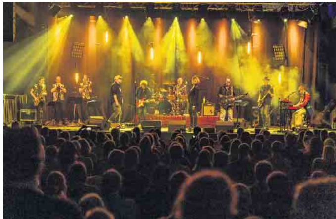
Die SoulBand mit zehn Musikern aus dem Oberbergischen und Köln

Ungewöhnliche Mischung aus Musik- und Actionfilm, die durch überdrehte Ausgelassenheit, eine unbändige Zerstörungswut, zündende Musiknummern und urige Hauptdarsteller John Belushi und Dan Aykroyd gekennzeichnet ist. In Europa zum Kultfilm avanciert, weil es gelungen ist, die Buchvorlage so umzusetzen, dass der Humor, die Menschlichkeit, die Liebe und die Tragödie vermittelt werden, die die Geschichte der