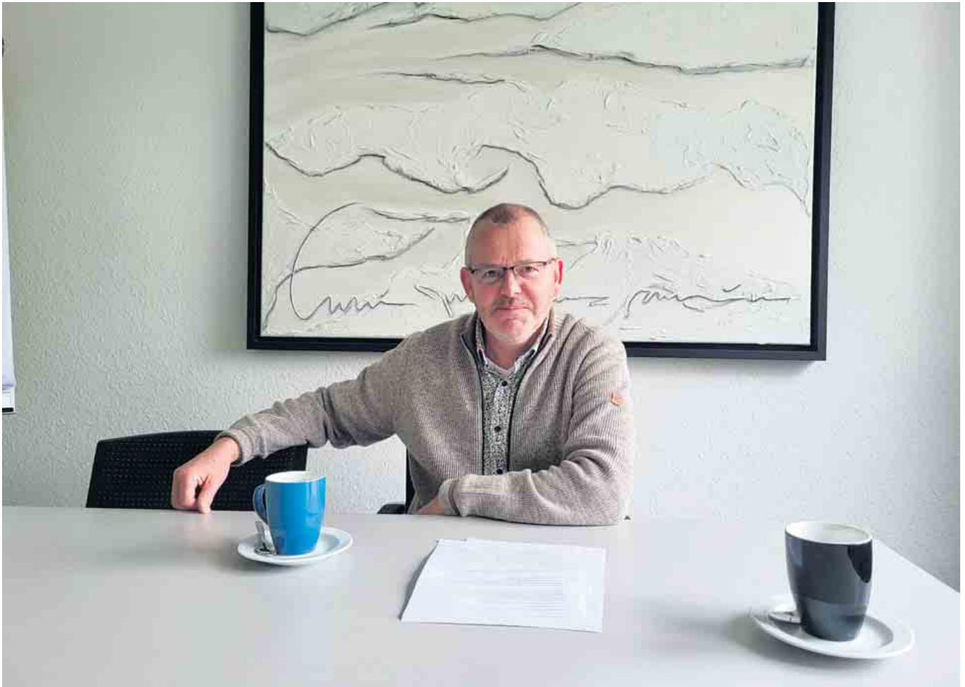
Arno Molter.

Starten Sie jetzt Ihre Ausbildung bei der Evangelische TelefonSeelsorge Oberberg