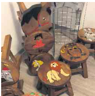
Kinderhocker mit bunten Motiven aus dem Eine-Welt-Laden

Im Eine-Welt-Laden gibt es wieder einmal eine größere Auswahl an langlebigen Kinderhockern aus massivem Chamcha-Holz. Dieses Holz wächst sehr schnell und wird speziell für Schnitzereien und die Kleinmöbelproduktion im Norden Thailands angebaut.