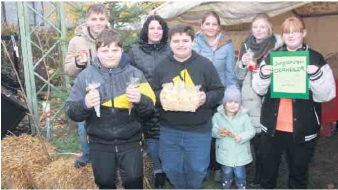
Die Jungschützen halten die Tradition des jährlich stattfindenden Marktes Ende November aufrecht - ganz zur Freude aller Aussteller und Besucher