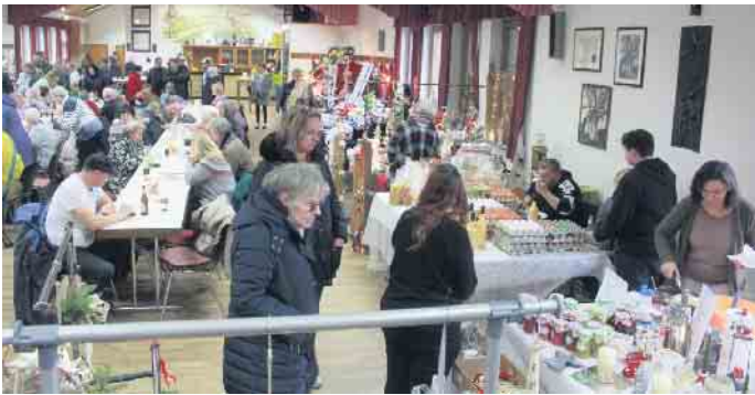
Weihnachtsmarkt in der Dorweiler Schützenhalle

tag besuchte zudem der Nikolaus den Markt. Höchstpersönlich schaute der heilige Mann mit Hans Muff an seiner Seite in Dorweiler vorbei. Für die Kinder hatte er manch süße und fruchtige Überraschung in seinem Jutesack dabei. Alles in allem konnte man sich auch in diesem Jahr wieder von einer tollen Veranstaltung begeistern lassen. Gemeinsam einen vorweihnachtlichen Tag genießen - was will man mehr. Die Schützenbruderschaft Dorweiler sowie alle diesjährigen Aussteller bedanken sich recht herzlich bei den zahlreichen Besuchern. FH