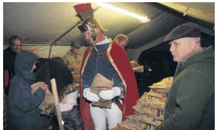
Die Kinder erhielten vom Heiligen Martin ihren Weckmann persönlich übergeben