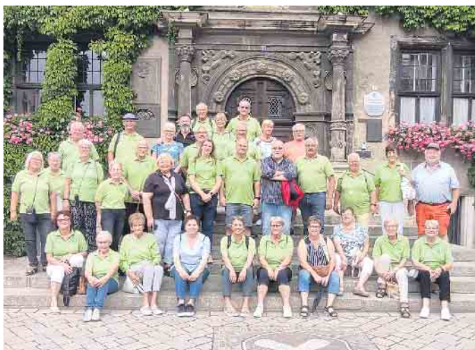
Der Wanderclub Neffelschwalbe blickt endlich mal wieder auf ein komplettes Wanderjahr zurück

reger Teilnahme gut angenommen wurde und für das kommende gerne wieder geplant wird. Höhepunkt war wieder mal die Drei-Tagestour in den Harz. Goslar, Wernigerode und Quedlinburg wurden besichtigt. Der Hexenplatz in Thale und der Besuch in der Schnapsbrennerei haben viel Spaß in die Wandertruppe gebracht. Die besondere Gemeinschaft des Vereins zeigte sich mal wieder am Samstagabend. Mit Musik, Tanz, Gesang und Hexenauftritt war es ein kurzweiliger, lustiger Abend. Das Wanderjahr wurde in diesem Jahr mit einem gemütlichen Abend beendet. Ehrungen für langjährige Mitglieder, eine Proklamation, sowie ein Bilderrückblick auf das vergangene Jahr waren ein schöner Abschluss. FH