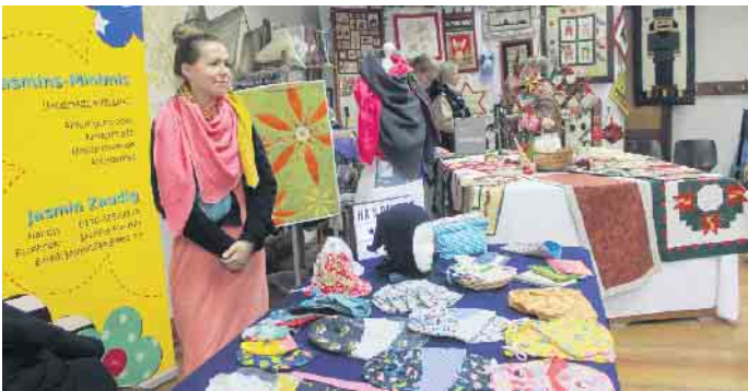
Am 19. November präsentierten wieder zahlreiche Aussteller in und rund um die örtliche Schützenhalle traditionelle und außergewöhnliche Weihnachtsartikel und vieles mehr