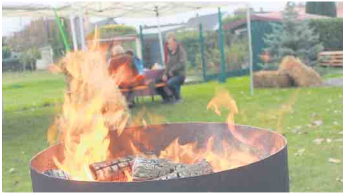
An der Feuertonne konnte man sich im Außenbereich bei den knackigkalten Temperaturen aufwärmen