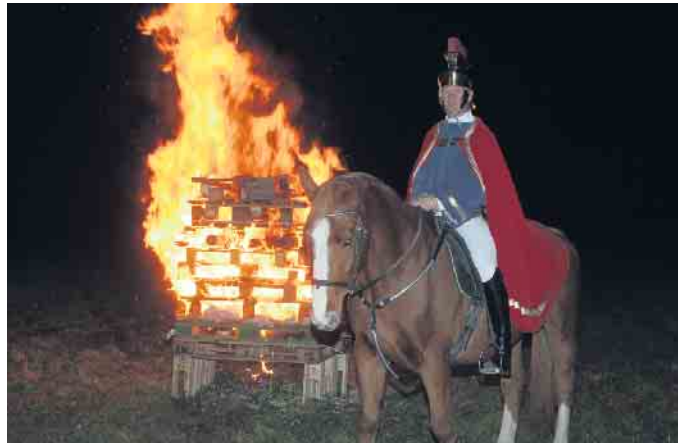
Sankt Martin hoch zu Ross unweit des Martinfeuers

Es ist eine Geschichte von Mitgefühl und Selbstlosigkeit - die Geschichte von St. Martin, der einen frierenden Bettler am Wegesrand rettet. Der Martinstag ist im Kirchenjahr das Fest des heiligen Martin von Tours am 11. November. Am Montag, 14. November, ritt Sankt Martin hoch zu Ross durch Nörvenich. Mit Laternen folgen ihm viele Kinder mit ihren Eltern durch die Straßen. Der Tambourcorps Nörvenich sowie der Musikverein aus Hochkirchen spielte Martinslieder dazu. Zahlreiche Stunden hatten die Nörvenicher Kinder ganz sicherlich im Vorfeld damit verbracht, ihre Laternen zu gestalten. Stolz zogen sie dann mit den Eltern und allen