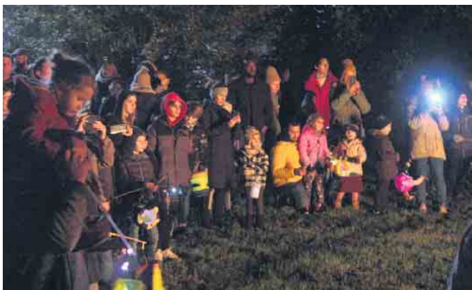
Kinderaugen und bunte Laternen strahlten um die Wette beim Martinsumzug in Nörvenich

te auf der Wiese hinter der Turnhalle in der Neffelbachau, wo Sankt Martin gemeinsam mit den Teilnehmern des Zuges am traditionellen Martinsfeuer den lodernden Flammen lauschte. Die Besucher konnten sich unweit des Feuerscheins mit Glühwein, Punsch, alkoholfreien Getränken aufwärmen. Zur Stärkung wurden Bratwürste angeboten. Die Kinder erhielten Weckmänner. Ein Dank gilt allen fleißigen Helferinnen und Helfern, die vor und hinter den Kulissen zum Erfolg aktiv beigetragen haben. Auch bedanken möchte sich die IG Nörvenicher Ortsvereine bei der Jugendfeuerwehr sowie der Freiwilligen Feuerwehr. FH