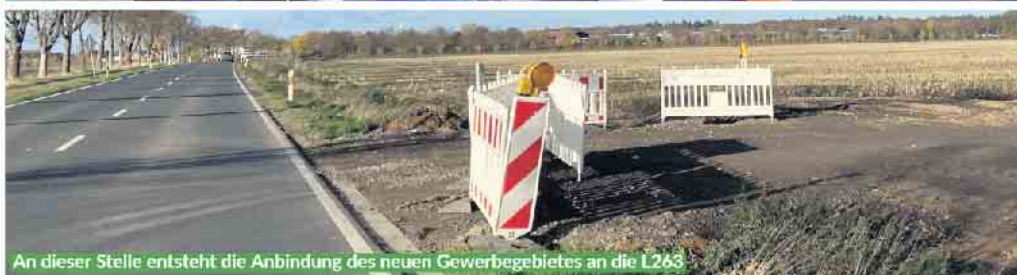
An dieser Stelle entsteht die Anbindung des neuen Gewerbegebietes an die L263

plätze geschaffen werden sollen, andererseits freut mich ganz besonders die Fertigstellung des von den Rather Bürgerinnen und Bürgern schon lange gewünschten Fahrradweges“, sagte der Bürgermeister.