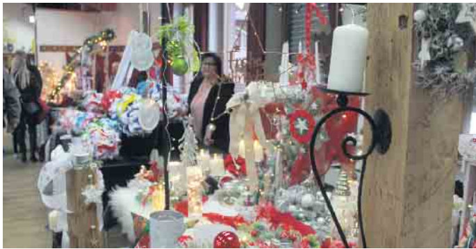
Tolle Artikel für das bevorstehende Weihnachtsfest und die Adventszeit