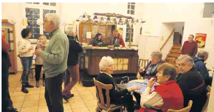
Für einen kostenlosen Pausen-Snack samt Getränken in der Burgschänke hatte das Team der Seniorenresidenz bestens gesorgt.