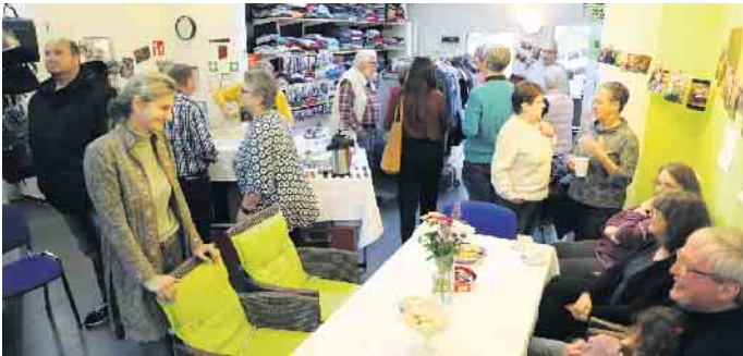
Am Montag, 3. November, wurde Geburtstag gefeiert und zum Zehnjährigen waren viele gekommen, die den Verein ehrenamtlich begleiten, als Förderer und Spender sich tätig zeigen, aber auch Mitglieder, Helfer und Unterstützer sind.