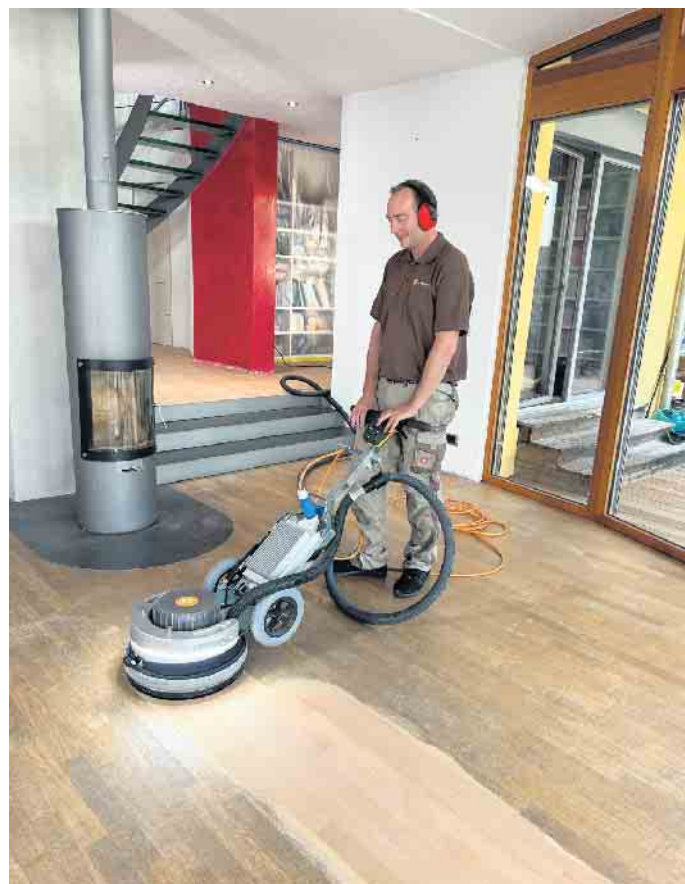
Nach einem Abschliff glänzt Parkett wieder wie neu. So kann es viele Jahrzehnte verwendet werden.