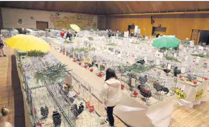
Tierisch was los in Nörvenich: 31. Rassegeflügelschau in der Neffeltalhalle

abend wünschte er allen Anwesenden, dass sie heil durch diese aktuell schwere Zeit kommen. So konnte in diesem Jahr auch wieder an zwei Tagen in der Neffeltalschau ausgiebig informativ gefachsimpelt und interessante Gespräche geführt werden. FH