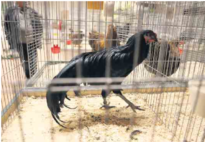
Neben den besonderen Rassen „Cemani“, „La fleshe“ und „Tuzo“ konnte auch die seltene Hühnerrasse „Sumatra“ bestaunt werden.