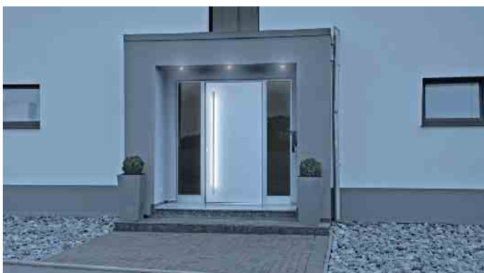
Haustür mit raffinierter LED-Beleuchtung.

www.HAK-Glasbau.de HAK-Glasbau@t-online.de