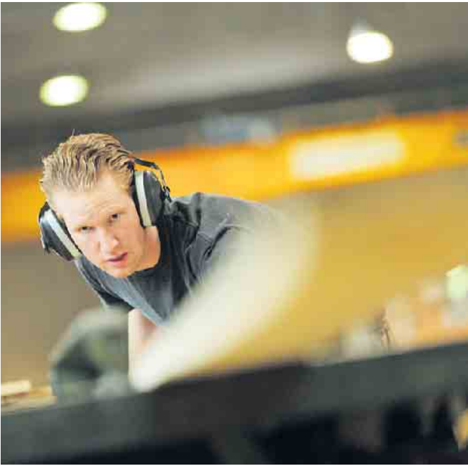
Der natürliche Werkstoff Holz, computergestütztes Handwerk sowie serien- und maßgefertigte Produkte, von denen die gesamte Wirtschaft profitiert - dies erwartet die Auszubildenden in der Holz-packmittelindustrie.

„Neben technischen Schulungsinhalten wird auf die Vermittlung der eigenen Qualitätsstandards und Richtlinien geachtet sowie der Umgang mit dem Branchen-Softwarepaket PALLET-Express zur 3D-Konstruktion und statischen Berechnung von Paletten erlernt. In dem Lehrgang erfahren angehende Holzmechaniker alles, was sie als erfolgreiche Verpacker in der HPE-Branche später brauchen.“