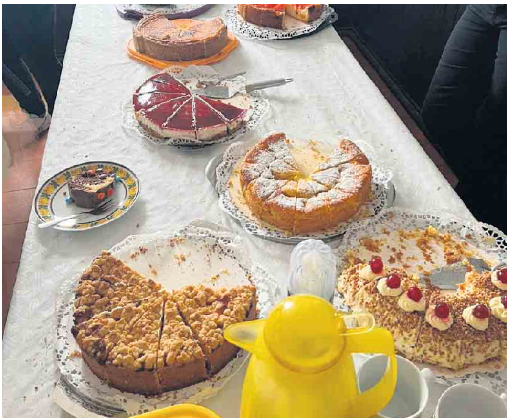
Kaffee und Kuchen in der Cafeteria am Nachmittag ließen das Fest zu einem vergnüglichen Tag für alle kleinen und großen Besucher werden

des Ortes und darüber hinaus, sehr gerne im nächsten Jahr wiederkommen. FH