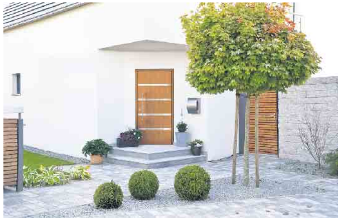
Natürlich anmutende Tür in modernem Design.

„Und wer sich schließlich ganz im Sinne der Zukunftsfähigkeit der eigenen vier Wände auch noch für eine barrierefreie Ausführung entscheidet, der kann sicher sein,