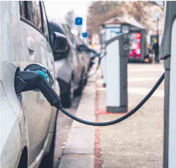
Mit Elektrofahrzeugen ist Carsharing nicht nur praktisch und flexibel, sondern auch noch besonders klimafreundlich.

Risiken im Schadensfall abschließen Der Zusatzschutz übernimmt nicht nur die Selbstbeteiligung bei eigenverschuldeten Schäden. Zusätzlich sind die Kunden vor Regressforderungen der Kfz-Haftpflichtversicherung bei grober Fahrlässigkeit bis zu einer Höhe von 5.000 Euro abgesichert. Unter www.carassure.de gibt es mehr Informationen zum Angebot, das ebenso für Mietfahrzeuge oder in verschiedenen Kombipaketen auch für die Nutzung im In- und Ausland online abschließbar ist. Gemeldet wird ein Schaden erst, wenn die Rechnung vom Carsharing- oder Mietwagenanbieter über die Selbstbeteiligung vorliegt. (djd)