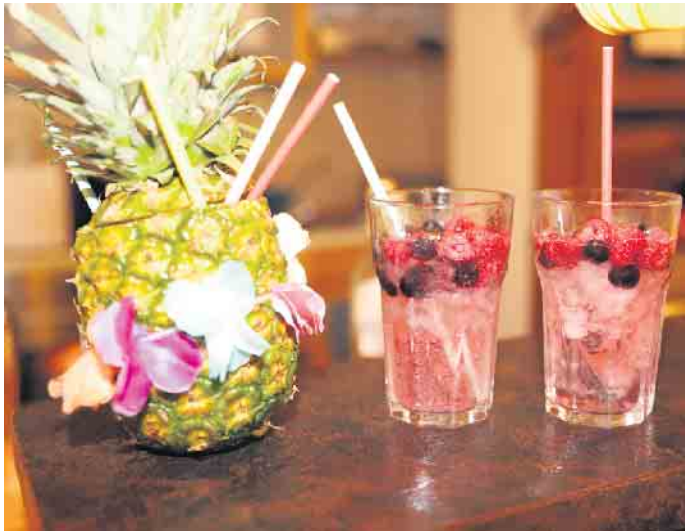
Hmm lecker... die Cocktailvariationen wurden sehr gut angenommen

die Cocktailparty und damit neben einem kleinen Ausschank für frisches Kölsch und Softdrinks auch die reichlich bestückte Cocktailbar eröffnete. In seiner Begrüßung dankte er den zahlreichen Mitgliedern anderer Karnevalsvereine sowie Vereinen aus Nörvenich und den Nachbarstädten für ihr Kommen. Darüber hinaus zeigte Demke sich sehr erfreut, dass