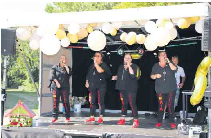
Die Powerfrauen von „Duria Express“ heizten den Gästen so richtig ein