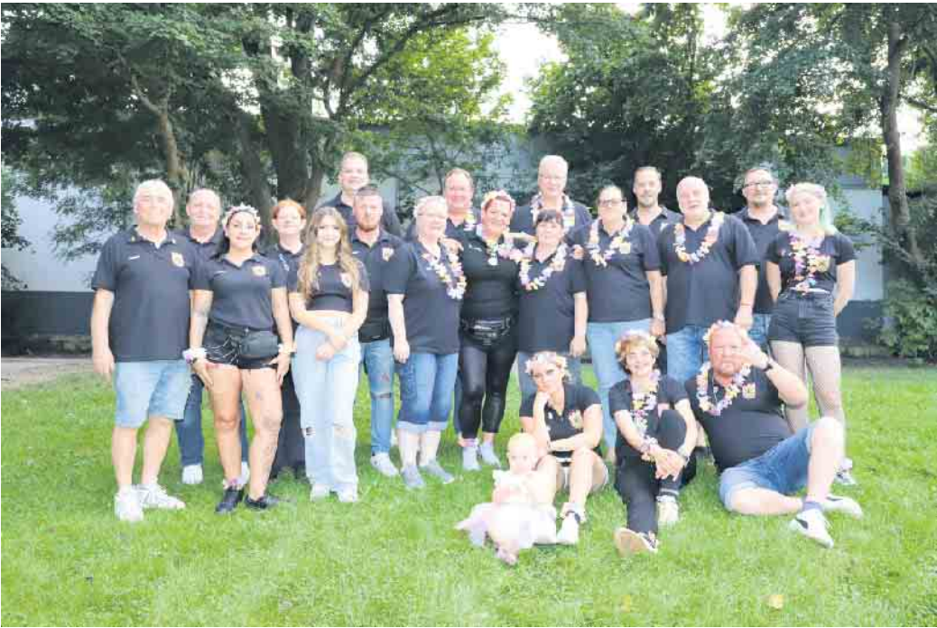
Die Karnevalsgesellschaft Rot-Weiß Nörvenich 2023 e.V. hatte zu ihrer ersten Cocktailparty eingeladen

Am Ende war nur noch heiße Luft in den diversen Saft und Spirituosenflaschen. Die Karnevalsgesellschaft Rot-Weiß Nörvenich 2023 e.V. hatte zu ihrer ersten Cocktailparty eingeladen. Ihnen war schon etwas mulmig, als sie den Schützenkeller schmückten und vorbereiteten. Fand doch am gleichen Tag neben dem Bürgerfest mit „Eröffnung des Bachauererlebis- und Begegnungsfeldes in der Nefelbachau Nörvenich“ auch das traditionelle Reibekuchenessen des Tambourcorps Blau-Weiß Nörvenich 1928 e.V. statt. Doch zur Freude wurde im Vorfeld bereits das Reibekuchenessen auf Samstag, 19. Oktober verschoben und das Bürgerfest der Gemeinde Nörvenich fand bereits um 17 Uhr sein geplantes Ende. Kühle Drinks bei heißen Rhythmen aus den 70er, 80er und