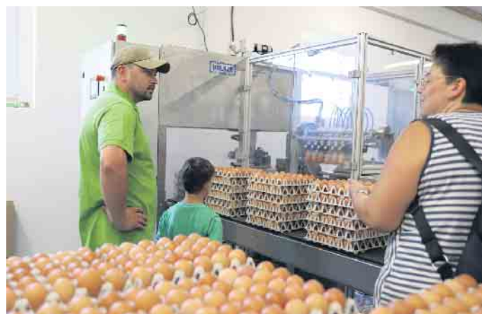
Wo kommen die Eier her und wie werden sie verarbeitet? Dieser Frage konnten die Besucher beim Hoffest nachgehen

„Danke allen, die mitgeholfen haben! Danke allen, die gekommen sind!“, zeigte sich Familie Püllen nach Torschluss sichtlich zufrieden. FH