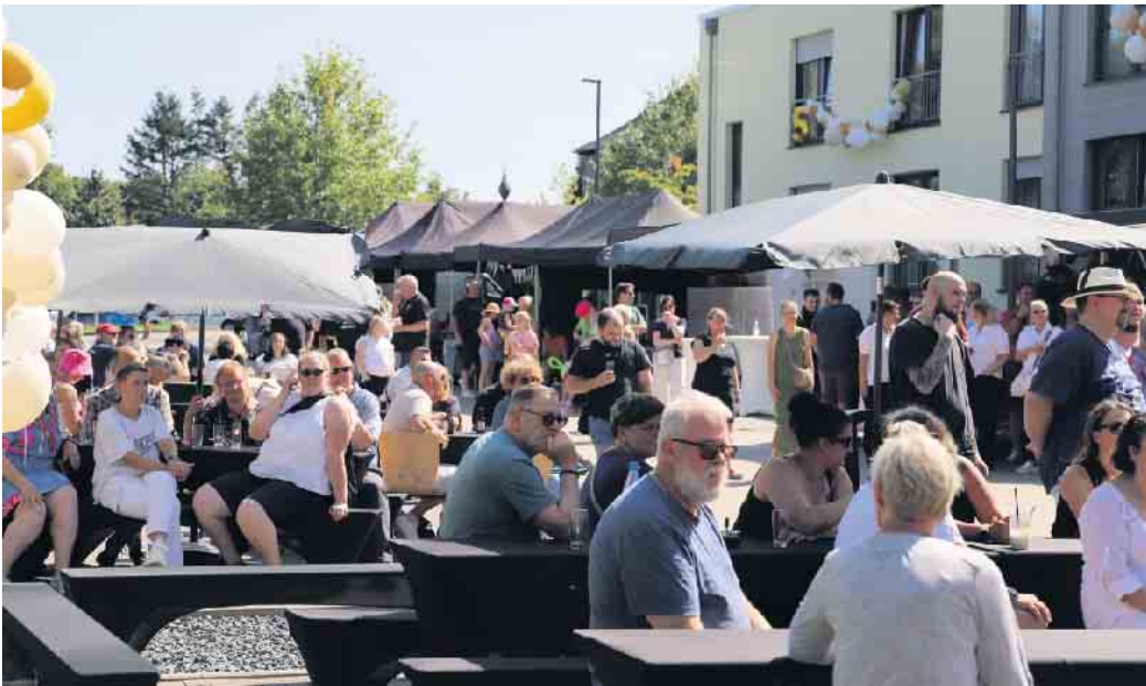
Festlicher Meilenstein: Fünf Jahre Jubiläum in Nörvenich - 500 Besucher sind der herzlichen Einladung zum Fest gefolgt