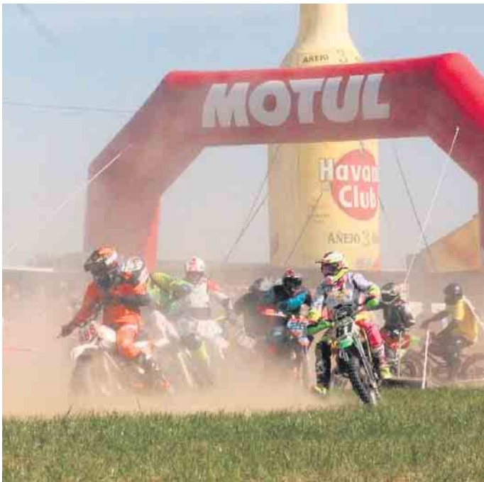
Mofaspektakel in Nörvenich

Am 20. und 21. September findet in Nörvenich auf dem Birkenhof das alljährliche Mofarennen des MSC Nörvenich statt. Es treten rund 65 Teams in Originalklassen und Tuningklassen gegeneinander an. Alt Bekannte, sowie neue Teams aus ganz Deutschland, fiebern dem Wochenende entgegen. Das vier-Stunden Rennspektakel wird am Freitagabend durch die Rockband „MetalRulez“ eingeleitet. Am Samstag werden die Teams und Besucher bei leckeren Imbissen und kühlen Getränken durch den Renntag begleitet. Auch für