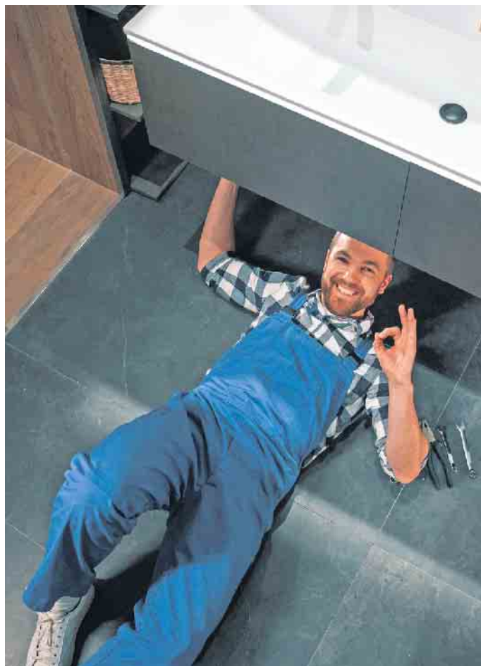
Im Einsatz für mehr Lebensqualität: Badberater entwickeln individuelle Badträume, SHK-Handwerker wie Anlagenmechaniker, Fliesenleger und Elektriker setzen sie um.

Fliesenleger und Elektriker erforderlich, um den Kunden eine optimale Lebensqualität zu bieten. (DJD)