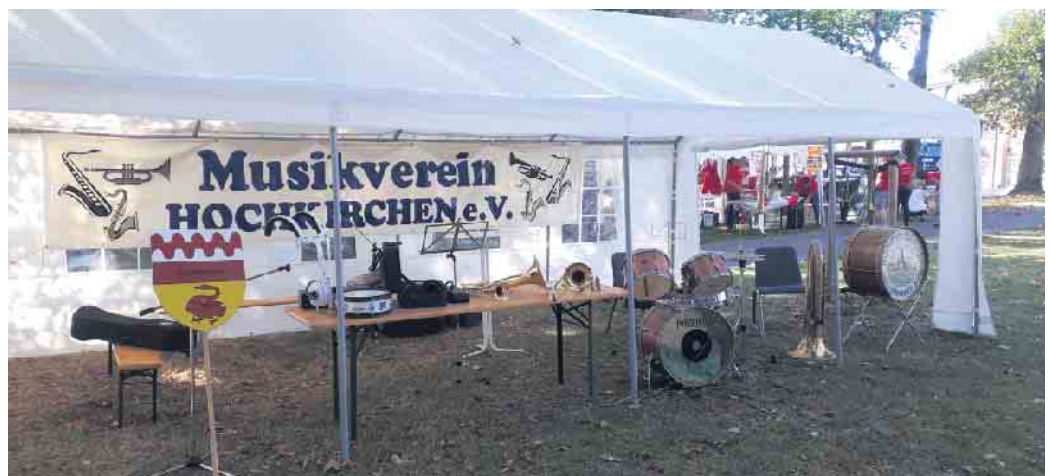
alle können mitmachen

Lassen Sie uns das musikalische Brauchtum weiterführen.