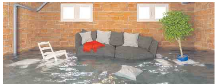
Zu Überschwemmungen im Keller soll es gar nicht erst kommen.