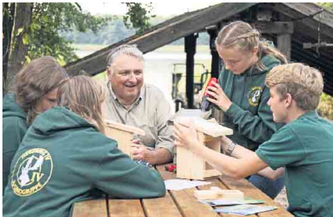
Aus unbehandeltem Holz lässt sich ein neuer Nistkasten ganz leicht selberbauen.