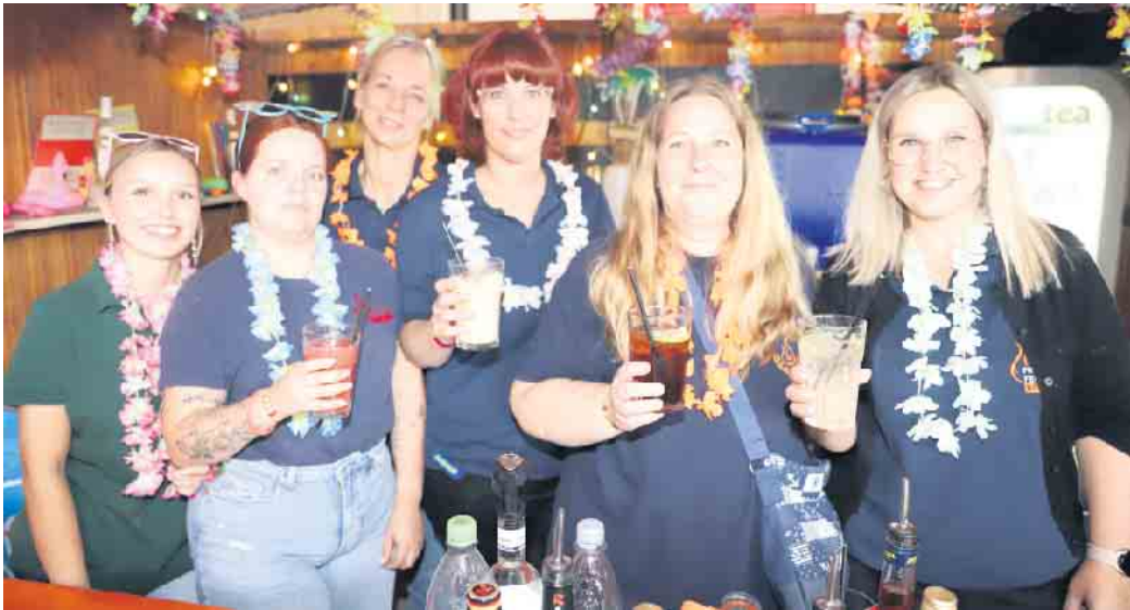
Sehr gut angenommen wurde auch die Cocktailbar - hier gilt den Frauen der Löschgruppe Nörvenich/Oberbolheim ein Dank für die toll geleistete Arbeit