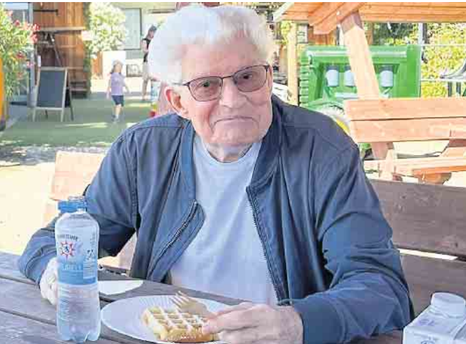
Es gab leckere Waffeln