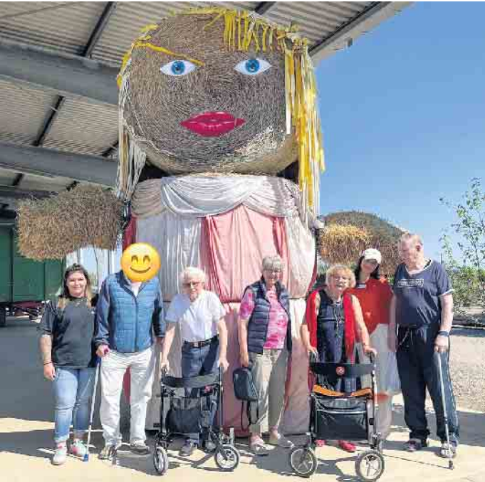
Ein schöner Tag in Pingsheim auf dem Erlebnishof der Familie Levenig