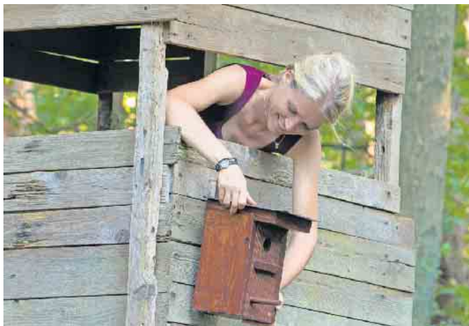
In Nistkästen können sich Parasiten und Krankheitserreger vermehren. Deshalb ist es wichtig, sie regelmäßig zu reinigen.

Anschließend gründlich austrocknen lassen, bevor sie wieder verschlossen wird. Wichtig: Auf Reinigungs- und Desinfektionsmittel verzichten, denn die „Chemiekeule“ kann den Tieren schaden.