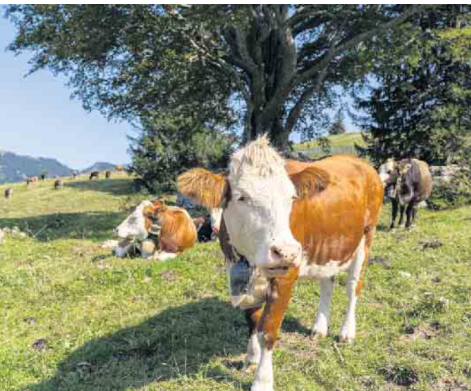
BioWochen NRW bis 14. September

sereien und sogar Restaurants für Hoffeste, Ernteaktionen, Führungen und Verkostungen. Diese Aktion bietet die perfekte Gelegenheit, regionale und ökologisch erzeugte Produkte direkt zu probieren und mehr über ihre Herstellung zu erfahren.