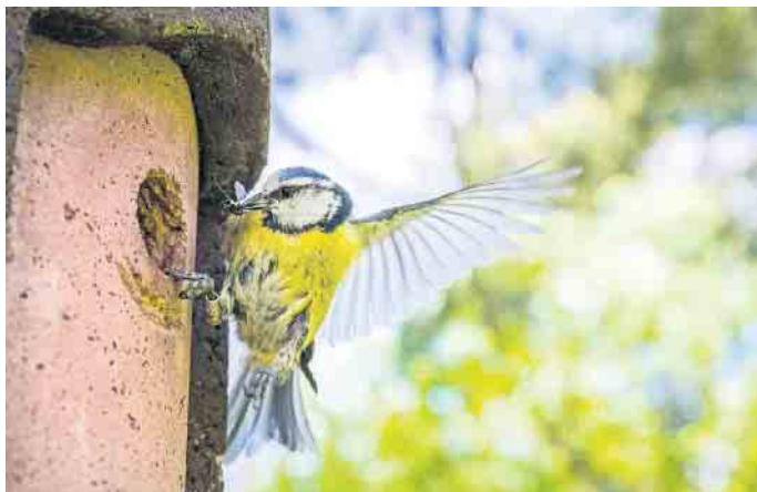
Wer seinen Nistkasten gut pflegt, kann sich über rege Nutzung und schöne Beobachtungen freuen.