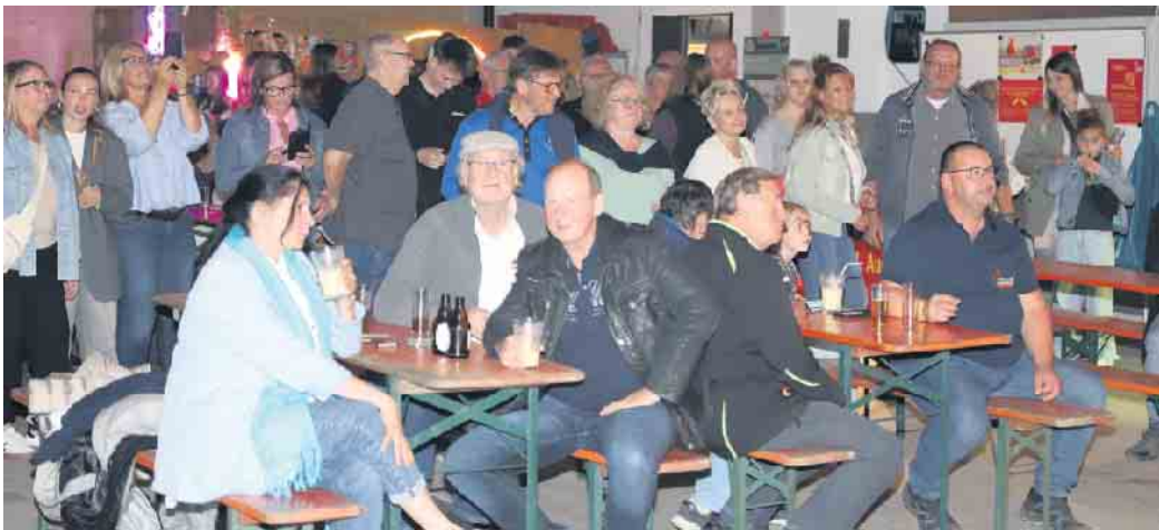
Sowohl im Außen- als auch im Innenbereich war kaum mehr ein Platz frei