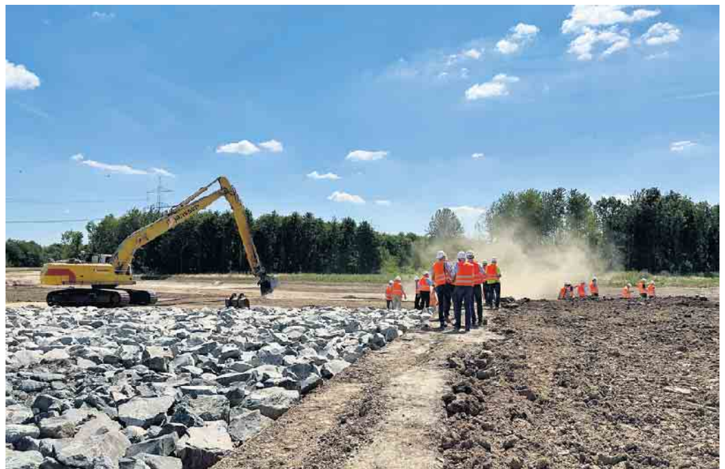
Führung auf der aktiven Baustelle der Erft-Verlegung.

Zu den Ausstellenden zählt unter anderem das Hochwasserkompetenzzentrum (HKC) aus Köln. Hier können die Besuchenden unter Anleitung herausfinden, ob ihr Zuhause hochwassergefährdet ist, selbst einmal Sandsäcke befüllen, mobile Hochwasserschutzvorrichtungen kennenlernen und sich mit praktischen Tipps zur Selbstvorsorge befassen. Das Team des Naturpark-Zentrums Gymnicher Mühle wird neben einem eigenen Info- und Aktionsstand, Führungen im Erftmuseum anbieten. Am