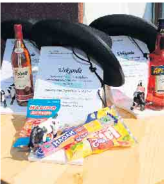
Kleine Preise beim Bullriding winkten in drei Kategorien. Die Attraktion war auch in diesem Jahr eine Riesengaudi