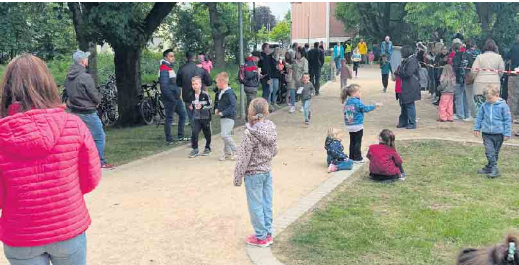
Beim Sponsorenlauf waren die rund 400 Kinder in der Neffelbachau für ihr Spendenziel unterwegs

In den Wochen zuvor hatten die Kinder in ihren Familien und im Freundeskreis Sponsoren gesucht, die ihnen für jede gelaufene Runde einen frei gewählten Geldbetrag spenden. Zusätzlich hat aus jeder Klasse das Mädchen und der Junge mit den meisten Stempeln aus der Klasse eine