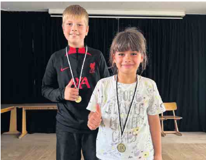
Schüler, die aus ihrer Klasse die meisten Stempel erlaufen haben

Bei dem Sponsorenlauf ist die unglaubliche Summe von rund 30.000 Euro zusammengekommen. FH