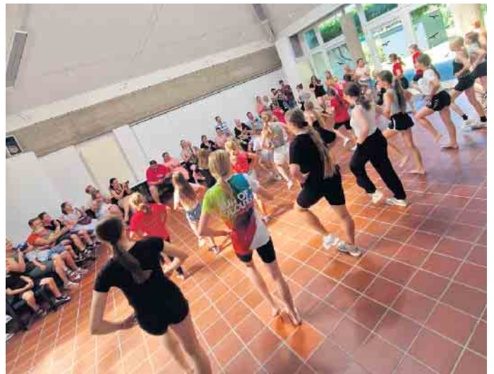
Der Tanz wurde den Eltern präsentiert

ren Adjutanten und einer kleinen Abordnung des Vorstandes sorgten sie für strahlende Augen: Als sie Eis an alle Kinder verteilten, war die Freude groß!