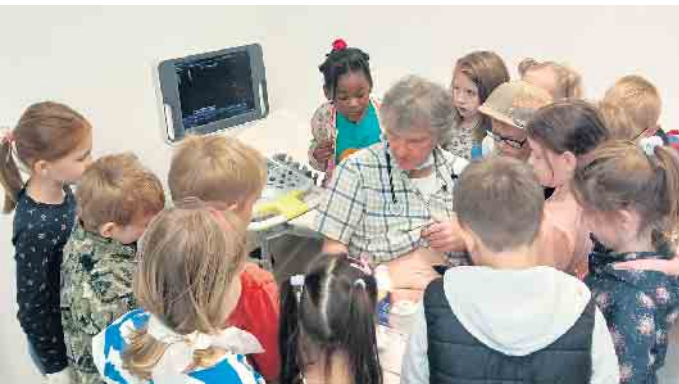
Die Kinder wohnten live einer Bauch-Ultraschalluntersuchung bei