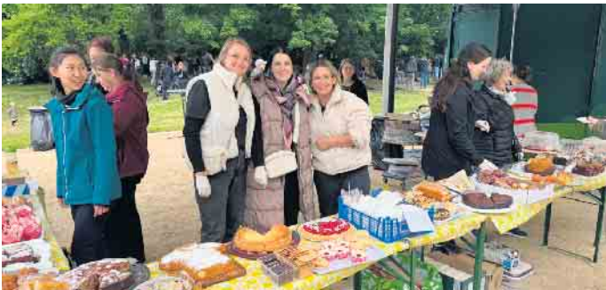
Die ehrenamtlichen Helfer und das ISS-Dich-Fit Team sorgten für herzhafte und süße Leckereien