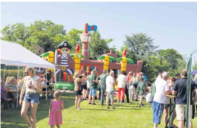
Fronleichnam lockte das Wiesenfest für die ganze Familie wieder rund um die „alte Schule“

zudem zahlreiche befreundete Bruderschaften und Vereine aus der Gemeinde Nörvenich an diesem Tag in Poll willkommen heißen. Zum Programm für die kleinen Gäste gehörte die vereinseigene Piraten-Hüpfburg und das Kinderschminken. Für das leibliche Wohl war mit Spezialitäten vom Grill, einer reichhaltigen Cafeteria, Slushice und natürlich reichlich kühlen Getränken wieder bestens gesorgt. Nachdem die Gäste im letzten Jahr die neue Attraktion, das Bullriding, so großartig angenommen haben, hat die Poller Bruderschaft auch in diesem Jahr den Bullen von Jung und Alt zähmen lassen. Kleine Preise winkten in den Kategorien „Bullriding Kind/Jugendlicher bis 18“, „Beste Bullenbezwingerin“ sowie „Bester Bullenbezwinger“. Das Bullriding war auch in diesem Jahr eine Riesengaudi. Das Wiesenfest hat sich zu einem