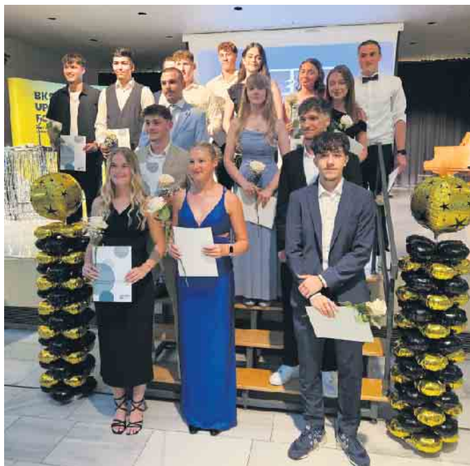
FOS Abschluss 2025