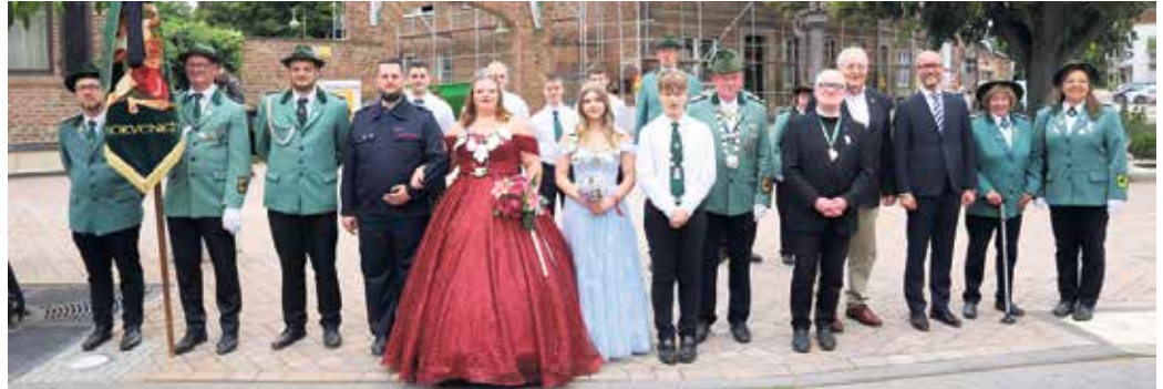
Parade beim Festzug am Schützenfestsonntag am Marktplatz

Nach dem Umzug luden die Cafeteria im Festzelt und der anschließende Dämmerchoppen zum Verweilen ein. Ein moderner Höhepunkt wartete ab 18 Uhr auf die Fußballfans: In Partnerschaft mit Westenergie und der Schirmherrschaft von Bürgermeister