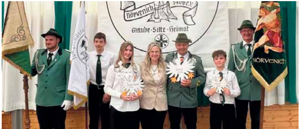
Die neuen Majestäten der Nörvenicher Schützenbruderschaft nach der Krönung