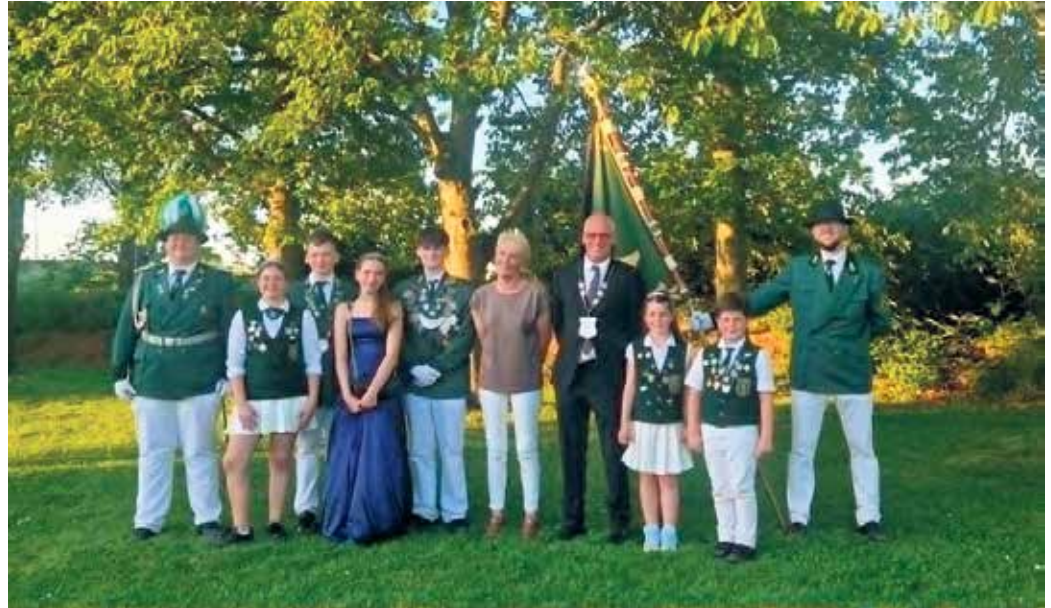
Die neuen Majestäten der Wissersheimer Schützen nach der Krönung