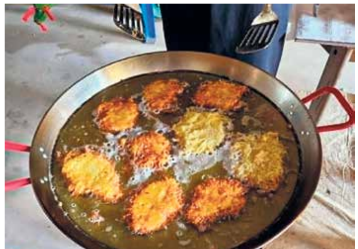
Die frischgebackenen, goldbraunen Reibekuchen fanden großen Anklang

oder ganz bequem per Lieferservice nach Hause bringen lassen. Die Bestellannahme startet bereits am Mittwoch zuvor, sodass wieder reger Gebrauch gemacht wurde und viele Bestellungen eingingen. Ein herzlicher Dank gilt allen fleißigen Helfern sowie den großzügigen Spendern, die die Zutaten für diese Aktion bereitgestellt haben. Der Bürgerverein Frauwüllesheim freute sich über die zahlreichen Bestellungen. FH