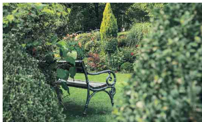
Rasengrab oder Bestattung im Blumengarten.