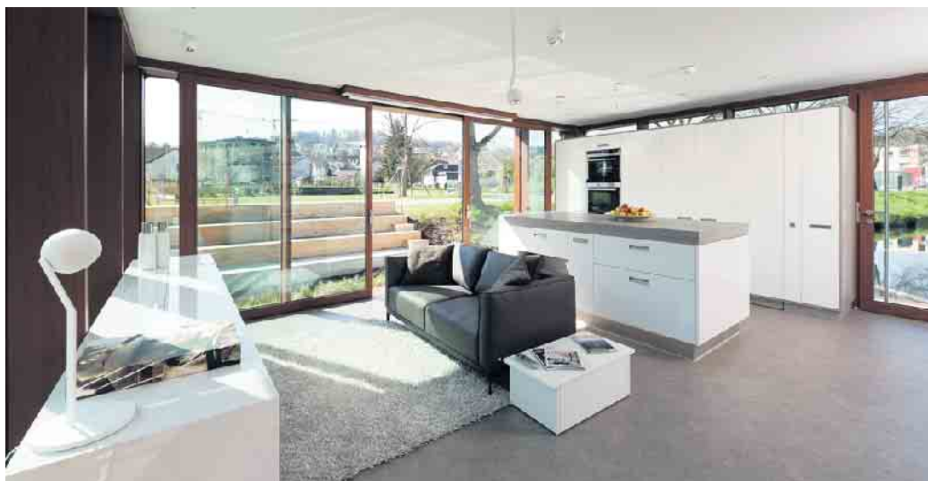
Wie sich auf 39 m² wohnen, kochen, essen, schlafen und arbeiten lässt, zeigt diese elegante Lösung. Highlights sind die Kochinsel mit ausziehbarer Esstheke und die Küche, die bei Bedarf hinter Schiebetüren verschwindet.

Möbel, Hausgeräte und Küchenzubehör - sie alle sind so konzipiert und optimiert, dass sie ihre Nutzer nachhaltig erfreuen, Schönheit und Komfort in ihren Alltag bringen und ihnen ein angenehmes Lebens- und Wohngefühl vermitteln. Das gilt auch für die Planung kleiner, feiner Küchen bis hin zu Tiny Kitchen. Mit raumoptimierten Möbeln, Beschlägen, Hausgeräten und Zubehörelementen können auch kleinere Küchen zu wahren Stauraumwundern werden. Am Anfang steht das exakte Aufmaß. Dabei haben die Küchenspezialisten gerade bei kleinen Grundrissen alle Optionen im Blick, die Wände, Nischen/Ecken und die Decke bieten. Denn wo es an Grundfläche fehlt, wird in die Höhe geplant - mit Hilfe von Hoch-, Hängeschränken und Regalsystemen. Damit man später an seine verstauten Inhalte in luftiger