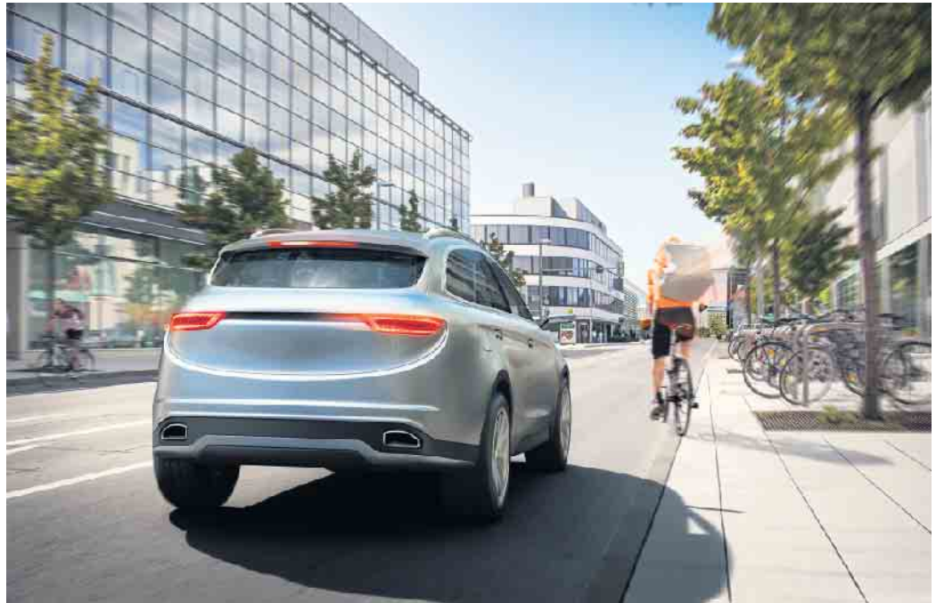
Mehr Sicherheit dank Technik: Der Gesetzgeber schreibt für Neufahrzeuge Ausstattungen wie einen Notbremsassistenten vor.

im Straßenverkehr zu ermöglichen, arbeiten im Hintergrund komplexe Systeme.