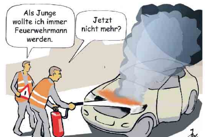
Ein Brandherd in einem Kfz kann sich durch auslaufenden Treibstoff sehr schnell ausbreiten.