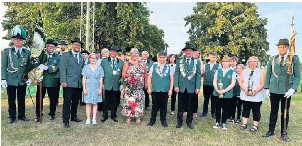
Die St. Hubertus Schützenbruderschaft Dorweiler lädt zum traditionellen Schützenfest ein

Die St. Hubertus Schützenbruderschaft Dorweiler freut sich auf ihren Besuch und begrüßt sie an allen Tagen herzlich in der Schützenhalle Dorweiler. FH