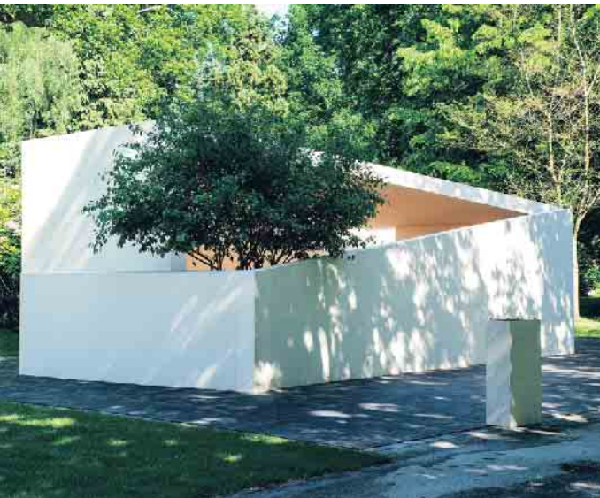
Ein alternativer und konfessionsübergreifender Trauerort auf dem größten Parkfriedhof der Welt.