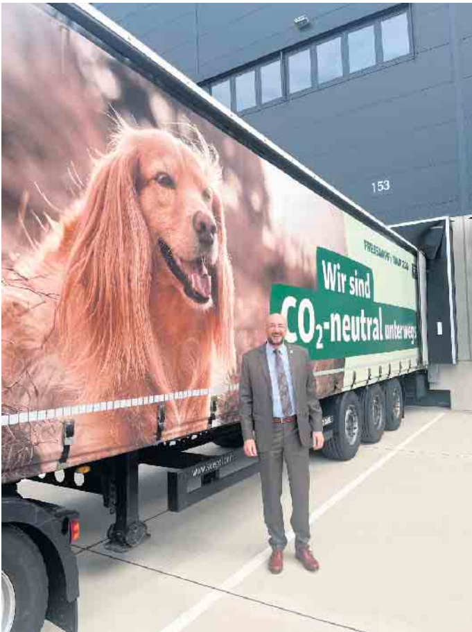
Auf dieser Seite des ersten Lkw mit Ware für das neue Fressnapf-Logistikzentrum ist ein Hund abgebildet - wie unser Bürgermeister berichtet, war dennoch „Katzenstreu“ die Ladung, die als erste abgeladen wurde.

gert wurde. Der erste Warenausgang ist für den 16.06. geplant - bisher läuft alles exakt nach Zeitplan. Vom ersten Spatenstich für die 50.000 Palettenstellplätze bis jetzt sind nur 14 Monate vergangen. Die nächste große Aufgabe ist es jetzt, die Automatisierungstechnik einzurüsten, welche ab November dazu beitragen soll, die Tagesleistung deutlich zu erhöhen.