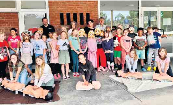
Ausbildung/Qualifikation zum Schulsanitäter: die Kinder der Grundschule in Eschweiler über Feld sind fit bei der Reanimation, dem Anlegen eines Verbandes und können einen Notruf absetzen

Kinder der Grundschule in Eschweiler über Feld sind fit bei der Reanimation, dem Anlegen eines Verbandes und können einen Notruf absetzen