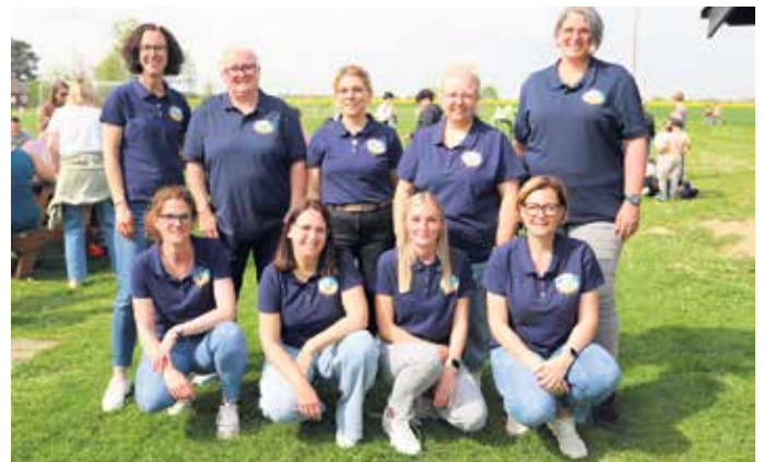
Das Team der Kita Kunterbunt