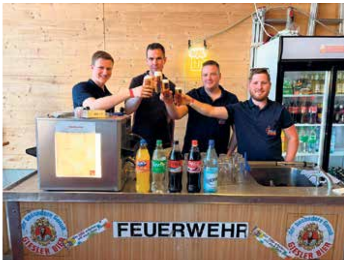
Alarmstufe Feierstimmung: MAI FIRE setzte neue Maßstäbe

Nörvenich hat ein neues Party-Highlight! Zum allerersten Mal öffnete die neue Feuerwache an der Oberbolheimer Straße ihre Tore für ein Event der besonderen Art. Unter dem Motto MAI FIRE feierten zahlreiche Gäste, darunter befreundete Löscheinheiten aus der Gemeinde sowie viele Abordnungen der Ortsvereine, gemeinsam mit der Freiwillige Feuerwehr Nörvenich Löscheinheit Nörvenich/Oberbolheim eine Premiere, die noch lange in Erinnerung bleiben wird. Ab 19 Uhr füllte sich die moderne Fahrzeughalle, die für diesen Abend in eine spektakuläre Event-Location verwandelt wurde. Wo sonst Einsatzfahrzeuge stehen, sorgten am 30. April bebende Bässe und eine beeindruckende