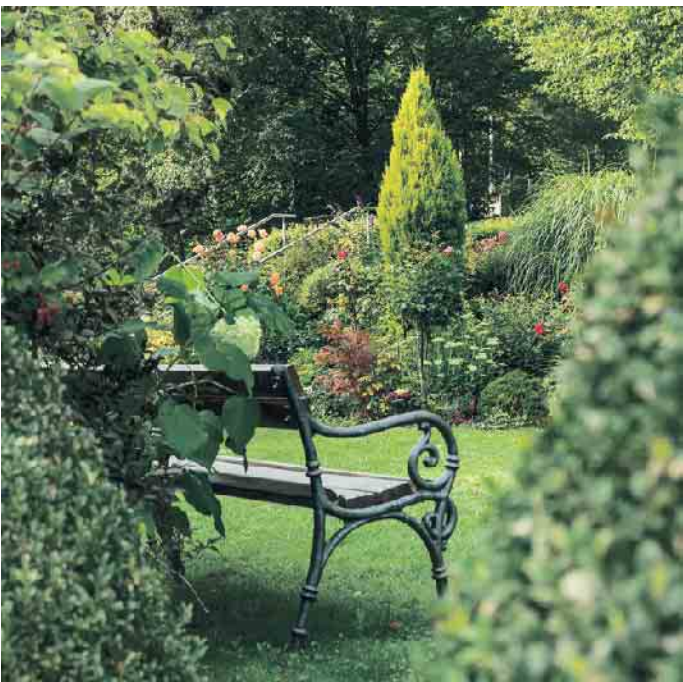
Rasengrab oder Bestattung im Blumengarten.

sollte man sich - wenn noch nichts vom Verstorbenen festgelegt wurde - Zeit geben und überlegen, dass ihn möglichst viele Angehörige besuchen können. (akz-o)