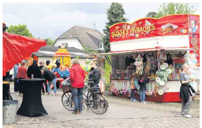
Festplatz mit den Angeboten der Schausteller vor der Festhalle