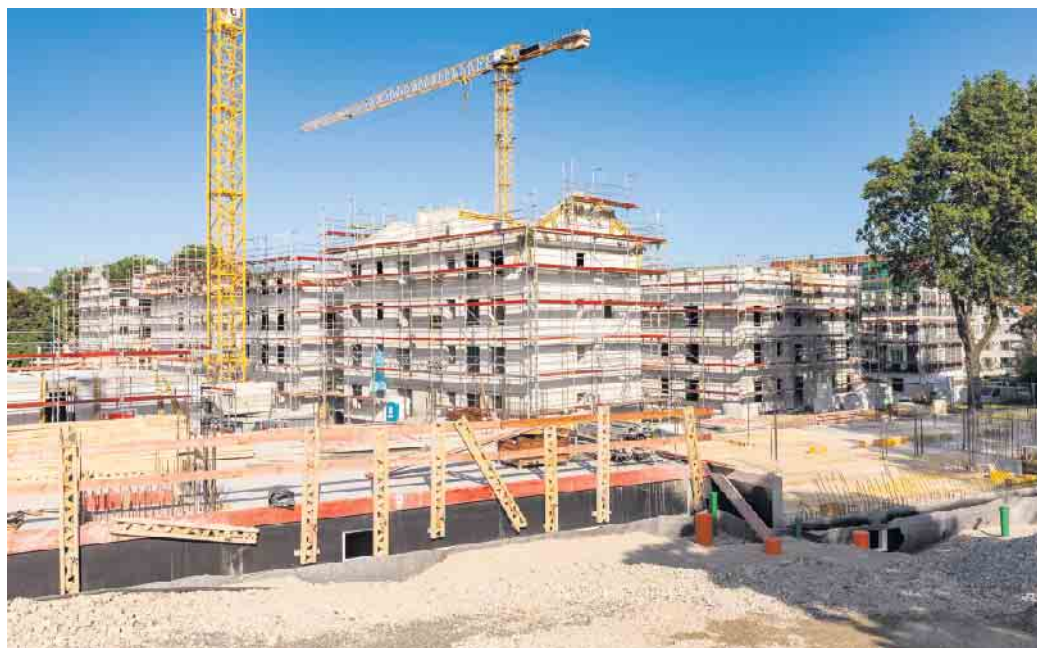
Beim Erwerb von Wohneigentum über einen Bauträger ist der Kunde kein Bauherr, sondern Käufer. Das kann Vor- und Nachteile mit sich bringen.

Professionelle Unterstützung und umfassende Garantien eines er-