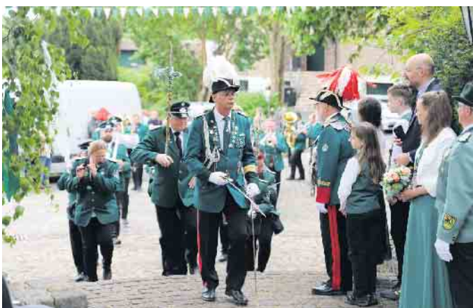
Impression vom Festumzug am Schützenfest-Sonntag

und Kuchen auf die Besucher. Musikalisch untermalt wurde der Nachmittag mit Klängen des Mu- sikvereins aus Eicks. Traditionel- ler Abschluss des Sonntages bil- dete der Dämmererschoppen. Früh am Schützenfest-Montag fanden sich zahlreiche Eggersheimer BÜR- gerinnen und Bürger sowie Bru- derschafts-Mitglieder in der Fest- halle ein, wo das Schützenfrüh- stück wartete. Den Abschluss des Schützenfestes bildete der naht- los anschließende Frühschoppen. Alles in allem war es ein gelun- genes und sehr gut besuchtes Schüt- zenfest in Eggersheim. FH