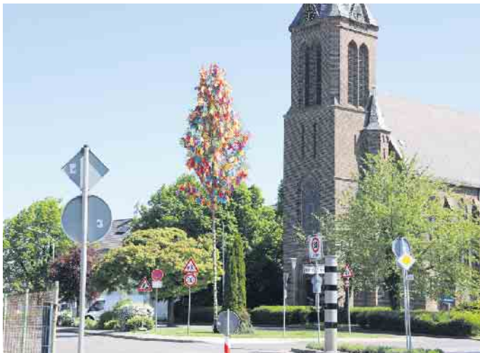
Eschweiler über Feld