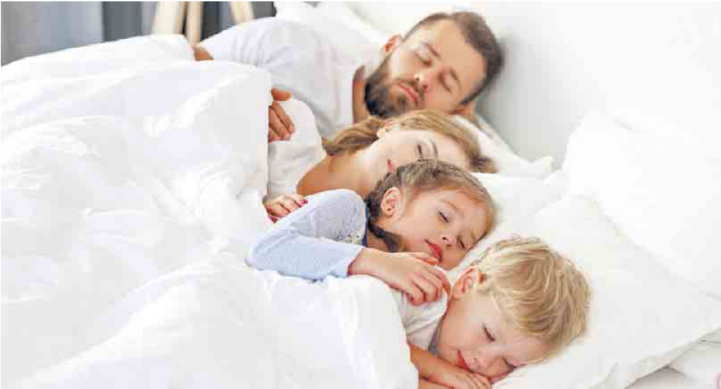
Gesund und in Ruhe wohnen: Mit Außenwänden aus Leichtbeton profitieren Familien von einem hohen Schallschutz.

Krechting. Mit diesen Werten in den eigenen Wänden sind Bewohner jederzeit, egal ob im Ein- oder Mehrfamilienhaus, rundum vor Geräuschen aus Nebenzimmern und benachbarten Wohnungen geschützt. Ausführliche Informationen finden Interessierte in der kürzlich aktualisierten, kostenfreien Broschüre „Massives Plus an Schallschutz“. Diese steht etwa unter www.klb-klimaleichtblock.de in der Rubrik „Download“ bereit oder kann telefonisch unter 02632-25770 angefordert werden. (djd)