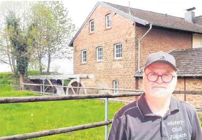
Der Autor vor der Wassermühle in Juntersdorf