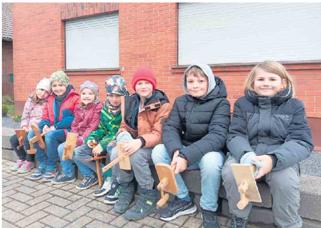
Die Irresheimer Klapper-Kinder 2025

Dabei wurden sie für ihre Klapper-Gänge belohnt. Traditionell wurden den Kindern Eier und Schokoladeneier geschenkt. In den letzten Jahren wird aber auch vermehrt Geld gespendet. Eier, Schokolade und Geld wurden unter allen Klapper Kinder gerecht aufgeteilt. In den letzten Jahren erlaubten die groß-