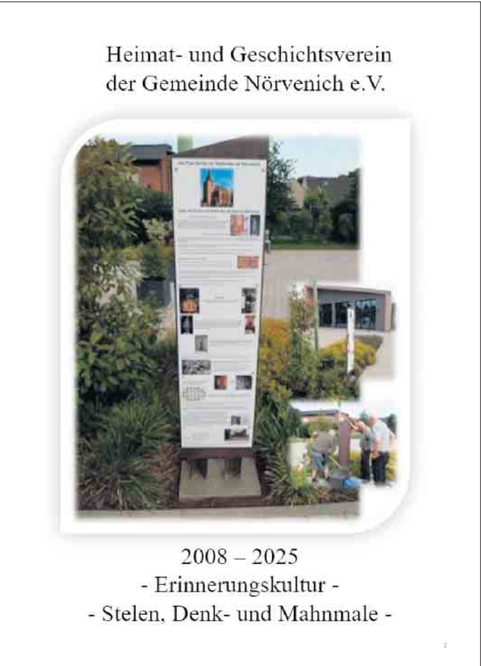
Das Deckblatt der Broschüre

Nur eine Broschüre? Nein, das ist sie sicher nicht. Das neue, vom Heimat- und Geschichtsverein der Gemeinde Nörvenich e. V. erstellte, interessante Heft beinhaltet eine Aufstellung aller im Gemeindegebiet platzierten Stelen, Denkmäler und Mahnmale, die der Verein von 2008 bis 2025 entworfen und aufgestellt hat. Jeder Interessierte findet in diesem 34-seitigen Heft besondere bauliche oder geschichtliche Merkmale der Gemeinde. Die Broschüre ist mit Bildern der Stelen, Denk- und Mahnmale sowie mit der entsprechenden Beschreibung versehen. Durch die Einbindung einer Lagekarte wird einem Suchenden die Findung der jeweiligen Objekte erleichtert. Das Heft ist beim Heimat- und Geschichtsverein der Gemeinde Nörvenich e. V. gegen eine kleine Spende zu erhalten. FH