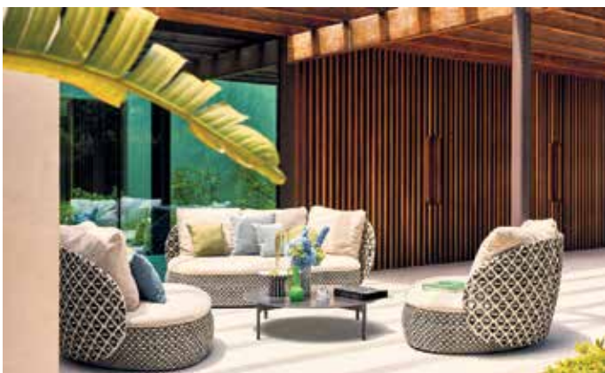
Viel Flexibilität: Das modulare, organisch geformte Loungemöbel besteht aus verschiedenen Modulen, die sowohl für sich alleine stehen als auch zu größeren Sitzlandschaften verbunden werden können. Foto: Dedon