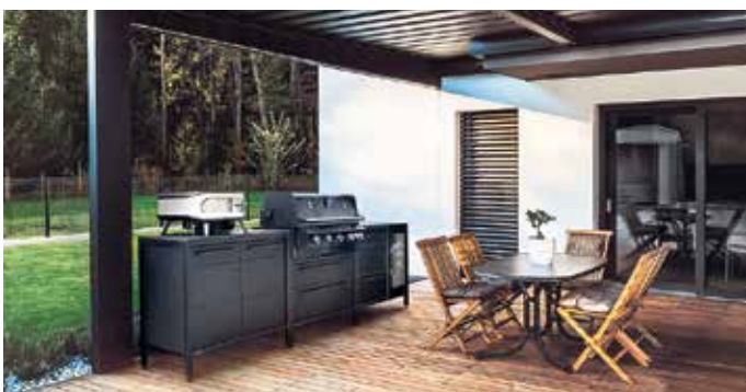
Geselliges Kochen im Freien: Die einzelnen Module lassen sich individuell zu einer komfortablen Outdoorküche kombinieren.

die Auswahl etwa von gebürstetem Edelstahl über recyceltes Teakholz bis hin zu Keramik, Naturstein und modernen Verbundwerkstoffen. Verband der Deutschen Möbelindustrie e.V. Bad Honnef