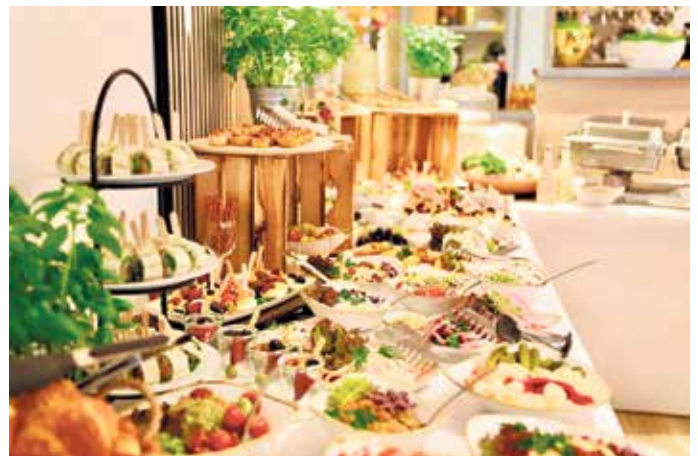
Ein Erlebnis für Alle Sinne