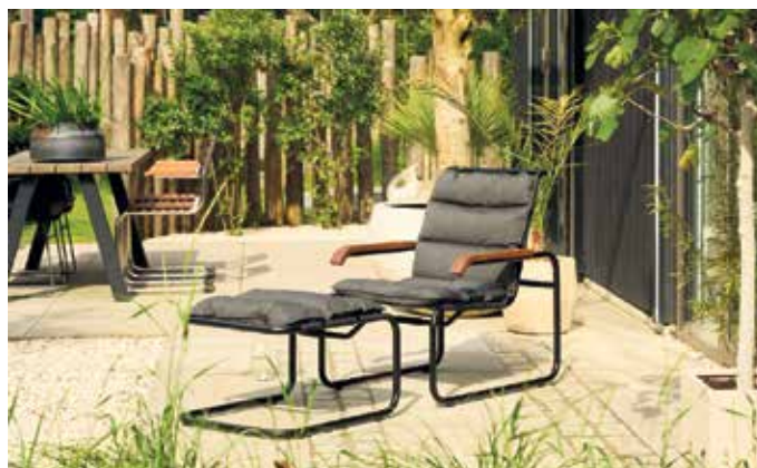
Freiluftvariante eines Klassikers: Der frei schwingende Stahlrohrstuhl wird für zusätzlichen Komfort mit einem passenden Fußhocker ergänzt.

im maritimen Klassiker Blau-Weiß. Für eine angenehme Haptik sorgen weiche Outdoor-Bouclégarne aus Polypropylen, die lichtecht, waschbar und chlorbeständig sind und zudem schnell abtrocknen. Zudem kommen bei Polsterbezügen verstärkt Recyclingmaterialien zum Einsatz.