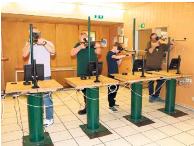
Die Sankt Sebastianus Schützenbruderschaft Nörvenich 1408 e.V. hatte zum traditionellen Ostereierschießen geladen - doch in diesem Jahr gab es eine spannende Premiere: Erstmals wurde auf der brandneuen digitalen Schießanlage um die Wette gezielt

Ein rundum gelungener Tag, der einmal mehr bewies, dass Tradition in Nörvenich alles andere als eingestaubt ist. FH