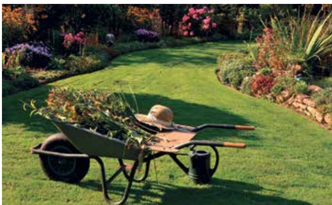
Nun ist der richtige Zeitpunkt für den Rückschnitt.

Mit diesen Pflegeschritten starten Gartenfreunde bestens vorbereitet in die neue Saison - und können sich schon bald über frisches Grün, bunte Blüten und gesunde Früchte freuen. (akz-o)