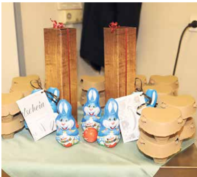
Belohnt wurde die Treffsicherheit mit attraktiven Sachpreisen und natürlich Bergen von bunten Ostereiern

in Poll gebührend einläutete. Auf zahlreichen Besuch würde sich die Bruderschaft auch zum Tanz in den Mai am 30. April rund um die Schützenhalle sowie ihr Schützenfest Ende August an altbekannter Stelle. FH