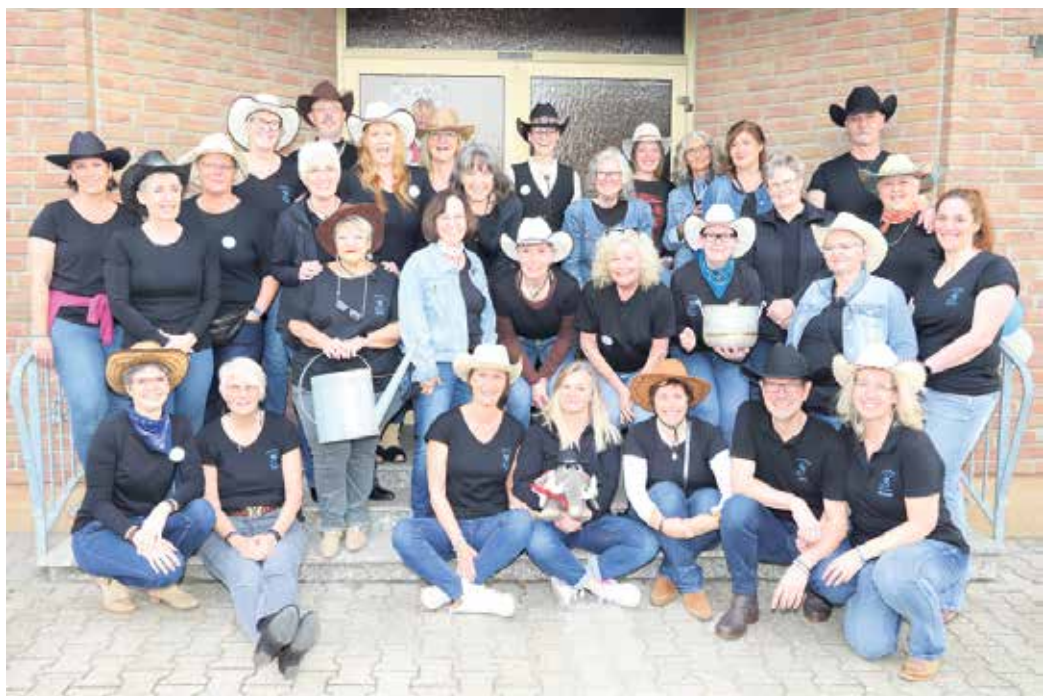
Die „Crazy Boots Nörvenich