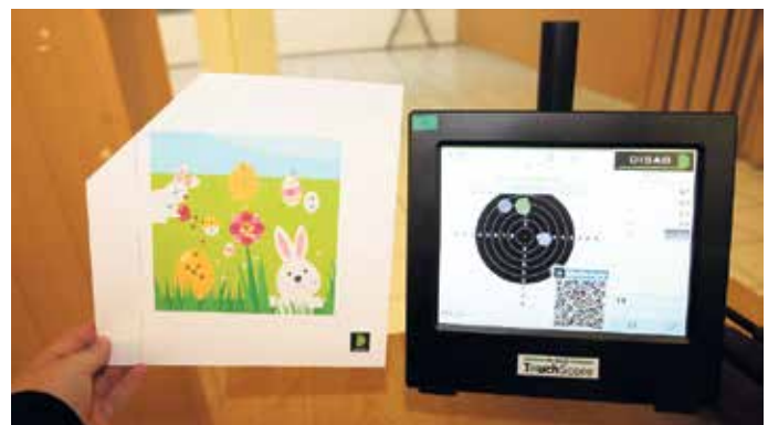
Einblick in die digitale Schießanlage mit den neuen: Glücksschießen (links) und dem Touchscreen, hier dem Eierschießen (r.)