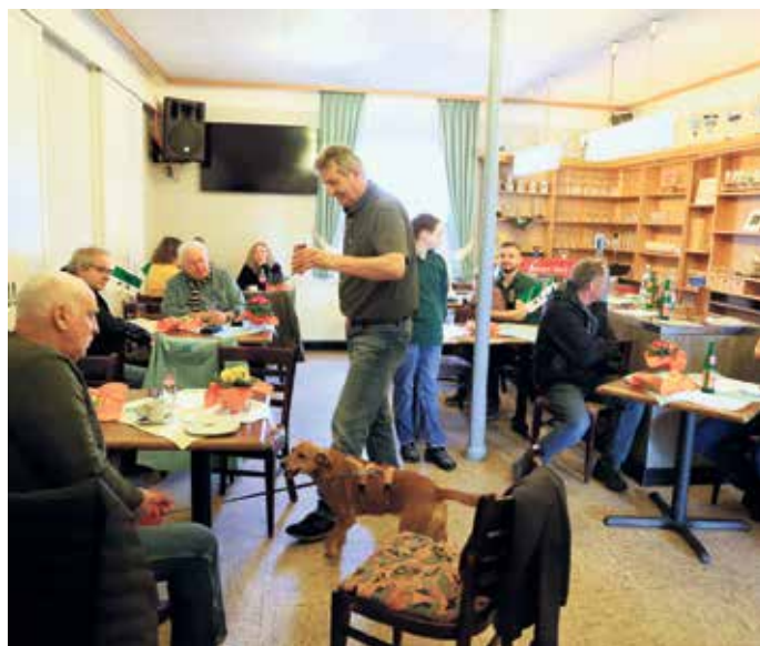
Bei selbstgebackenem Kuchen der Schützenfrauen, frischem Kaffee und kühlen Getränken genossen die Gäste ein geselliges Beisammensein, das den Frühling in Poll gebührend einläutete