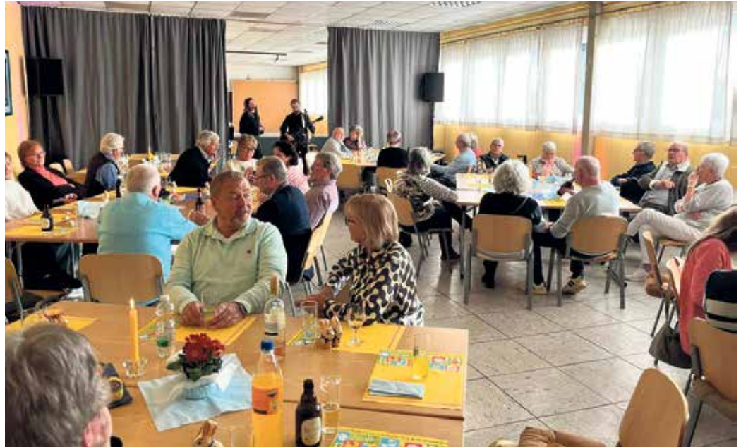
Seniorenachmittag in Frauwüllesheim

Alles in Allem war es ein unterhaltsamer, schöner Nachmittag/Abend für die Senioren. FH