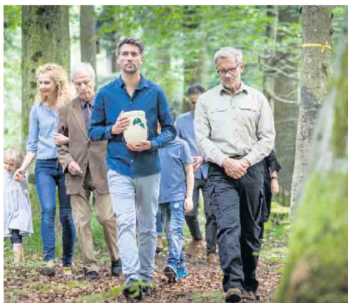
Urnenbeisetzungen sind in Deutschland die häufigsten Bestattungsarten.

Kosten sind direkt beim ausgewählten Anbieter zu erfragen. Für Urnenbeisetzungen, inzwischen die häufigste Form der Bestattung, ist die Kremierung Voraussetzung. Dessen Kosten werden oft über das gewählte Bestattungshaus abgerechnet. Wie hoch die Ausgaben für ein Urnengrab an sich ausfallen, hängt ebenfalls vom Individualfall ab. Beim Anbieter FriedWald beispielsweise kauft man entweder Grabrechte für eine Einzelruhestätte, das ist der Platz für die Urne unter einem selbst ausgesuchten Baum; oder alternativ für einen ganzen Baum, unter dem mehrere Familienmitglieder oder Freunde beerdigt werden können. Unter www.friedwald.de finden Interessierte eine konkrete Kostenaufstellung. Die Grabrechte für einen einzelnen Platz kann man ab 590 Euro erwerben, die für einen