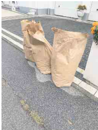
Variante mit Kraftpapiersack