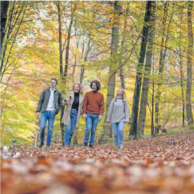
Wenn Angehörige das Baumgrab im Wald besuchen, geht es meistens nicht besonders förmlich zu.

Beisetzungen im Wald sind frei von traditionellen Vorgaben