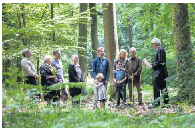
Die Beisetzungsfeiern in einem Friedhofswald sind individuell gestaltbar.