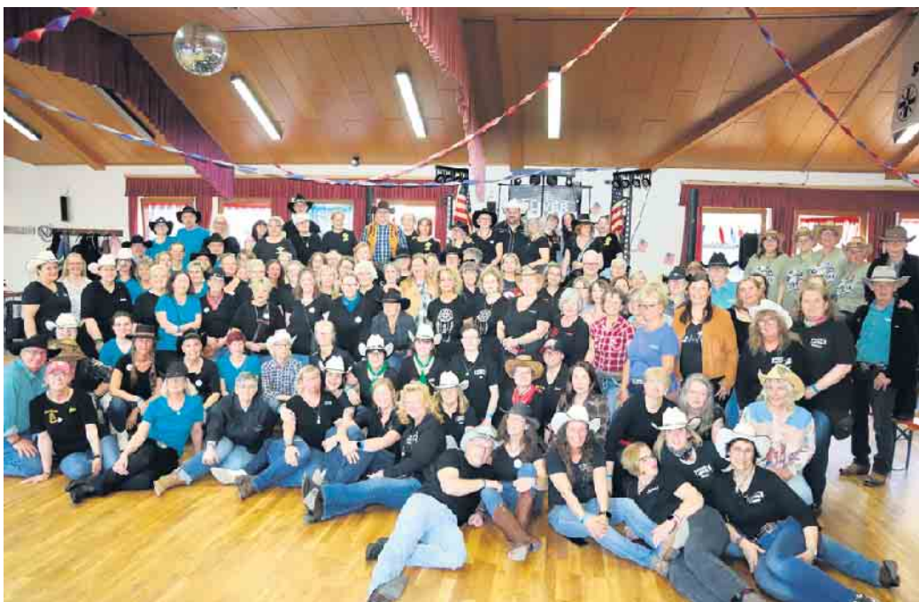
Die 170 Tänzerinnen und Tänzer beim Line Dance Workshop in Dorweiler - hier war richtig was los