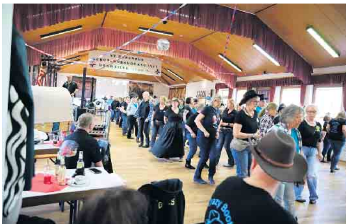
Die Crazy Boots weckten Lust auf die besondere Sportart

keinen Geringeren als Thunder Gomes dafür gewinnen. In der Szene ist er längst kein Unbekannter. Auf einem Festival in der Festhalle Birkesdorf lernten sich Biricik und Gomes kennen. Schnell war klar, dass sie einmal für einen Workshop zusammenfinden würden. Vor den Einheiten konnte sich im Saloon bei Kaffee, Kuchen und Snacks ordentlich gestärkt werden. Der Verkauf im Saloon wurde durch die Q2 des Gymnasiums Lechnich organisiert. Hiermit wollte