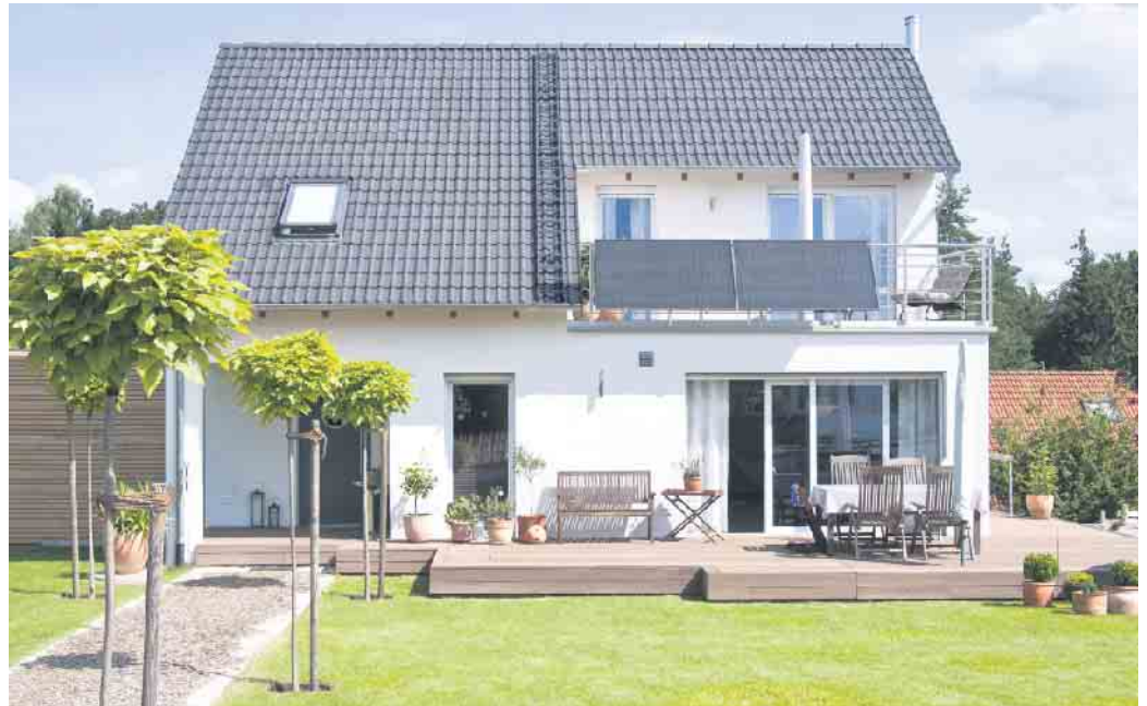
Balkonkraftwerke sind aber auch für Hauseigentümer interessant, die sich eine Photovoltaik-Anlage auf dem Dach nicht leisten können oder wollen.

Der Boom bei Balkonkraftwerken geht unvermindert weiter: Anfang Juni 2024 wurde erstmals die Marke von einer halben Million Mini-Solaranlagen überschritten, laut Bundesnetzagentur bedeutet dies eine Verdoppelung seit Mit-