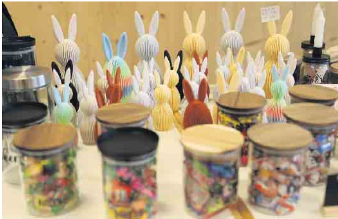
Der Osterhase wäre wieder stolz auf seine Mithelfer gewesen - in allen Farben leuchtete es zum Osterbasar des Fördervereins der Kindertagesstätte Burgmäuse e.V.