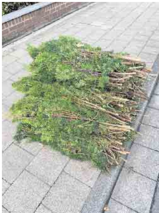
Variante mit Naturkordel

Am 14.04. findet die regelmäßige Grünschnittstraßensammlung im gesamten Gemeindegebiet statt. Es werden bis zu 1,5m 3 Gartenabfälle pro Haushalt abgeholt. Bitte kürzen Sie diese auf eine Länge von höchstens einem Meter und bündeln sie mit Naturkordel. Auch handelsübliche Kraftpapiersäcke werden mitgenommen. Wiederverwendbare Pop-up Behälter oder Kunststoffwannen werden nicht entleert.