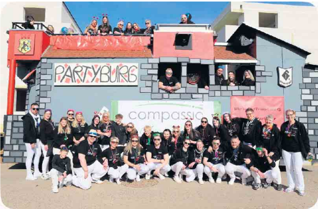
Der beeindruckende Wagen begeisterte nicht nur die Bewohner und Mitarbeiter, sondern auch viele Besucher des Nörvenicher Umzuges

Mitglieder beim Förderverein für einige Jahre Mitgliedschaft engagiert