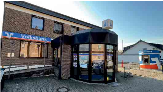
Die Volksbankfiliale in der Burgstraße, daneben der neue Geldautomat.