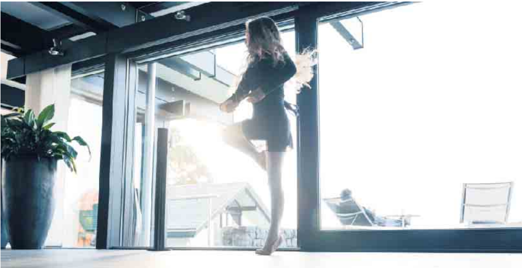
Ruhe genießen: Spezielle Schallschutzgläser halten den Alltagslärm draußen und verbessern so die Wohnqualität.

Störende Geräusche mit Lärmschutzglas abschirmen und die Wohnqualität verbessern