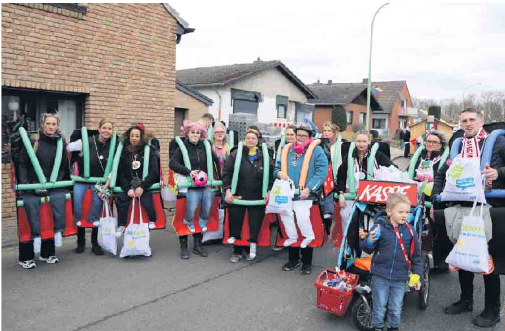
Als Fußgruppe fiel eine Stimmung machende Rommelsheimer Gruppe besonders ins Auge, die allesamt zu einer wilden Achterbahnfahrt aufgebrochen war

Ausnahmezustand in Rommelsheim: Bereits eine Woche vor dem offiziellen Straßenkarneval zogen zwei Großwagen und einige Fußgruppen durch den Gemeindeteil von Nörvenich. So schlängelte sich ein närrischer Lindwurm durch die Straßen bis hin zum Ausklang im örtlichen Sportheim. Im Zug selbst und an den Straßenrändern feierten gut gelaunt unter anderem Anstreicher, Außerirdische, Astronauten, Scouts, jede Menge Raubtiere und bunte Fantasiegestalten. Kamelle gab es reichlich, besonders die Kinder kamen voll auf ihre Kosten. Der eine oder andere Gast durfte sich auch über kleine Topfplanzen freuen, die unter anderem von den Piraten unter die Besucher herausgegeben wurden. Als Fußgruppe fiel eine Stimmung machende Rommelsheimer Gruppe besonders ins