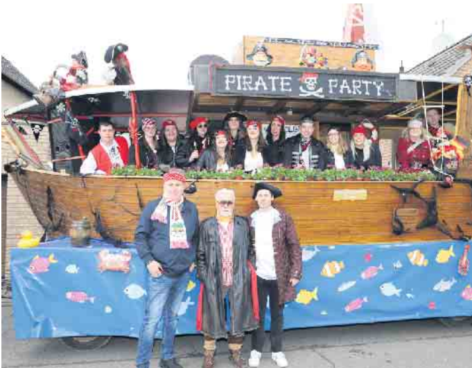
Beim Karnevalsumzug in Rommelsheim wurden friedliche Piraten gesichtet