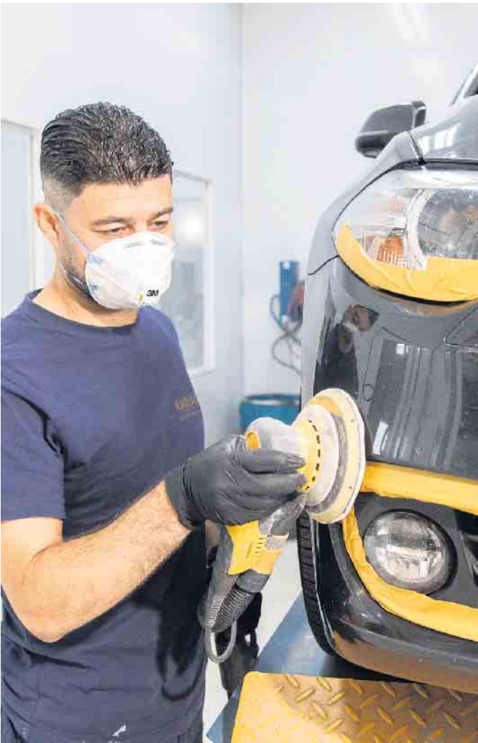
Die Reparaturkosten am Fahrzeug des Geschädigten übernimmt die Kfz-Haftpflichtversicherung des Unfallverursachers.

Menschen mit Führerschein den Vorschlag von Marco Buschmann ab. Parkschäden wie Dellen oder Kratzer am Auto kennen laut der Umfrage rund 80 Prozent der Fahrerinnen und Fahrer aus eigener Erfahrung - und sie sind sich einig darin, dass diese lästig sind. Mehr als 60 Prozent reagieren verärgert, wenn sie ihr Fahrzeug mit kleinen Schäden vorfinden und nicht wissen, wer daran Schuld hat. Allerdings: Nur weniger als ein Viertel erwartet, dass der Unfall-Verursachende die Polizei ruft oder sich persönlich entschuldigt. 70 Prozent erwarten Schadenregulierung 70 Prozent hoffen auf die Übernahme der Reparaturkosten. Diese zahlt grundsätzlich die Kfz-Haftpflichtversicherung der Person, die den Unfall verursacht hat. Passiert einem ein Parkrempler am eigenen Auto, kommt die Vollkaskoversicherung dafür auf. Durch die anschließende Hochstufung in der Schadenfreiheitsklasse kann das aber teuer werden. Der Kölner Versicherer bietet deshalb eine günstigere Reparatur über die Teilkaskoversicherung an. Einen Parkschaden an der Karosserie können Versicherte im Komfort- und Premium-Schutz einmal im Jahr in einer DEVK-Partnerwerkstatt im sogenannten Smart-Repair-Verfahren beheben lassen. Das kostet pauschal 50 Euro - ohne Hochstufung in der Schadenfreiheitsklasse. Unter www.devk.de/auto kann man sich über die Leistungen der Kfz-Versicherung informieren. Bis zum 30. November können viele ihre Police kündigen und zum neuen Jahr zu einem anderen Anbieter wechseln.(DJD)