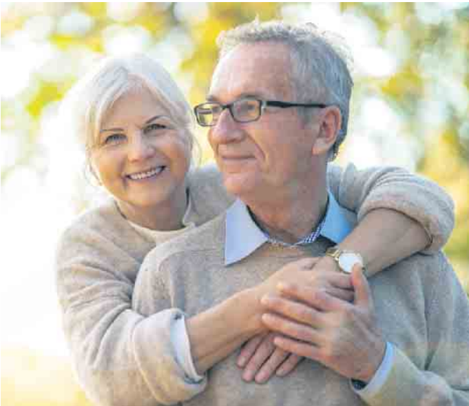
Viele Menschen bevorzugen individuelle Bestattungsformen und bestimmen bereits zu Lebzeiten das Prozedere für ihren letzten Gang.

und hoher Temperatur zu einem Erinnerungsdiamanten heran. Ein Rohdiamant kann auf Wunsch mit einer Lasergravur versehen werden. Unter Einhaltung der geltenden Corona-Bestimmungen können sich Interessierte auch ein Bild von der Manufaktur in der Schweiz machen. (djd)