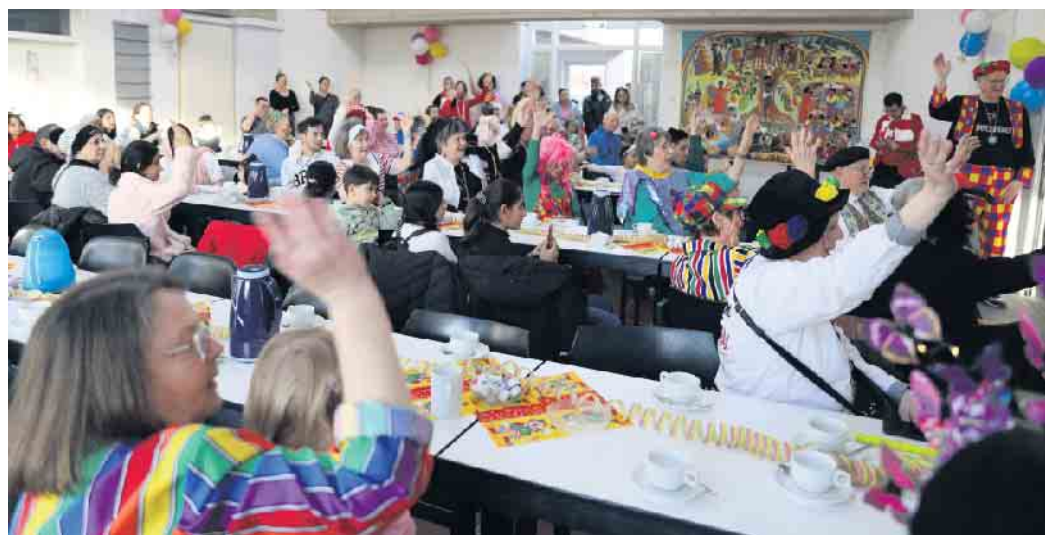
Nörvenich hilft! feierte mit Geflüchteten, Freunden, Helfern und Gästen gemeinsam