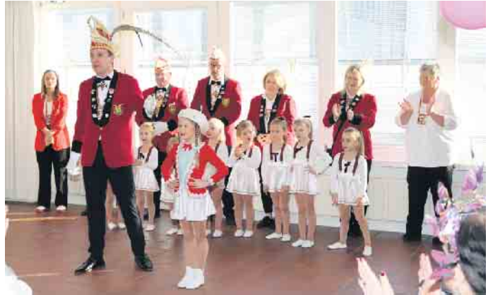
Schon Tradition ist, dass die Karnevalsgesellschaft Fidele Jonge Nörvenich 1932 e.V. beim Begegnungscafé im Karneval vorbei schaut

Alaaf durfte ebenso nicht fehlen wie eine große Polonaise durch das geschmückte Evangelische Gemeindehaus. FH