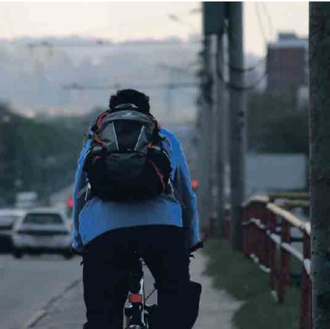
Zum Schutz aller Verkehrsteilnehmer bedarf es mehr gegenseitiger Rücksichtnahme.

berühren kann. Außerdem gilt es, aufmerksam auf Anzeichen wie eingeschlagene Räder, Brems- und Rückleuchten bei parkenden Autos zu achten. Auch sichtbare Kleidung und Reflektoren sind hilfreich, um nicht übersehen zu werden. Dooring-Unfälle verhindern können vor allem diejenigen, die die Autotür öffnen. Beim Aussteigen sollten sie grundsätzlich immer zuerst in den Seitenspiegel und dann über die Schulter schauen, bevor sie die Tür öffnen. Hier hilft der sogenannte Holländische Griff: Dabei wird die Fahrtür mit der rechten Hand geöffnet, der Oberkörper dreht so nach links und der Blick geht ganz automatisch nach hinten. Beifahrerinnen und Beifahrer öffnen ihre Türe entsprechend mit der linken Hand. In den Niederlanden gehört dieses Vorgehen standardmäßig zur Ausbildung in der Fahrschule. Bei manchen Autos liegen die Griffe bereits so weit hinten, dass der Holländische Griff automatisch angewendet werden muss, um das Fahrzeug zu öffnen. Darüber hinaus gibt es sinnvolle Assistenzsysteme, die die Insassen warnen, wenn sich ein Fahrzeug nähert oder die die Tür für eine Sekunde blockieren. (mid/ak-o)