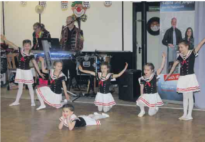
Der Auftritt der kleinen Wibbelstetze