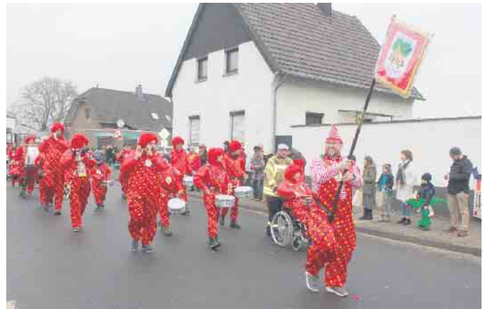
Angeführt wurde der bunte Narrenumzug von den Rommelsheimer Knöppelches Jonge. Musikalisch brachten sie die Besucher am Straßenrand in Stimmung