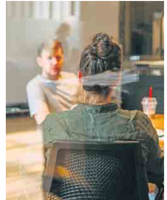
Dialog statt Monolog: Bei Vorstellungsgesprächen sollten auch Bewerber aktiv Fragen stellen.

Und eine Frage sollten Bewerber am Ende des Gesprächs keinesfalls vergessen: „Wann kann ich damit rechnen, wieder von ihnen zu hören?“ (djd)