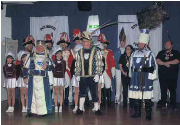
Der Party fieberte ganz besonders das diesjährige Irresheimer Dreigestirn der Fuul Fött mit