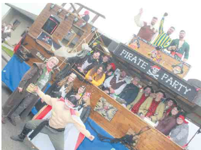
Die wilden Piraten des SV Alemannia Rommelsheim