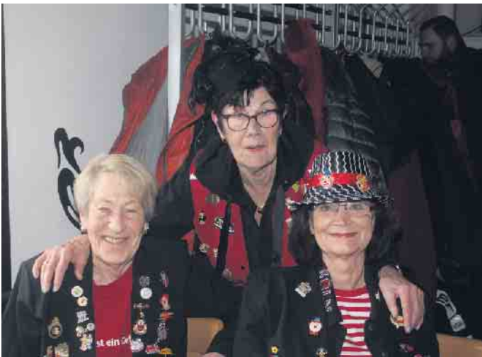
Diese Besucherinnen feierten das Programm des Seniorenachmittages

Spenden gefüllt werden konnte. In Anbetracht des Erdbebens in der Türkei und Syrien entschied sich die AWO dafür die Hälfte der Spenden einem besonderen Zweck zukommen zu lassen. Eine Großfamilie aus der Türkei hat bei den Geschehnissen 16 Familienmitglieder verloren. Die Verwandtschaft, die in Düren lebt, organisiert einen Hilfstransport. Da ist ein Teil der Spenden gut investiert