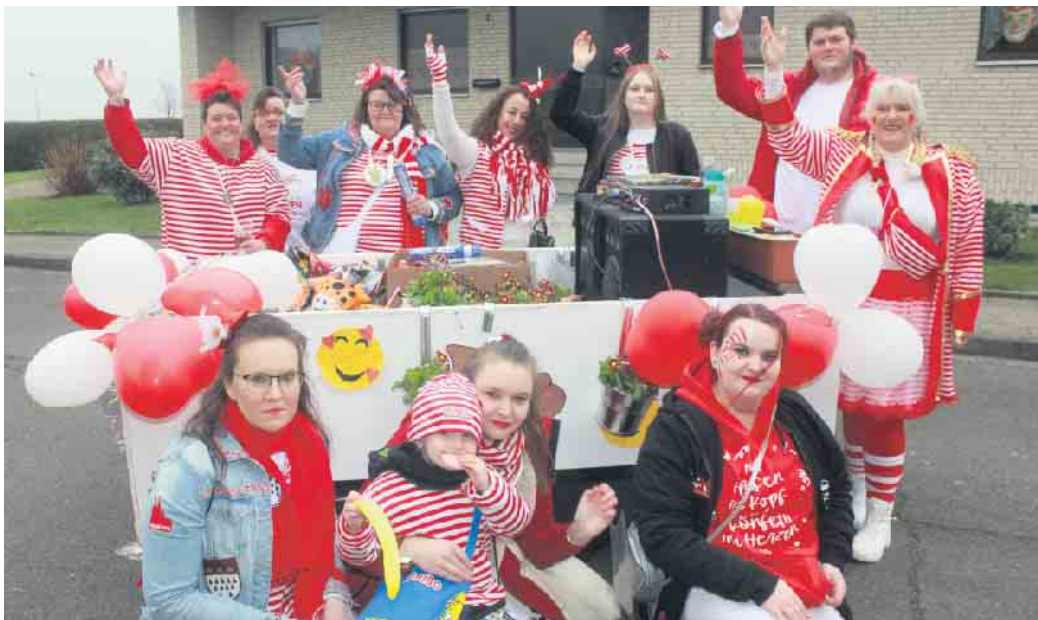
3x Rommelsheim Alaaf

Es war der erste Karnevalsumzug in der Gemeinde Nörvenich: der kleine aber feine Umzug am Samstag, 11. Februar in Rommelsheim. Auf einer Strecke von mehr als einem Kilometer machte sich der harrische Lindwurm auf den Weg durch die zahlreichen Straßen. Rommelsheim ist ein rund 500-Einwohner-Dorf. Die Initiative Rommelsheimer und Bubenheimer Kinder- und Jugendkarneval organisierte, wie in jedem Jahr, wieder den Umzug. Angeführt wurde der bunte Narrenumzug von den Rommelsheimer Knöppelchen Jonge. Musikalisch brachten sie die Besucher am Straßenrand in Stimmung. Das Wetter spielt für die Rommelsheimer Narren eigentlich keine Rolle - ob Regen, Schnee oder Sonne, in Rommelsheim heißt es immer: D'r Zoch kütt. Schließlich heißt es auch: wenn Karneval ist, dann ist Karneval und die Umzugswagen rollen. In diesem Jahr meinte es Petrus mit