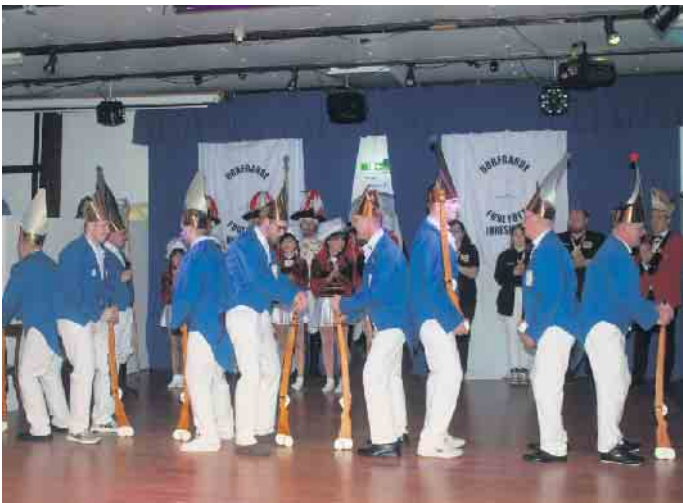
Die Dorfgarde präsentierte Stippföttche