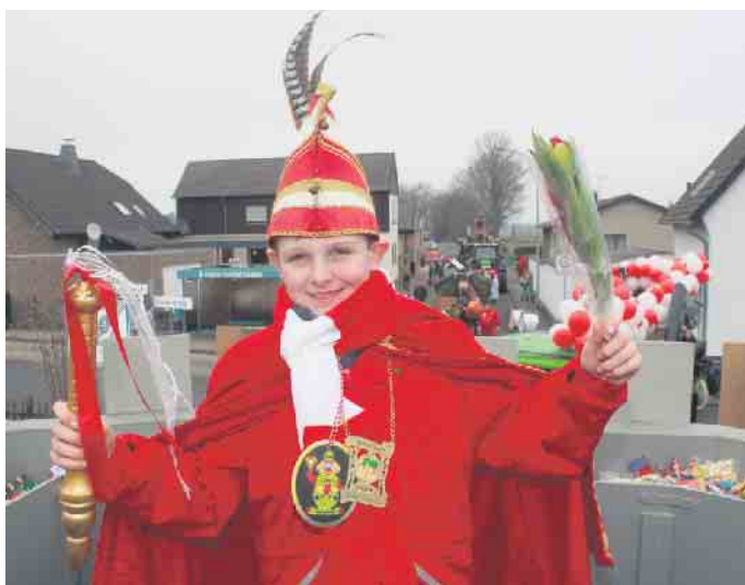
Luis I. strahlte mit den Besuchern am Straßenrand um die Wette