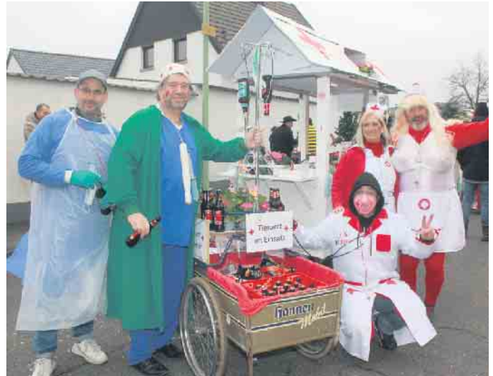
Diese Zugteilnehmer kümmerten sich um das Wohlergehen der Jecken