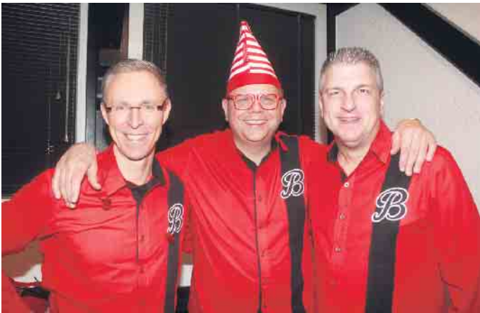
Die Stimmungsgaranten „Bremsklötz“