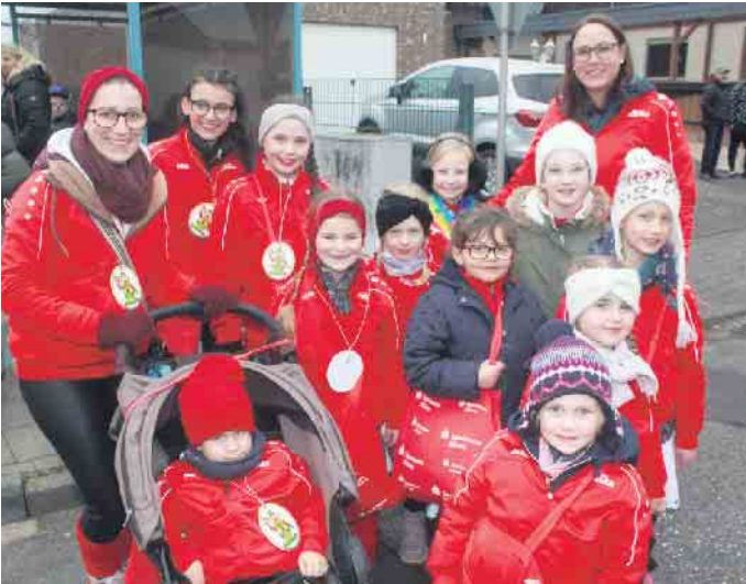
In Rommelsheim waren die Narren los