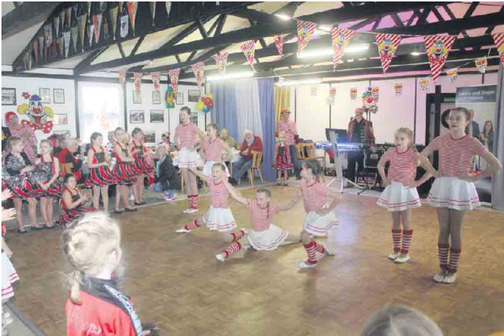
Die großen Wissersheimer Wibbelstetze

Für das leibliche Wohl war mit Kaffee, den beliebten Quarkbällchen sowie kühlen Getränken bestens gesorgt. Hierfür wurde keine Bezahlung erhoben. Wie in jedem Jahr stand ein Sparschein bereit, das mit