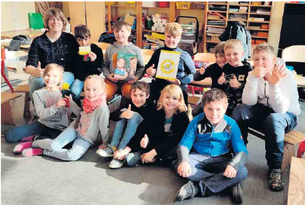
Anfang Februar erhielt die GGS Albertus Magnus das Klaro - Siegel

Am 7. Februar erhielt die GGS Albertus Magnus das Klaro - Siegel. Diese Auszeichnung erhalten Schulen, die mit dem Unterrichtsprogramm Klasse 2000 arbeiten. Es beinhaltet Unterrichtseinheiten zum Thema Gesundheitsförderung, Sucht- und Gewaltvorbeugung in der Grundschule. Mit Klasse 2000 und der Symbolfigur Klaro lernen die Kinder auf spielerische Art und Weise, aktiv und anschaulich von Klasse 1-4, wie sie ihren Alltag bewältigen können und dabei gesund und fit bleiben. Unterstützt werden die Lehrpersonen von speziell geschulten Gesundheitsförderern, die regelmäßig den Unterricht besuchen und Lerneinheiten übernehmen. Das Programm wird gefördert vom Gesundheitsamt des Kreises Düren sowie vom Bundesministerium für Gesundheit. Mittlerweile wurden mit dieser Maßnahme schon über zwei Millionen Kinder erreicht. FH