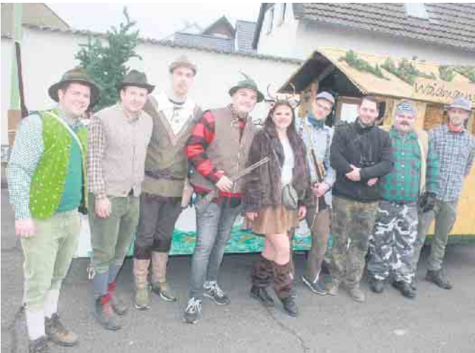
Hier hieß es neben Kamelle auch Waidmannsheil