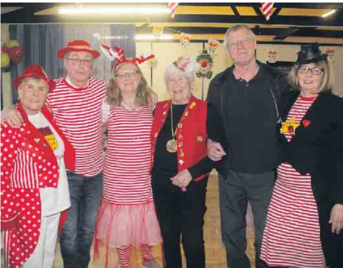
AWO Wissersheim ganz jeck: der Seniorennachmittag im Zeichen des Karnevals war ein voller Erfolg