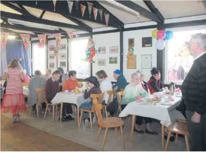
Gut besucht war die Karnevalsveranstaltung, zu der der AWO Ortsverein ins Wissersheimer Sportheim eingeladen hatte

einem kühlen Getränk zusammen und ließ den Nachmittag ausklingen. Ein Dank gilt auch den fleißigen Helfern, die zum Gelingen des Seniorennachmittags maßgeblich beigetragen haben. FH