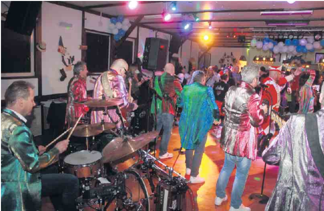
Bei der Jubiläumsparty kamen zudem ganz besondere Gäste vorbei. Zu fortgeschrittener Stunde gratulierten die „Kolibris“ musikalisch

Die Vorbereitungen für Karneval waren in Irresheim schon gut abgeschlossen. So konnte der Bürgerverein Irresheim e.V. zu seiner traditionellen Party am Wochenende vor Karneval einladen. Aufgrund Corona und den entsprechenden Einschränkungen konnten in dem Gemeindeteil der Gemeinde Nörvenich in den letzten Jahren bekanntlich leider keine Veranstaltungen rund um Karneval gefeiert werden. So freuten sich die Mitglieder des Bürgervereins umso mehr, dass sie in ihrem Jubiläumsjahr die Feierlichkeiten zum 50jährigen Bestehen des Vereins mit einer Wiederauflage der traditionellen Party an Karnevalssamstag starten konnten. Los ging es am 18. Februar pünktlich ab 20.11 Uhr. Die Jugendhalle war zu dem Zeitpunkt schon prächtig gefüllt. Von Nah und Fern