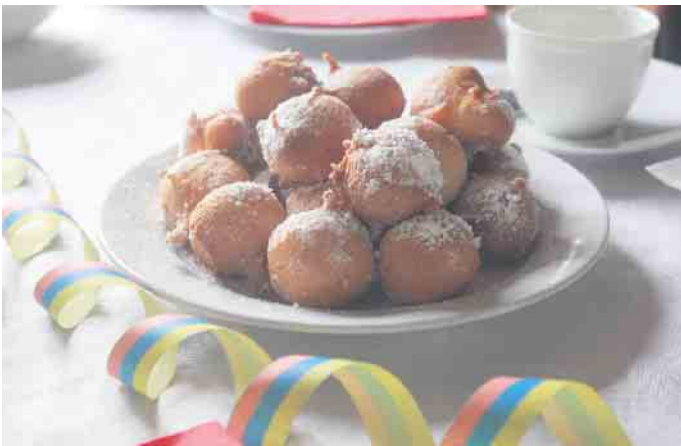
Für das leibliche Wohl war mit den beliebten Quarkbällchen bestens gesorgt