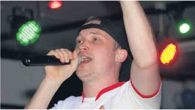
Sänger Drickes aus Nörvenich heizte den Jecken so richtig ein als musikalischer Eisbrecher