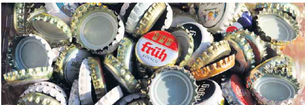
Kronkorken sammeln und gemeinsam Gutes tun

Kronkorken sammeln für den guten Zweck. In Nörvenich und darüber hinaus werden die Korken in Massen gesammelt - ob von Privatpersonen, Firmen, Sportvereine oder sogar von Briefzustellern - und das für den guten Zweck. Der Erlös geht an die Kinderkrebstation der Uniklinik Aachen. Die Idee dahinter ist simpel: Kronkorken nicht mehr in den Müll zu werfen, sondern abgeben! Und jeder Korken hilft. Also heißt es weiter: Kronkorken sammeln und gemeinsam Gutes tun! FH