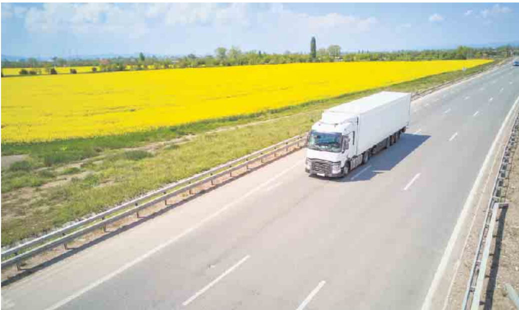
Kraftstoffe, die von unseren leuchtend gelben Rapsfeldern stammen, sparen bereits heute große Mengen CO 2 ein. Sie können eine wichtige Rolle bei der Verkehrswende spielen. Foto: DJD/Verband der Deutschen Biokraftstoffindustrie/Getty Images/Stanchev

Einheimischer Raps kann fossile Brennstoffe im Straßenverkehr ersetzen und er steht zudem für die Versorgung mit hochwertigen Futtermitteln und anderen wichtigen Koppelprodukten. Foto: DJD/Verband der Deutschen Biokraftstoffindustrie