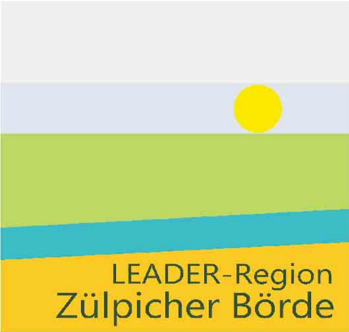
Logo: LAG Zülpicher Börde e.V.

ven Maßnahmen, welche innerhalb des laufenden Jahres umgesetzt werden können und in die lokale Entwicklungsstrategie der LEADER-Region Zülpicher Börde einzuordnen sind. Projektideen können bis zum 11. April eingereicht werden. Nur digitale, vollständig eingereichte Projektanträge können berücksichtigt werden. Die Antragsunterlagen sowie weitere Informationen zum Förderprogramm finden Sie auf unserer Website unter https://www.zuelpicherboerde.de/download-kleinprojekte/ Die Förderung erfolgt vorbehaltlich einer Gewährung der Fördermittel durch das Ministerium für Landwirtschaft und Verbraucherschutz des Landes Nordrhein-Westfalen. Die Höhe der Fördersumme für unsere Region steht zum jetzi-