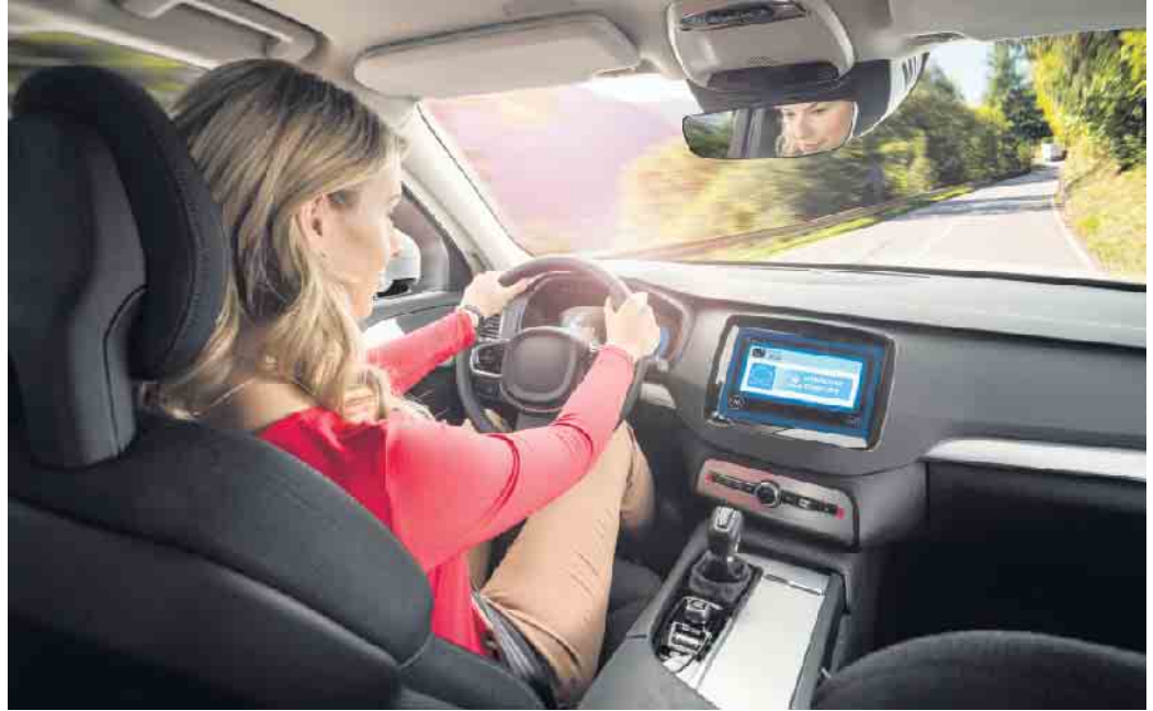
Moderne Software-Systeme und vielfältige Anwendungen machen aus dem Auto einen Computer auf vier Rädern.

Die Integration des Autos in die digitale Welt bedeutet zudem,