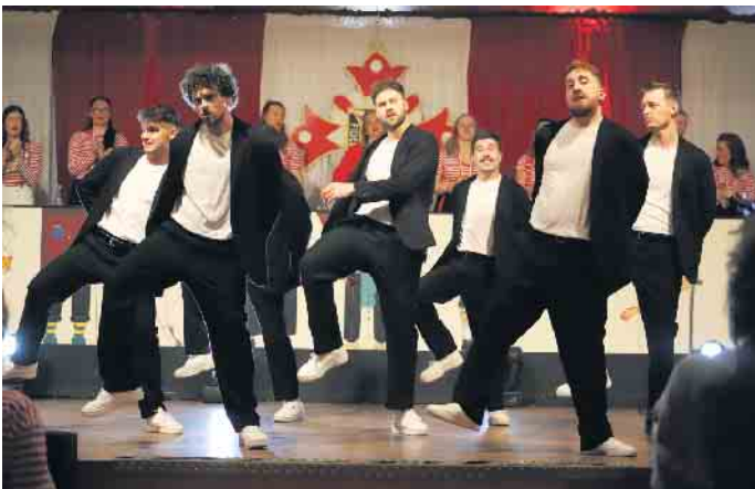
Erstmals zeigten sich die Fauth Dance „Gentlemen“ auf der Bühne. Vor Begeisterung standen die Damen sogar auf den Tischen