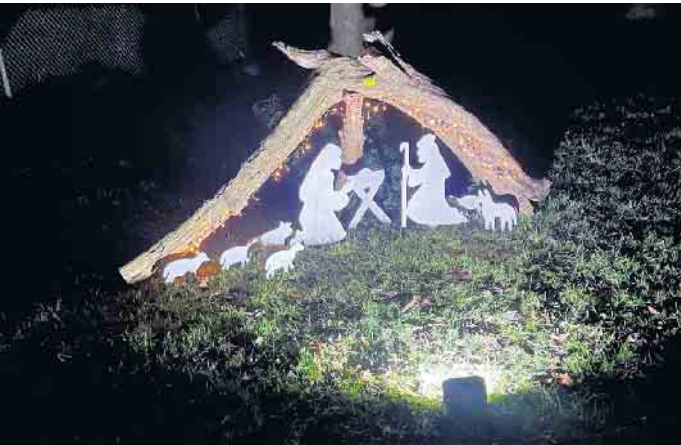
Eine der Krippen