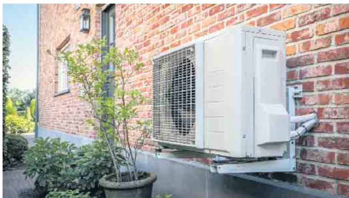
Moderne Wärmepumpen eignen sich auch für die Modernisierung und energieeffiziente Beheizung älterer Wohnhäuser.

Wärmepumpen mit der Wärmequelle Luft werden für Privathäuser