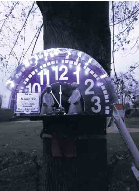
Mit einer Botschaft

Schön bei der Eröffnung des Weges am 15. Dezember 2024 waren viele Eggersheimer, aber auch Interessierte aus den Nachbardörfern dabei. An den Tagen danach waren immer wieder Besucher, sowohl tagsüber, als auch bei Dunkelheit bei den Krippen zu sehen. Bis zum 6. Januar 2025 waren die Krippen zugänglich und wurden danach wieder abgebaut. Wer weiß - vielleicht gibt es ja eine Fortsetzung rund um das nächste Weihnachtsfest.