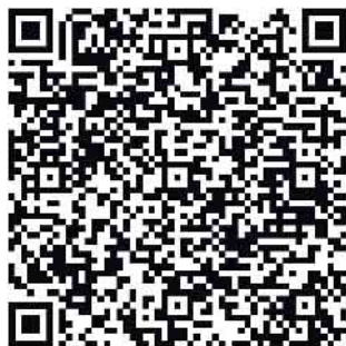
Ratgeber zur Krisenvorsorge des Bundesamtes für Bevölkerungs- und Katastrophenschutz