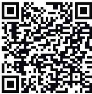
Krisenvorsorgebroschüre der Gemeinde Nörvenich

„So etwas kann passieren und der Staat wird nicht allen gleichzeitig helfen können!“ ist die geringste Erkenntnis, die wir alle aus dem Geschehen ziehen sollten. Jeder Einzelne ist gefordert Eigenvorsorge zu betreiben. Haben Sie Wasser- und Lebensmittelvorräte für mehrere Tage im Haus, eine Bargeldreserve oder sogar einen eigenen Stromgenerator und einen vollen Benzinkanister dafür? Wichtig ist, jetzt über diese Dinge nachzudenken und sich einen eigenen Krisenvorsorgeplan zu machen und diesen dann auch umzusetzen. Hilfreich kann dabei der Ratgeber zur Krisenvorsorge des Bundesamtes für Bevölkerungs- und Katastrophenschutz sein, den Sie unter diesem QR-Code aufrufen können und auch die Krisenvorsorgebroschüre der Gemeinde Nörvenich gibt wichtige Hinweise für den Krisenfall.