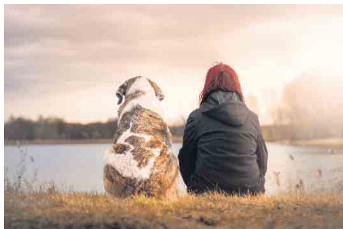
Wenn der beste Freund des Menschen geht, kann eine Tierbestattung Trost spenden.