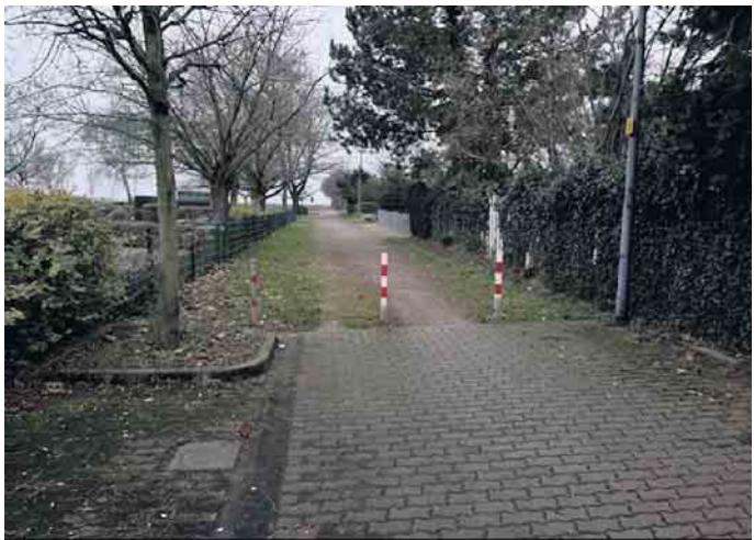
Zustand vor der Umsetzung der Maßnahme.