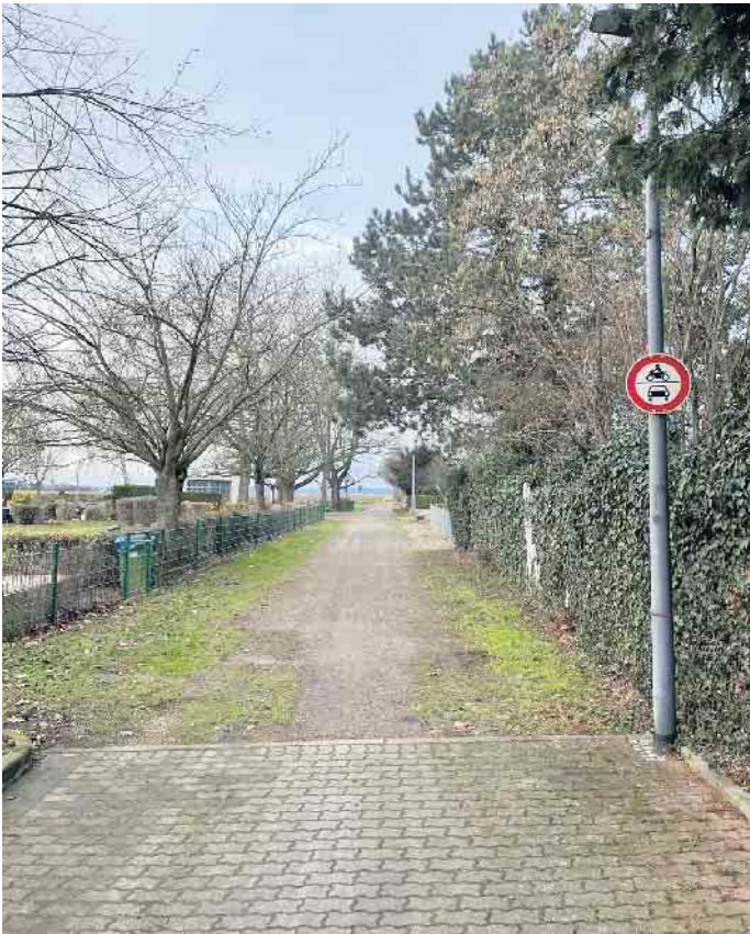
Zustand nach der Umsetzung der Maßnahme.

standes oder Wegfalls von Verkehrseinrichtungen wurde durch die Gemeindeverwaltung umgesetzt. Die Gemeindeverwaltung bittet daher um Ihr Verständnis und um Beachtung ggfls. neuer Verkehrszeichen und Regelungen. Für weitere Rückfragen steht das Ministerium für Umwelt, Naturschutz und Verkehr des Landes Nordrhein-Westfalen unter poststelle@munv.nrw.de sowie die Straßenverkehrsbehörde des Kreis Düren unter amt65@kreis-dueren.de per E-Mail zur Verfügung.