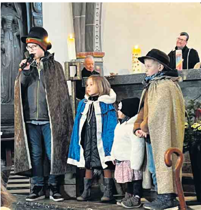
Hirten bei der Krippe

der bei der Sache sind. Aber ohne die Unterstützung der Eltern wäre eine Aufführung gar nicht möglich. Sie üben die Texte mit den Kindern zu Hause ein und kommen regelmäßig mit den Kindern zu den Proben. Eine tolle Sache. Manche Kinder machen bereits beim Krippenspiel seit mehreren Jahren mit, andere Kinder kommen neu hinzu. Dabei helfen immer die älteren Kinder den jüngeren. Anfang Dezember wird dann für jedes Kind nach einem Kostüm entsprechend der Rolle geschaut. Manche Eltern sind da sehr kreativ und so wird hin und wieder sogar ein Kostüm genäht, damit sich alle wohlfühlen in ihrer Rolle. Das Krippenspiel von 2025 hieß: Der Stern von Bethlehem. Ein Kind war der Sternträger, der den hell erleuchteten Stern stolz in den einzelnen Szenen zeigte. Neben Maria und Josef traten auch Hirten und Schafe - dargestellt von Kindern -, Engel und die drei Könige auf. Eine Erzählerin erläuterte immer das Geschehen