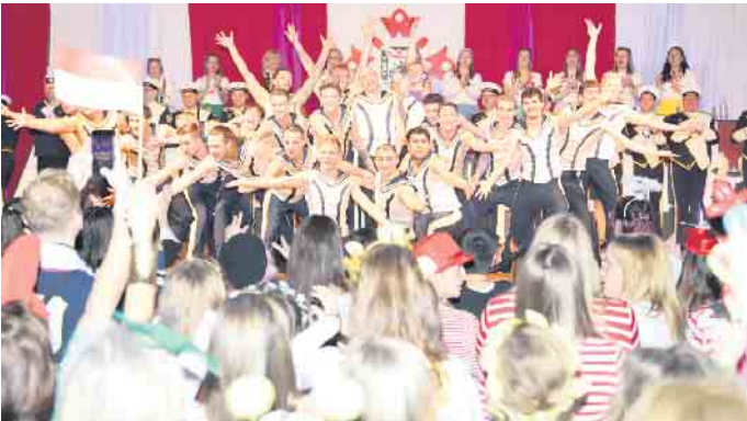
Einen umjubelten Auftritt hatte die Stattgarde Colonia Ahoj, die mit der Bordkapelle, dem Chanty-Chor und der Tanzgruppe (Bild) nach Nörvenich angereist sind

Ausgelassene Stimmung und gemeinsames Feiern