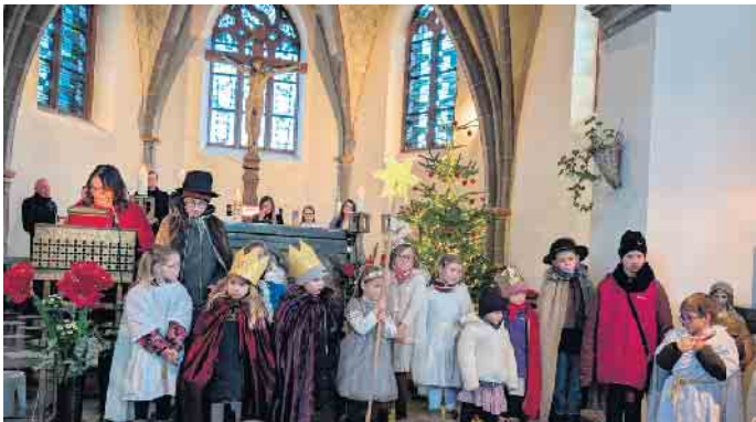
Gruppenbild des Ensembles

Bereits im September jeden Jahres fangen in Rommelsheim die Vorbereitungen für das Krippenspiel an. Alle Kinder, die gerne mitmachen wollen, teilen mit, welche Rolle sie bekleiden möchten und ob sie eine Sprechrolle oder „nur“ schauspielern möchten. Danach wird das Krippenspiel von Ursula Belke individuell für die Kinder geschrieben. Anfang November bekommen alle ihren Text und man beginnt mit den Proben. Es ist immer wieder schön, mit welcher Begeisterung die Kin-