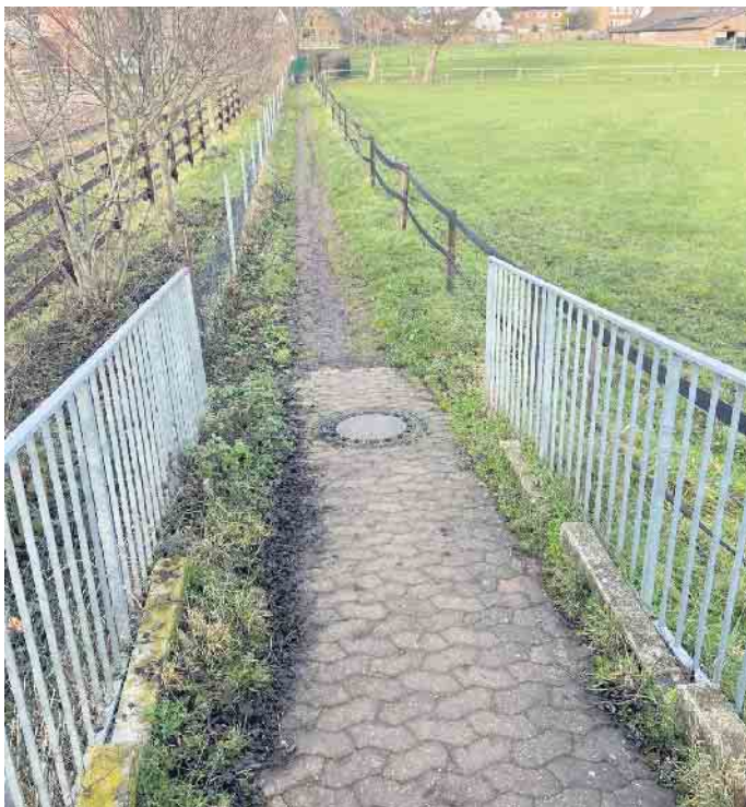
Fußwegeverbindung Hirtstraße - Promenadenweg