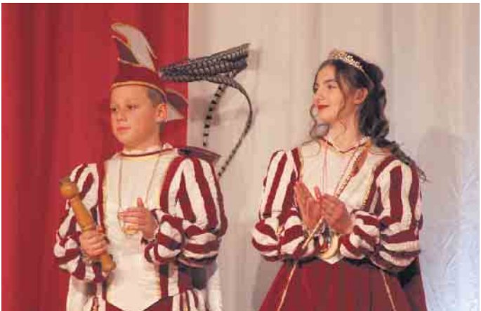
Das Jugendprinzenpaar aus Arnoldsweiler