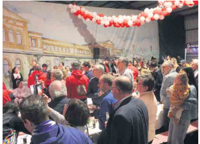
An diesem Tag jubelten rund 100 kleine und große Jecken in der Halle auf dem Getrudenhof dem neuen Regenten zu