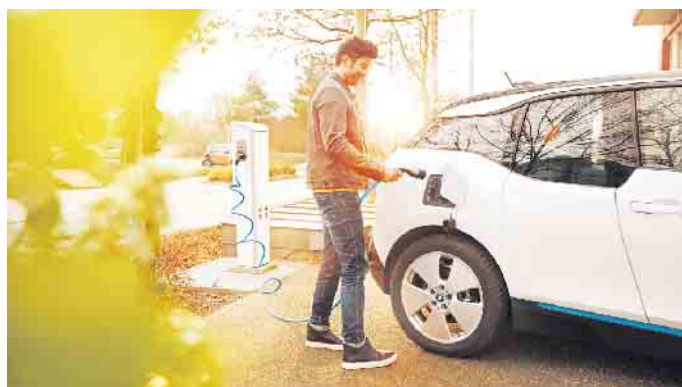
Die Ladeinfrastruktur für E-Autos ist in Deutschland und dem gesamten mitteleuropäischen Raum inzwischen gut bis hervorragend ausgebaut.

Elektroautos - mit bis zu 9.000 Euro Kaufprämie. Und je nach Erstzulassung des E-Autos werden bis zu zehn Jahre Kfz-Steuer-Befreiung gewährt. Danach gibt es immer noch eine Ermäßigung von 50 Prozent. Vor allem aber hat ein E-Auto weniger verschleiß- und schadensanfällige Teile als ein Verbrenner. Daher sind die Kosten für Wartung und Service im Schnitt 35 Prozent geringer. Und was kaum jemand weiß: Wer ein E-Auto besitzt oder sich neu anschafft, kann dank der THG-Quote eine Prämie von bis zu 345 Euro jährlich kassieren, unter www.lichtblick.de/e-mobilitaet gibt es mit einem Klick auf „THG-Prämie sichern“ weitere Infos. (djd)