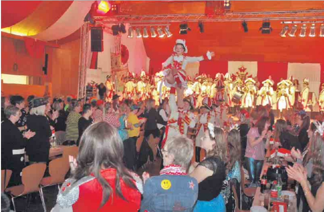
Der karnevalistischen Reigen eröffnete sich nach der Begrüßung mit der „Lechenicher Stadtgarde - Traditionscorps der Lechenicher Narrenzunft 1936 e.V.“

Das weibliche Geschlecht hat wieder so richtig gerockt