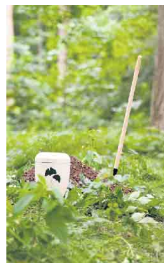
Im Wald werden ausschließlich biologisch abbaubare Urnen beigesetzt.