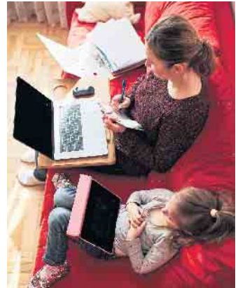
Mobiles Arbeiten kann bequem, aber gleichzeitig auch belastend sein.

Auch im mobilen Office muss ein gewisser Gesundheitsstandard eingehalten werden. „Der Arbeitnehmer darf auch hier weder physischen noch psychischen Gefahren ausgesetzt werden“, so Frank Preidel. Doch dies zu gewährleisten sei nicht immer leicht - etwa wenn das Office auf die Wiese im Park verlegt wurde. (djd)