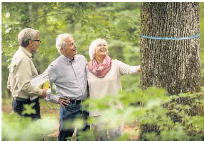
Ein freier Baum, der als Ruhestätte infrage kommt, ist mit einem farbigen Band markiert.

Kostenlose Waldführungen informieren über mögliche Arten einer Grabstätte