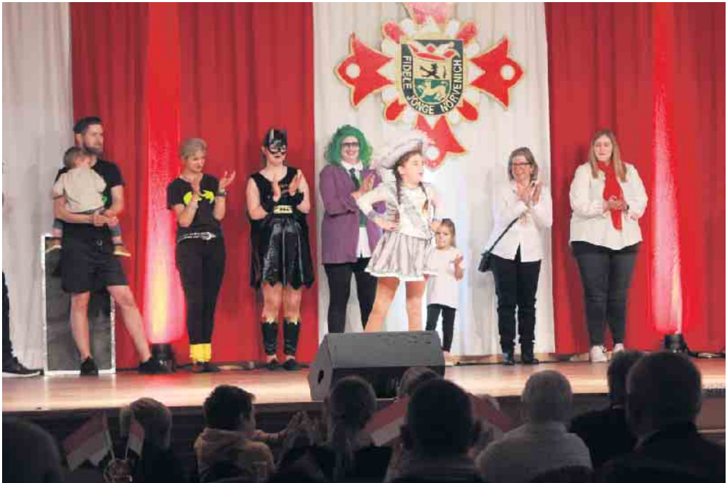
Nach einer kleinen Pause in den letzten beiden Jahren herrschte beim Jecke Biwak im Rahmen der laufenden Session am 7. Januar in der Neffeltalhalle närrische Stimmung

Biwak in der voll besetzten Neffeltalhalle