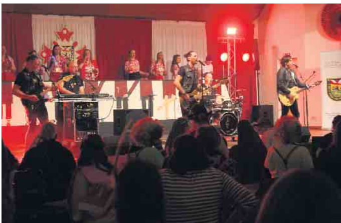
Die fünf Musiker der Band „Echte Fründe“ brachten in dieser Session die anwesenden Damen so richtig in Stimmung