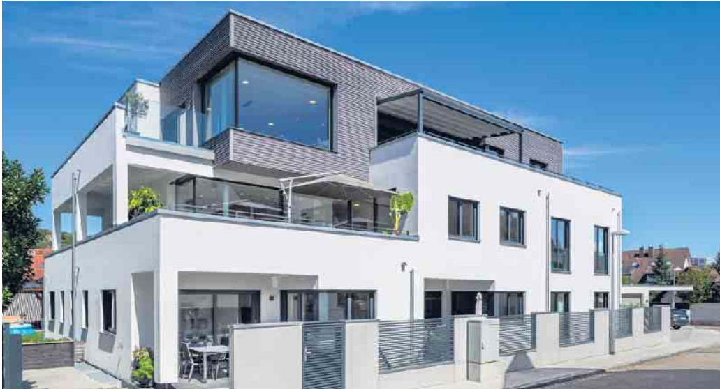
Mehrgenerationenhäuser in Holz-Fertigbauweise sind im Kommen.

Mehrgenerationenhäuser aus Holz sind ein zukunftssicheres Zuhause für die ganze Familie