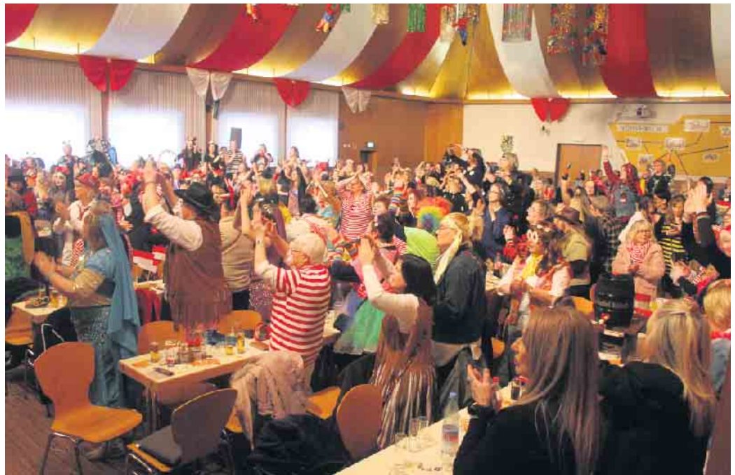
Damensitzung in Nörvenich - das weibliche Geschlecht hat die Neffeltalhalle wieder so richtig gerockt