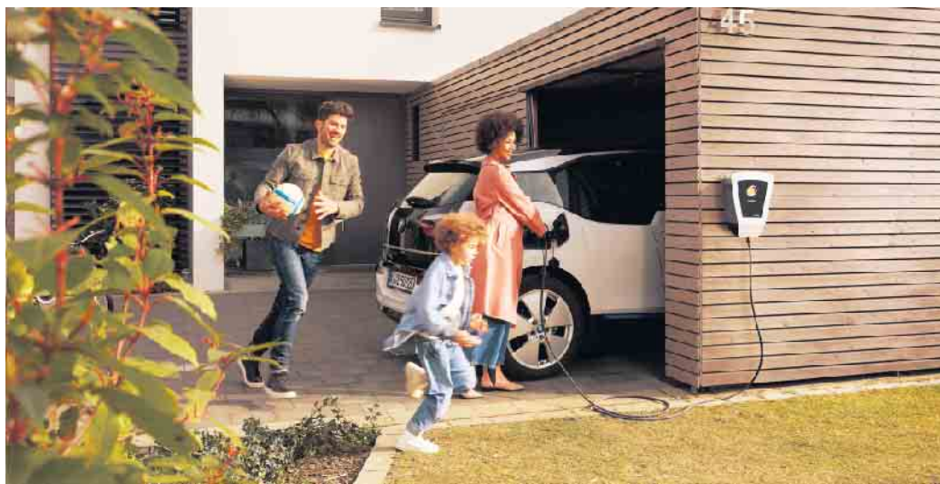
Ob zu Hause oder unterwegs: Das Laden des E-Autos sollte mittlerweile kein Problem mehr sein.

Sind E-Autos wirklich klimafreundlicher als Verbrenner? Darüber gibt es immer wieder Diskussionen angesichts der benötigten Ressourcen zur Herstellung der Batterie