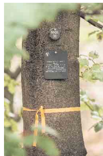
Jeder Baum, der ein Grab beherbergt, ist mit einer Nummer gekennzeichnet. Eine Namenstafel erinnert an die Verstorbenen.

den. Für die Angehörigen ist es später kein Problem, die Grabstätte zu jeder Tageszeit zu besuchen: Jeder ausgewählte Baum ist mit einer Nummer gekennzeichnet und sowohl in einem Register bei der Kommune als auch beim Anbieter eingetragen. Über die Baumnummer können Kinder, Freunde und Verwandte die Ruhestätte des verstorbenen Menschen jederzeit finden. Ein Lageplan am Eingang jedes Waldes hilft bei der Orientierung. (djd)