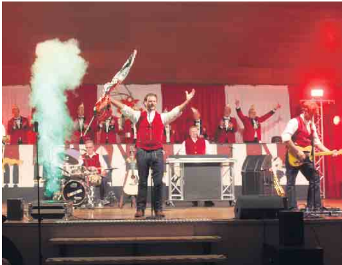
Die „Rabaue“ eskalierten gemeinsam mit den Herren der Schöpfung