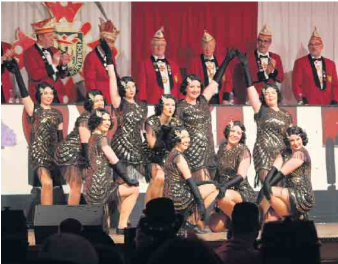
Tänzerisch überzeugten die Dance Stars der Fidele Jonge