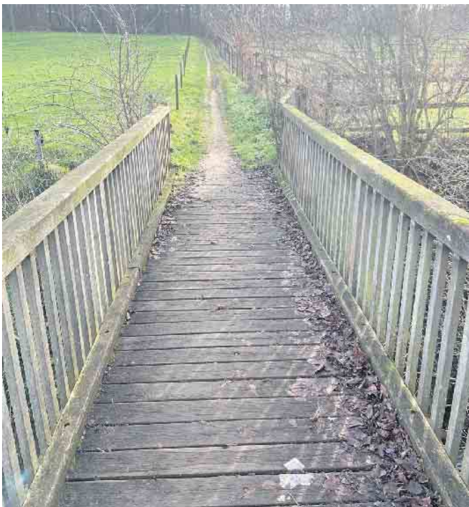
Fußwegeverbindung Hirtstraße - Promenadenweg

Die Umsetzung des Masterplanes Nörvenich erfolgt mit Mitteln der sog. Städtebauförderung von Bund und Land Nordrhein-Westfalen - die Gemeinde erhält zu den Baumaßnahmen einen Kostenzuschuss von 70%. Gemeinsam mehr aus Nörvenich machen!