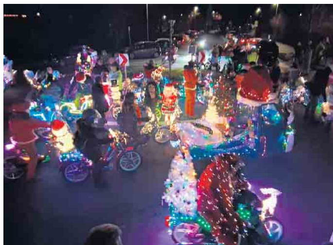
Auch der örtliche Motor-Sport Club schaute auf seiner Rundfahrt beim Weihnachtsmarkt vorbei