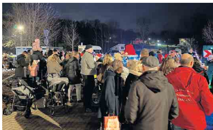
Am 13. Dezember fand in der Wohnanlage Am Schloss in Nörvenich der zweite Weihnachtsmarkt statt

Der zweite Weihnachtsmarkt in der Wohnanlage Am Schloss war somit ein voller Erfolg und ein schönes Zeichen für gelebtes Miteinander in der Vorweihnachtszeit. FH