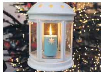
Das Friedenslicht im Evangelischen Gemeindehaus in Nörvenich

dem ergänzenden Slogan „- ein Leuchten in der Dunkelheit“, um Hoffnung und Zuversicht durch kleine Taten zu verbreiten. FH