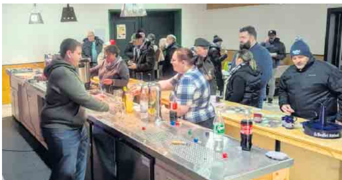
Vier Tage vor dem Heiligen Abend versammelte man sich am Schützenheim. Die Schützen hatten alles, was zu einem gemütlichen Beisammensein benötigt wird, bereitgestellt