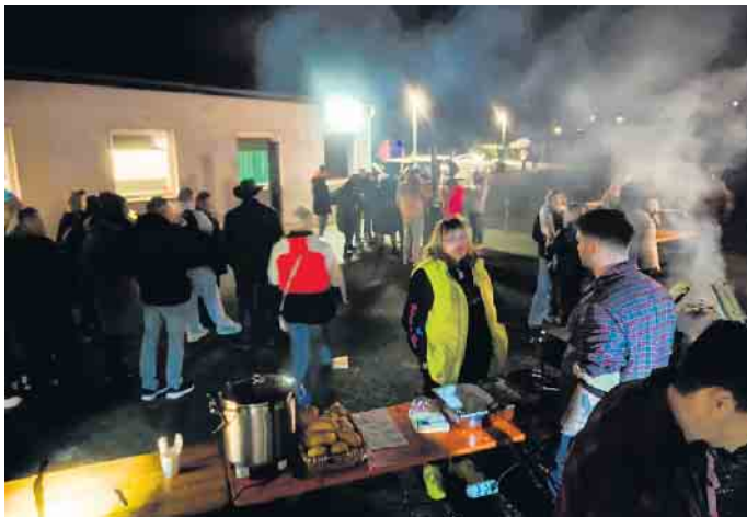
Am 20. Dezember lud die Sankt Sebastianus Schützenbruderschaft Wissersheim 1888 e.V. zu einem weihnachtlichen Nachmittag ein

Die Besucher kamen reichlich und genossen den Glühwein, die Kinder den Punsch und auch so manch anderes Kaltgetränk wurde an diesem Samstag verzehrt. Für den kleinen Hunger zwischendurch war natürlich auch wieder bestens gesorgt. Hier hab es Flamlachs, gebratene Champignons und Bockwürste, welche nicht nur lecker waren sondern bei den kalten Temperaturen auch bestens von innen wärmten. Bei vielen schönen Gesprächen ließ man das Schützenjahr Revue passieren und freute sich auf das anstehende Weihnachtsfest und das neue Jahr 2026. FH