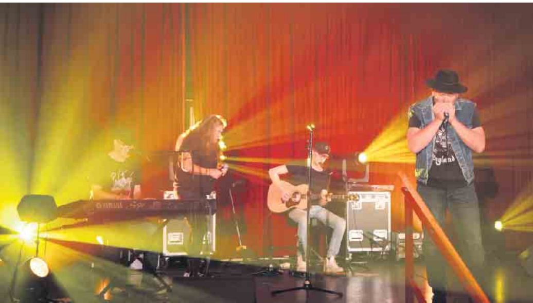
Die Band mit „Hölgi“ an der Harp

(KlKe) Die Plakate für das Konzert am letzten Samstagabend im gut gefüllten Saal Zur Post