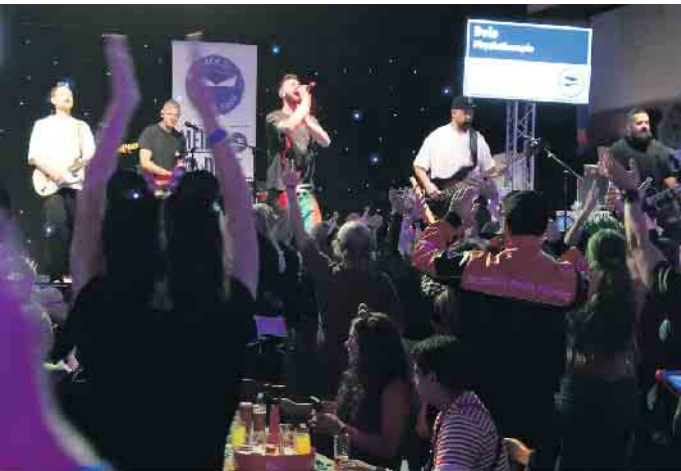
„Stadtrand“ rockte die Bühne mit ihren bekannten kölschen Liedern.

hochkarätigen Acts geprägt. Die Band Stadtrand brachte den Saal mit ihren Hits zum Kochen, bevor die Jecke Fründe für kölsche Töne sorgten. Den krönenden Abschluss lieferte die Gruppe Eldorado, die bis in den späten Abend für ausgelassene Stimmung sorgte. Auch DJ Herr Dirk heizte den Gästen zusätzlich ein. Mit einer Jecken-Gebühr von 15 Euro bot die Veranstaltung ein Programm, das keine Wünsche offen ließ: Tradition, Musik und Gemeinschaft - Mondorf hat einmal mehr gezeigt, dass man auch „klein aber fein“ feiern kann.