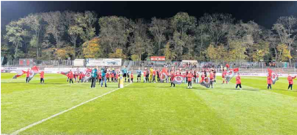
Die LüRa im Sportpark Höhenberg.

(MvG/A. Tillmanns) Am Freitag, 31. Oktober, erlebte die U11 der SpVgg Lülsdorf-Ranzel einen ganz besonderen Fußballabend. Beim Drittliga-Spiel zwischen Viktoria Köln und dem FC Ingolstadt 04 durften die jungen Spieler als Fahnenkinder die Profimannschaften beim Einlaufen auf den Rasen des Sportparks Höhenberg begleiten. Bereits vor dem Anpfiff war die Begeisterung groß. Mit sichtbarem Stolz und voller Aufregung trugen die Kinder die Viktoria-Fahnen auf das Spielfeld und sorgten so für eine eindrucksvolle Kulisse vor den zahlreichen Zuschauern. Besonders aufregend: Die Partie wurde live im Fern-