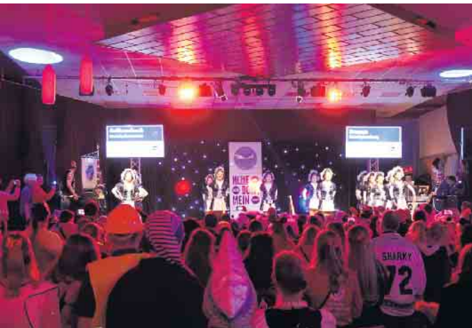
Die Tanzgarden der 1. MKG sorgten für Stimmung im Saal.