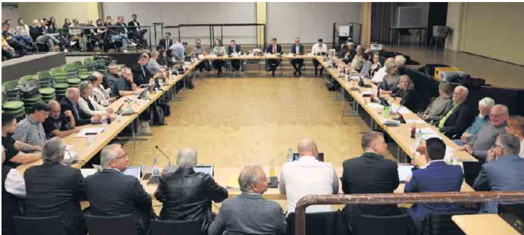
Der neue Stadtrat von Niederkassel und die Verwaltungsspitze bei der ersten Sitzung