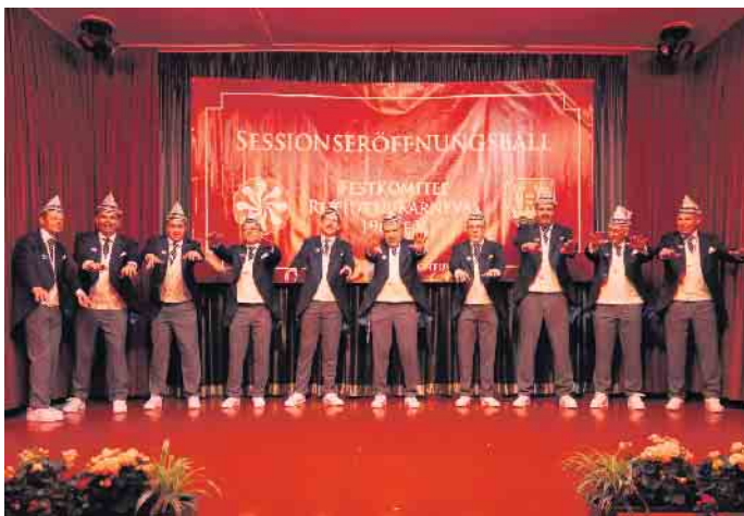
Das Gefolge des Rheidter Prinzen

Beide Veranstaltungen zeigten eindrucksvoll, wie eng die Karnevalsfamilien in Niederkassel miteinander verbunden sind. Die gegenseitigen Besuche der Gesellschaften, die gemeinsame