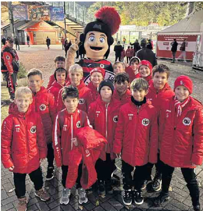
Die Kicker der U11 mit Viktor, dem Maskottchen der Viktoria

Montag bis Freitag von 06:30 Uhr bis 19:00 Uhr Samstag und Sonntag von 10:00 Uhr bis 17:00 Uhr