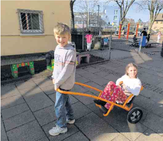
Die Kinder-Rikscha wird im Team genutzt.

sich die Kinder in ihren OGS-Gruppen beraten und gemeinsam entschieden, welche Fahrzeuge sie anschaffen möchten. Die Wahl fiel auf Kinder-Rikschas und sogenannte Foot-Twister. Die Nutzung beider Fahrzeugtypen erfordert ein gewisses Maß an Konzentration, Bewegungskoordination und Körperbeherrschung.