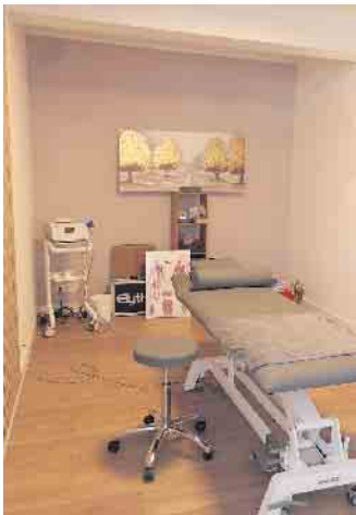
Einer der Behandlungsräume

für alle Altersgruppen runden sein Angebot ab. Seine Philosophie „Qualität vor Quantität“ spiegelt sich in der ganzheitlichen Behandlung wider, bei der Bewegung stets im Mittelpunkt steht. Interessierte können Termine nach Vereinbarung per WhatsApp unter der Nummer 0163-7609626 oder über Doctolib buchen. Die Praxis befindet sich in der Brüsseler Straße 42, 53859 Niederkassel, mit dem Eingang an der Limassoler Straße. Kleser freut sich darauf, seine Patienten auf ihrem Weg zu mehr Gesundheit und Wohlbefinden zu begleiten.