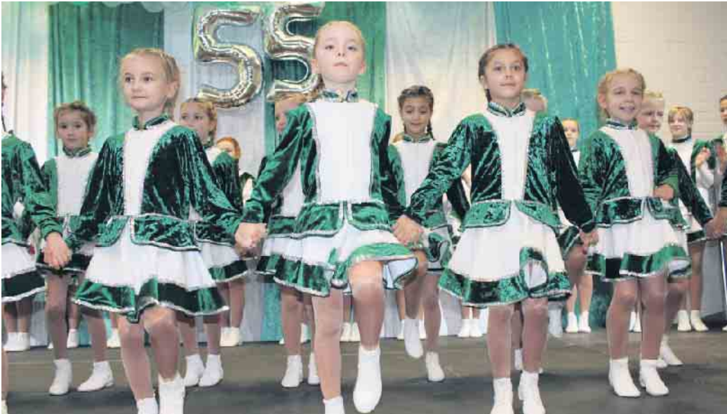
Der Spaß stand trotzdem an vorderster Stelle.

Spendensammeln, bei der VR-Bank Bonn Rhein-Sieg. Die Bank steuert unter dem Motto „Viele schaffen mehr“ auch etwas dazu. Der Link dorthin lautet: https://kurzlinks.de/gardeausflug Die KG Grün-Weiss sagt danke!