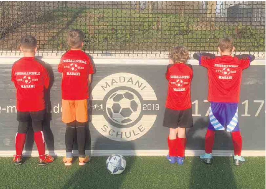
Die neuen Trainingsshirts von hinten