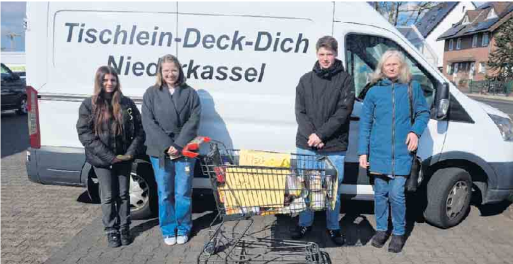
Die fleißigen Helfer

Der besondere Dank gilt den Firmanden und den Organisatoren der Aktion, die ihre Freizeit für die gute Sache geopfert und mit viel Engagement die Spenden gesammelt haben.