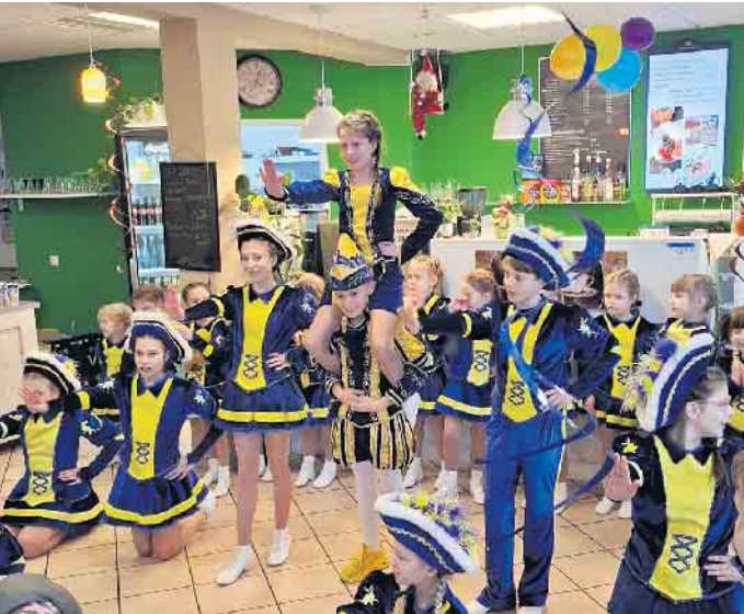
Kinderprinzenpaar mit Garde der IGK Blau-Gelb Niederkassel

Kinderprinzenpaar und „Wonneproppen“ der IGK Blau-Gelb Niederkassel im Café Sonnenschein