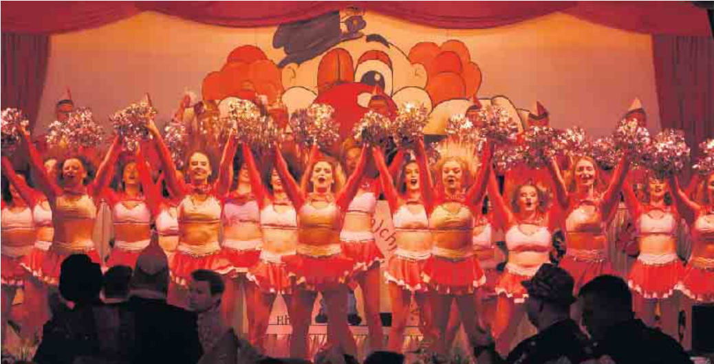
Die Cheerleader des 1. FC Köln e. V.