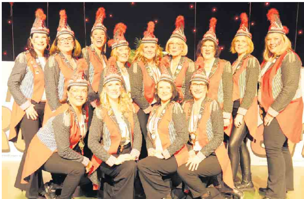
Mondorfer Rotstielchen e. V.

Ein musikalisches Highlight des Nachmittags war der Auftritt der Band Kasalla. Mit ihren bekannten Hits brachten sie den Saal zum Beben, und die Damen feierten, sangen und tanzten ausgelassen. Die Mondorfer Karnevalsgesellschaft und die Band King Louis setzten das Programm schwungvoll fort und