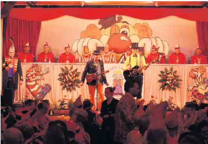
„Zwei Hillije“.

Humor und pointierten Witzen sorgte er für zahlreiche Lacher und trug zur ausgelassenen Stimmung bei. Die Showtanzgruppe Sugarjills verzauberte das Publikum mit ihrer energiegeladenen Performance während die Cheerleader des 1. FC Köln mit akrobatischen Einlagen beeindruckten. Musikalisch wurde der Abend von den Klüngelköpp, den Funky Marys und Eldorado begleitet, deren mitreißende Klänge die Gäste zum Mitsingen animierten. Die Palm Beach Girls setzten im Verlauf des Abends mit ihrer Darbietung einer „Schachpartie“ einen weiteren Aktzent. Die Herrensitzung der Karnevalsfründe La(a)chjunge war wie immer ein voller Erfolg und ließ keine