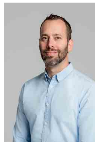
Ihr Medienberater für Niederkassel: Rule Mews