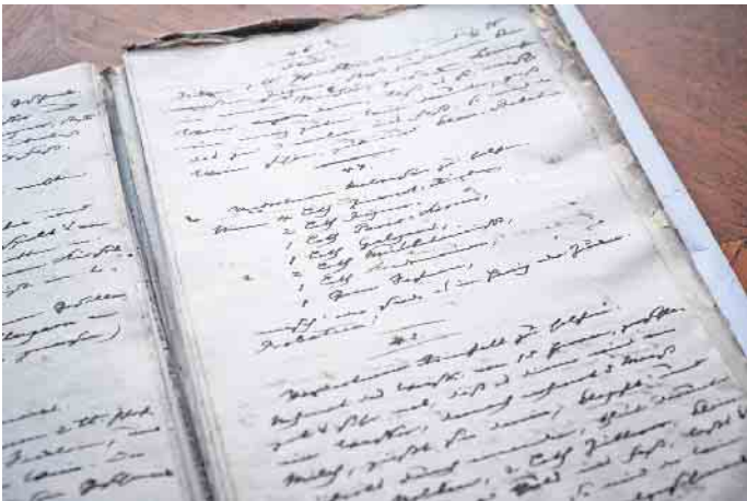
Das älteste bekannte Glühweinrezept Deutschlands stammt aus Radebeul, malerisch gelegen vor den Toren Dresdens.

Das historische Rezept des Raugrafen war lange Zeit verschollen. Erst Ende 2013 wurde es im Sächsischen Hauptstaatsarchiv in Dresden wiederentdeckt und ein-