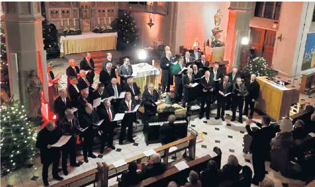
Archivbild MGV und QVE

Genießen Sie den 4. Adventssonntag, vielleicht mit einem Besuch eines romantischen Weihnachtsmarktes, mit Glühwein und Keksen. Freuen Sie sich auf ein schönes friedvolles Weihnachtsfest. Doch auch nach dem Heiligen Abend möchten wir die besinnliche Zeit nicht abrupt beenden. Am Samstag, 28. Dezember, übernehmen die befreundeten Chöre, Quartett-Verein Eischeid und MGV Gemütlichkeit Söntgerath die musikalische Gestaltung der heiligen Messe um 19 Uhr in St. Margareta Neunkirchen. Die beiden Chöre laden die Besucher der Messe herzlich ein, sich bereits ab 18.30 Uhr mit ihnen gemeinsam, mit bekannten Weihnachtsliedern einzusingen. Zum Ausklang des Abends und des Jahres bieten beide Chöre im An-