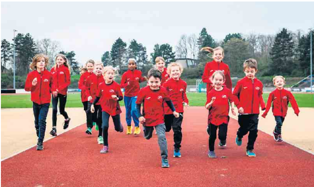
Der Spaß an der Bewegung steht ganz oben bei den LAZ Rhein-Sieg Bambinis.

Laufen, Springen, Werfen - das alles und noch viel mehr kannst du bei uns im LAZ Rhein-Sieg spielerisch entdecken. Unsere Leichtathletikgruppe für Kinder im Alter von 4 bis 5 Jahren bringt dir die vielfältigen Disziplinen der Leichtathletik näher. Gemeinsam fördern wir deine Geschicklichkeit und Koordination, erleben jede Menge Bewegung und haben vor allem eins: ganz viel Spaß. Ob rennen wie ein Blitz, springen wie ein Frosch oder werfen wie ein Profi - bei uns ist alles möglich. Komm gerne zu einem Schnuppertraining vorbei oder melde dich jetzt bei uns. Kontakt + Trainingszeiten: freitags 16 bis 17 Uhr Halle am Anno-Gymnasium 53721 Siegburg Wir freuen uns auf dich!