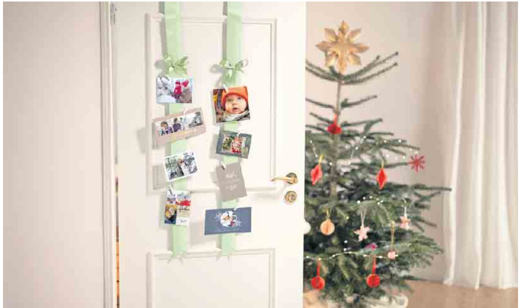
Die passende Dekoration weckt Vorfreude auf Weihnachten. Mit dekorativen Schleifenbändern lassen sich zum Beispiel Foto-Grußkarten stilvoll in Szene setzen.

Weihnachten ist die Zeit der liebevollen Worte: Eine persönliche Karte, versehen mit einem individuellen Foto und einer berührenden Botschaft, signalisiert lieben Menschen in der Ferne, dass an sie gedacht wird. Gestalten las-