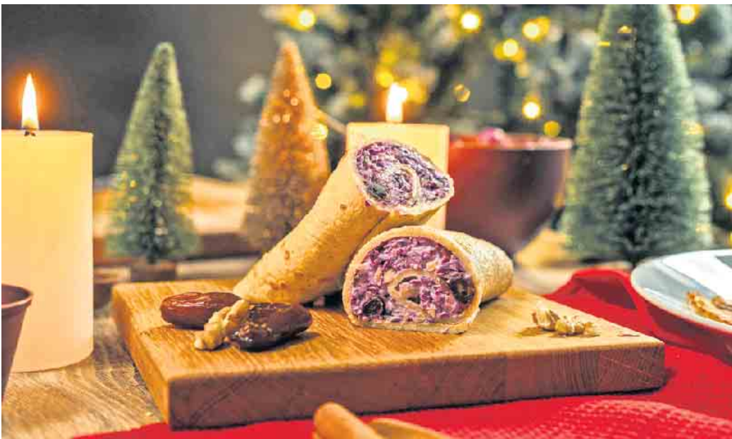
Gesund und lecker im Winter: Hafer-Wraps mit Rotkohl, Datteln und Walnüssen.

Unter www.hafer-die-alleskoerner.de finden sich neben Back- und vielen anderen süßen Rezepten auch Ideen für herzhafte Gerichte mit Haferflocken. So sind beispielsweise winterliche Hafer-Wraps mit Rotkohl, Datteln und Walnüssen eine vorzügliche Wahl. Sie sind innerhalb von etwa 30 Minuten leicht zuzubereiten, plus zwei Stunden Ruhezeit.