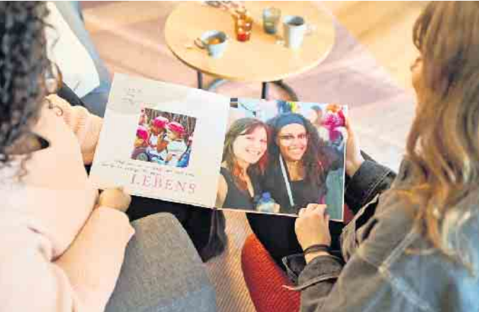
Schöne Erinnerungen verschenken: Ein Fotobuch hält Höhepunkte des Jahres auf kreative Weise fest.

So werden aus Fotos individuelle und emotionale Weihnachtspräsente