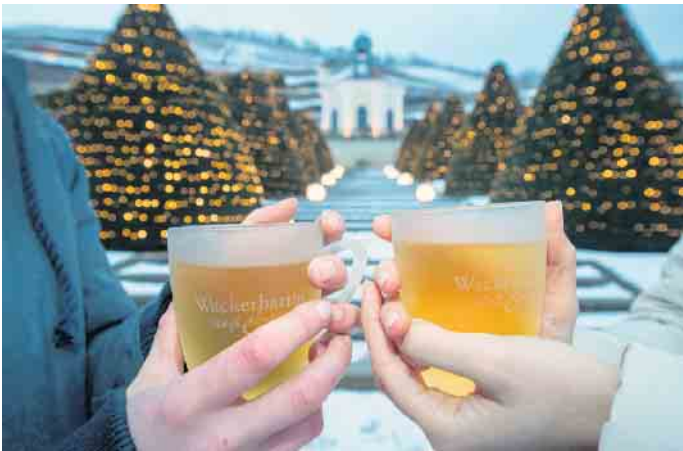
Ob weiß oder rot, in der kalten Jahreszeit sind wärmende Getränke gefragt.