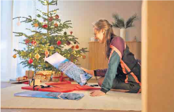
Mit einem individuellen Wandbild kann man viel Freude verschenken.

Mit einem Fotokalender als Jahresbegleiter bereitet man sich selbst und den Liebsten viel Freude. Seien es die