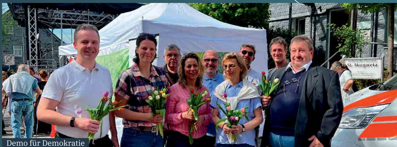
Demo für Demokratie

Unser Einsatz für die demokratischen Werte unserer Gemeinde zeigte sich auch bei der Demo für Demokratie, wo wir ein klares Zeichen gegen Hass, Hetze und Extremismus setzten. Solche Momente verdeutlichen, wie wichtig Engagement und Zusammenhalt sind – für ein starkes Neunkirchen-