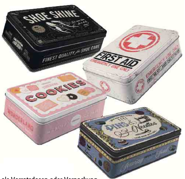
Ob als Vorratsdosen oder Verpackung für kleine Geschenke oder einfach so - die Dosen im Retro-Design sorgen nicht nur zu Weihnachten für nostalgische Momente

Designs heben sie sich deutlich von herkömmlichen Produkten ab. Ob als lebensmittelechte Vorratsdose für Nahrungsmittel, als Kaffee- oder Tee-Dose mit luftdichtem Aromadeckel oder als Aufbewahrungsbox für Nähutensilien oder Schuhputzmaterialien - sie verbinden gekonnt Ästhetik und Funktionalität. Speziell zur Weihnachtszeit eignen sie sich ideal als originelle Verpackung für Plätzchen oder kleine Geschenke ( www.nostalgic-art.de/zuhause ). Ein weiterer Vorteil ist ihre Nachhaltigkeit. Im Gegensatz zu vielen Einwegverpackungen sind die Retro-Dosen aus robustem, langlebigem Material gefertigt. Die Beschenkten können sie über viele Jahre verwenden - und sich daran erfreuen. Trotz ihres charmanten Designs und ihrer praktischen Einsatzmöglichkeiten sind sie preislich erschwinglich und kos-