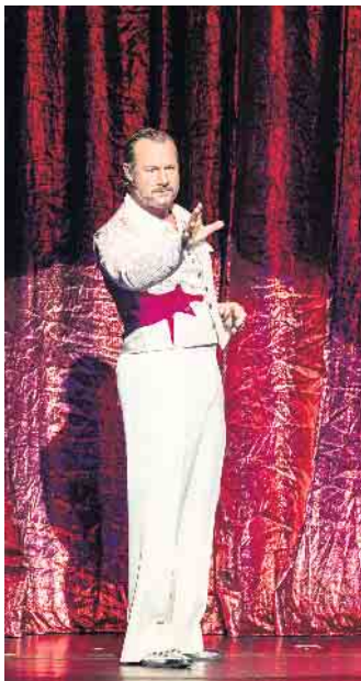
Szene aus „Nessun Dorma“, Theater Bonn

zum gewählten Abonnement bieten die Mitarbeiterinnen des Kundendienstes telefonisch montags bis freitags unter 0228-91 50 30 (9 bis 13 Uhr) oder jederzeit per Email an info@tg-bonn.de . Hier können Sie auch Ihren persönlichen Flyer mit allen Mini-Abonnements zum Jahresstart anfordern - natürlich kostenlos. Alle Abonnements sind auch ganz bequem online auf der Website der Theatergemeinde BONN buchbar ( www-tg-bonn.de ). Die Abos sind die ideale Gelegenheit, wieder mehr ins Theater zu gehen und den Preisvorteil gegenüber der Einzelbuchung bei den verschiedenen Spielstätten zu nutzen. Wir wünschen viel Freude beim Aussuchen Ihres „Lieblingsprogramms“!