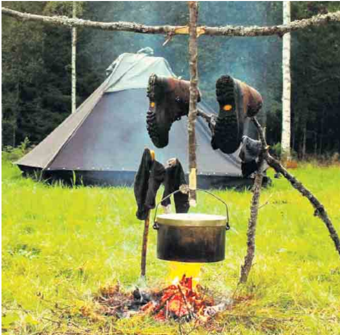
Pause nach langem Wandertag

herzlich zum gemütlichen Beisammensein ein. Am Stand bieten wir frisch gebrauchene Bratkartoffeln an, auf Wunsch mit gebratenen Champignons, Zaziki und Speck. Als Snack dürfen sich Besucherinnen und Besucher auf Fruchtspieße mit Schokolade freuen. Zum Aufwärmen haben wir Glühwein nach Tschai-Art mit oder ohne Alkohol. Der Rote Milan freut sich auf viele Gäste und wünscht allen eine schöne und besinnliche Adventszeit. Ort: Weihnachtsmarkt Neunkirchen-Seelscheid Datum: 13. bis 14. Dezember