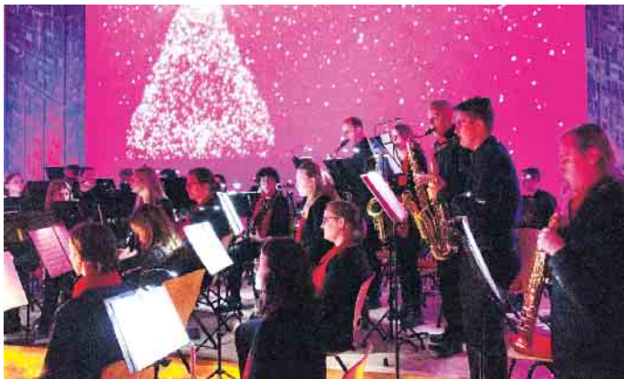
„Lichterglanz und Weihnachtsklänge“