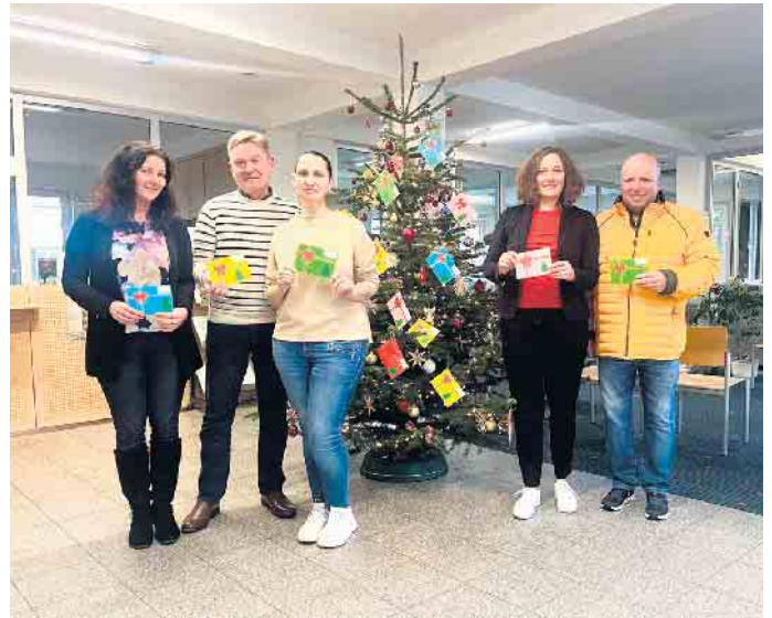
Die geschmückten Weihnachtsbäume stehen zum „Wunschzettelpflücken“ bereit.

Die Projektbeschreibung, welche den Umschlägen beigelegt werden, erfolgt durch den evangelischen Kindergarten in Seelscheid. Neben der Projektbeschreibung erhält jede*r Spender*in ein Puzzleteil mit einer eigenen Nummer. Im Rathaus wird ein zweites identisches Puzzle mit den gleichen Nummern versehen. Bei der Spendenabgabe wird die Nummer des Puzzleteils angegeben, sodass das Puzzle im Rathaus durch die ent-