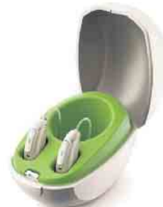
Phonak Audéo™ Paradise