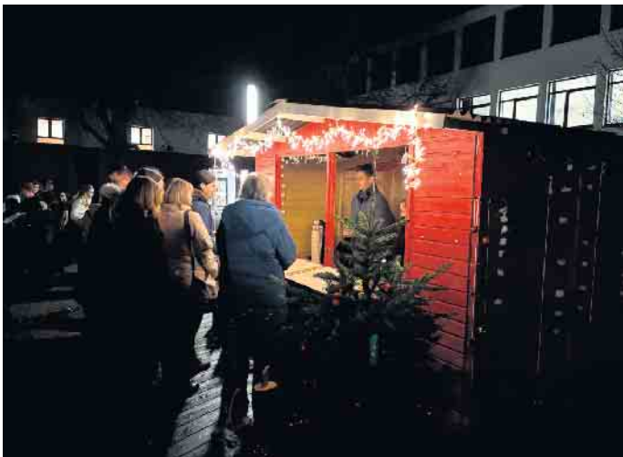
Weihnachtsstimmung mit Glühwein und Punsch in der Pause auf dem Schulhof

ne außergewöhnliche Klasse und bemerkenswerte Vielseitigkeit. Immer wieder wurde auch die Verbindung zur Adventszeit deutlich. Vor der Zugabe - einer imposanten Interpretation von Engelbert Humperdincks Werk „Abendsegen“ aus der Oper „Hänsel und Gretel“ (dargeboten von SBO und Chören gemeinsam) - würdigte Markus Greuel die Unterstützung durch das Mensa-Team, das in der Pause auf dem Schulhof Glühwein und Kinderpunsch in einer weihnachtlichen Hüttenkulisse bereitstellte, die AG „AKamera“, die das Konzert aufzeichnete, die