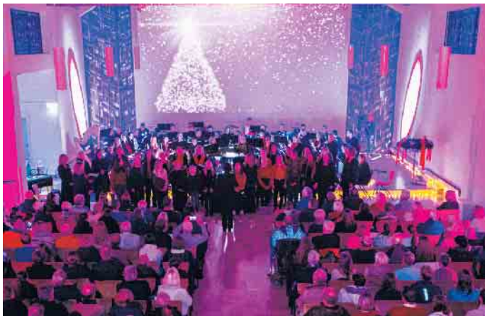
Adventskonzert des Sinfonischen Blasorchesters und der Chöre am Antoniuskolleg