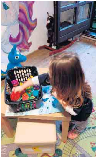
Geschenkkaktion für Kinder

Liebe Kinder, die Stöberstuben des Kinderschutzbundes in Neunkirchen-Seelscheid veranstalten in diesem Jahr eine Verschenk-Aktion von Spielzeug für euch. Jedes Kind bis ca. 11 Jahren erhält kostenlos ein Spielzeug nach eigener Wahl. In unserer großen Auswahl an Spielen, Büchern, CDs und Spielzeug ist bestimmt für jedes Kind etwas Schönes dabei. Am 28. November, von 9 bis 12 Uhr und 15 bis 17.30 Uhr, in den Räumen der beiden Stöberstuben in Neunkirchen und Seelscheid. Jedes Kind erhält zusätzlich noch eine kleine Überraschung. Theresia Jonas 1. Vorsitzende