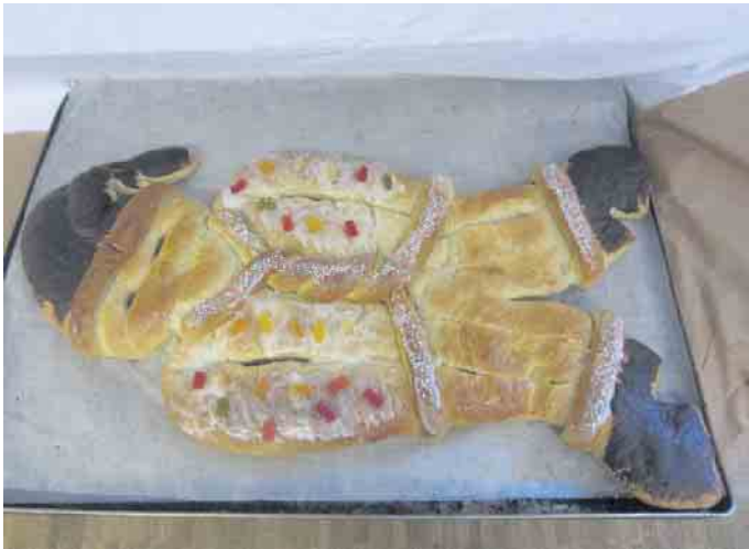
Der Weckmann wurde geteilt

Kinderkirche „Kirchen-Kids“ Sonntag, 4. Dezember, um 11 Uhr im Pfarrheim St. Margareta. Bei dem letzten Wortgottesdienst haben wir alles über St. Martin erfahren. Es wurde die Geschichte gehört und wir haben gemeinsam Laternen gebastelt. Anschließend wurde ein leckerer Riesen-Weckmann für alle geteilt. Nun sind wir auf dem Weg Richtung Weihnachten und auch zu dem letzten Wortgottesdienst in diesem Jahr werdet ihr wieder etwas aus der Kinderbibel erzählt bekommen. Das Team der Kirchen-Kids freut sich auf euren Besuch.