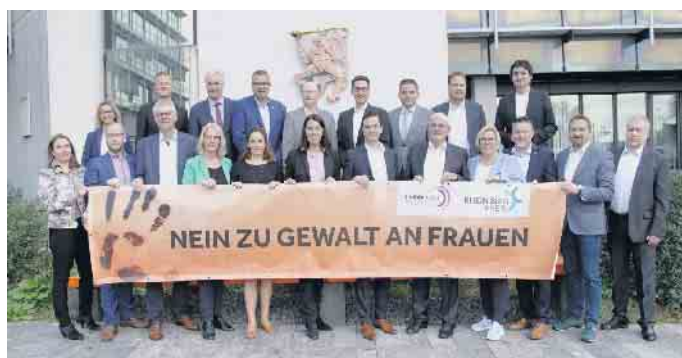
Fotoaktion im Rhein-Sieg-Kreis zum Tag gegen Gewalt an Frauen