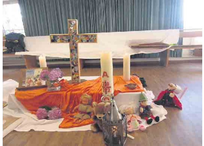
Kleiner Altar der Kirchen-Kids

Infos: Familienzentrum St. Margareta, Walzenrather Str. 10, E-Mail: kita-st-margareta@kath-nkse.de, Tel.: 02247-2313.