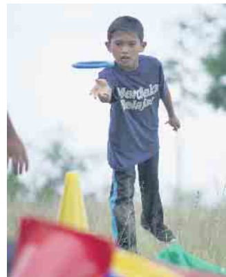
Sportprogramm in Indonesien

tesdienst bilden, zu dem wir alle Mitglieder unserer Gemeinden, insbesondere Eltern, Geschwisterkinder und Großeltern der Sternsinger herzlich einladen. Schon jetzt steht der Termin für den Empfang der Sternsinger im Rathhaus fest. Alle Sternsinger werden am Freitag, 6. Januar, um 10 Uhr, im Ratssaal Neunkirchen empfangen.