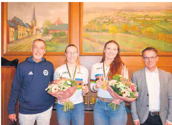
Empfang im Rathaus Hardtberg.