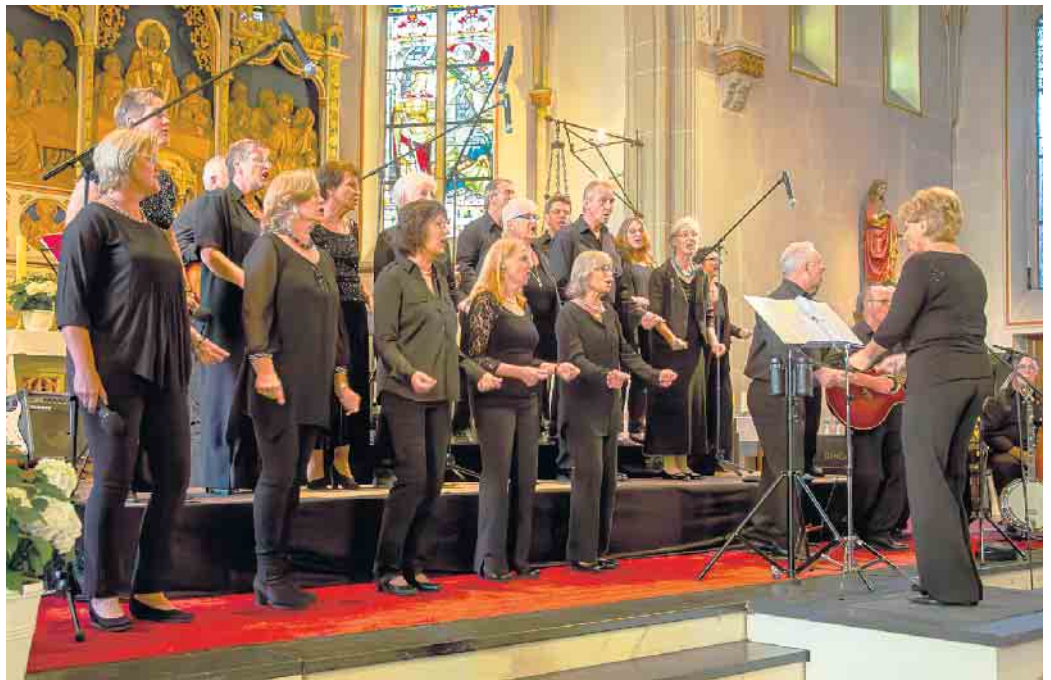
Gospelchor Sound'n'Spirit.

Aus den auch für Chöre schwierigen Coronajahren ohne Präsenzproben und Auftritte ist Sound'n'Spirit mit frischer Energie hervorgegangen. Mit neuen Sängerinnen und Sängern, weiteren Solisten, einer erweiterten