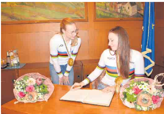
Eintrag ins Goldene Buch des Stadtbezirks.