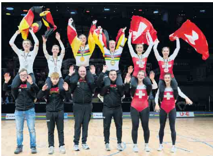
Jubel nach dem Sieg.