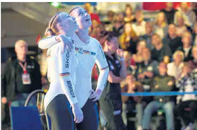
Gespannter Blick auf die Wertungstafel.

Goldmedaille mit knappem Vorsprung vor Kim Leah Schlüter und Neele Jodeleit vom RSV Knetterheide. Bronze ging an Simona Lucca und Larissa Tanner aus der Schweiz.