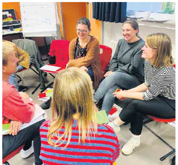
Lions-Quest-Fortbildung am AK