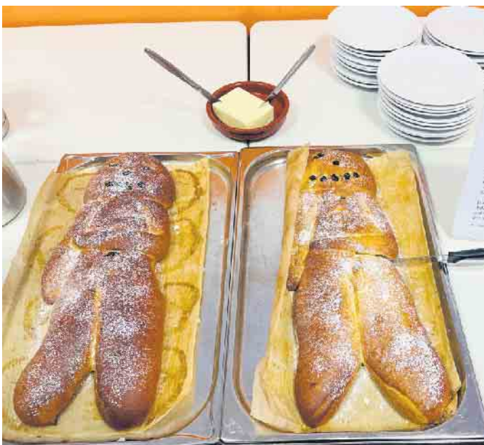
Ein herzlicher Dank gilt dem Mensa-Team für die warmen und kalten Getränke sowie für die köstlichen Speisen während der Seminartage!