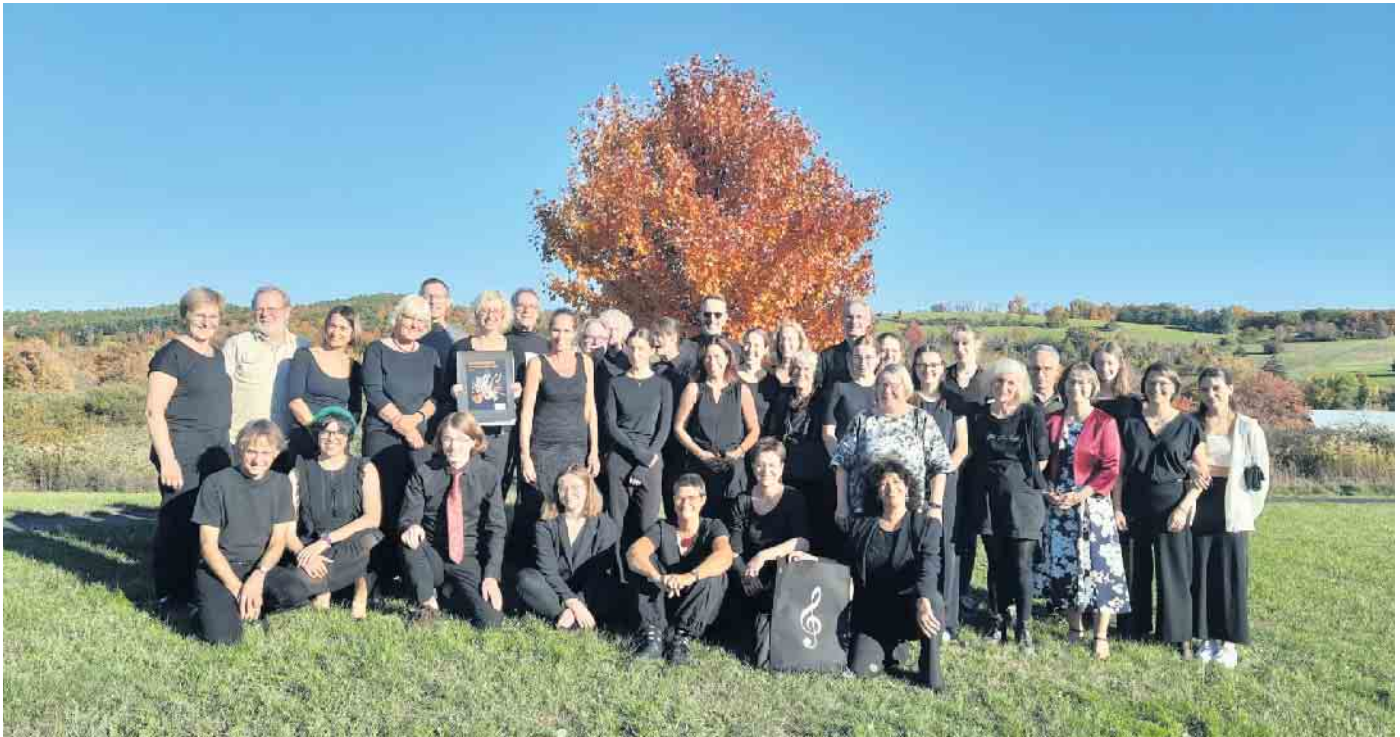
Das Mehrgenerationenorchester Divertimento.