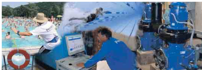
Alles im Blick zu behalten ist ein verantwortungsvolle und ebenso anspruchsvolle Aufgabe.

Die Berufsmöglichkeiten für FABs sind vielfältig. Sie können in öffentlichen Schwimmbädern, Spa- und Wellnesszentren, Freizeitparks oder Fitnessstudios arbeiten. Es besteht auch die Möglichkeit, sich auf bestimmte Bereiche wie die Wasserpflege, die Schwimmkursleitung oder die