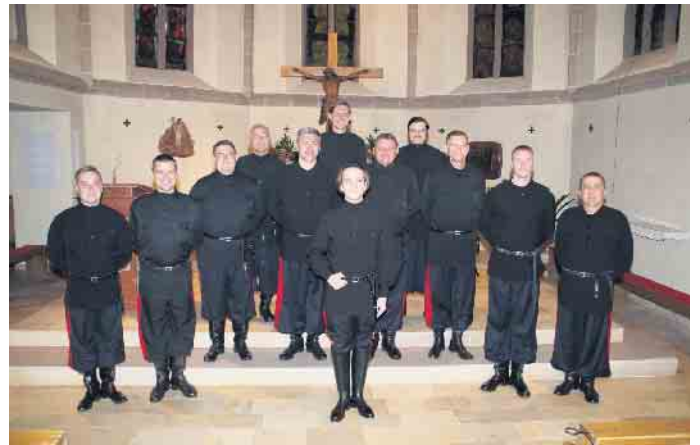
Die Original Don Kosaken aus der Ukraine gastieren am 2. Dezember in Eitorf.