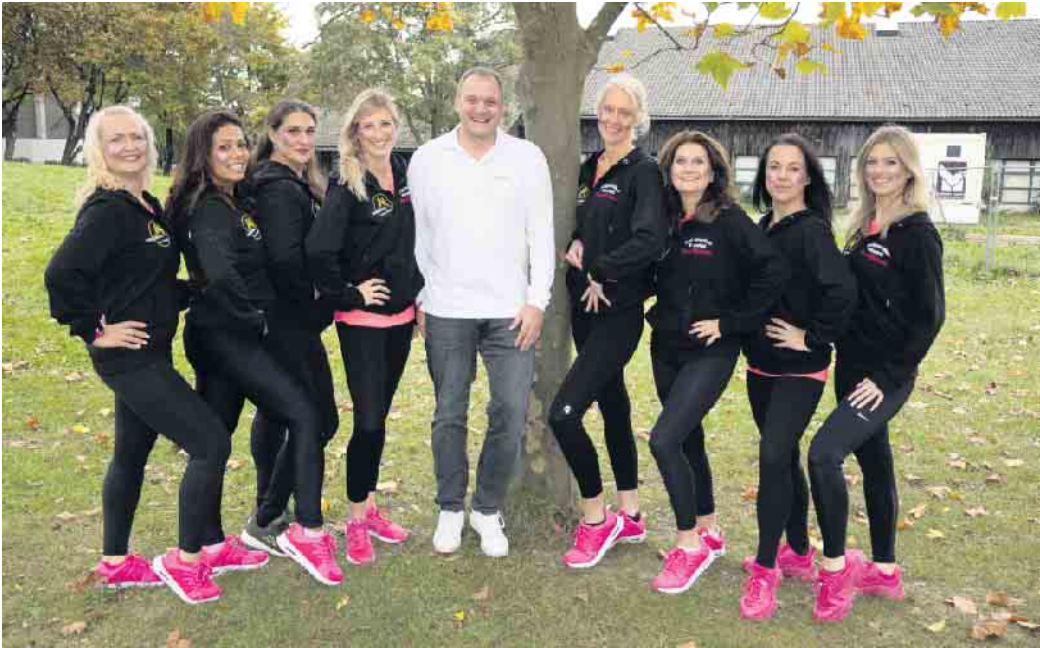
Eure Dorfgrenadiere Birkenfeld e. V. und Danza Colada Danza Colada