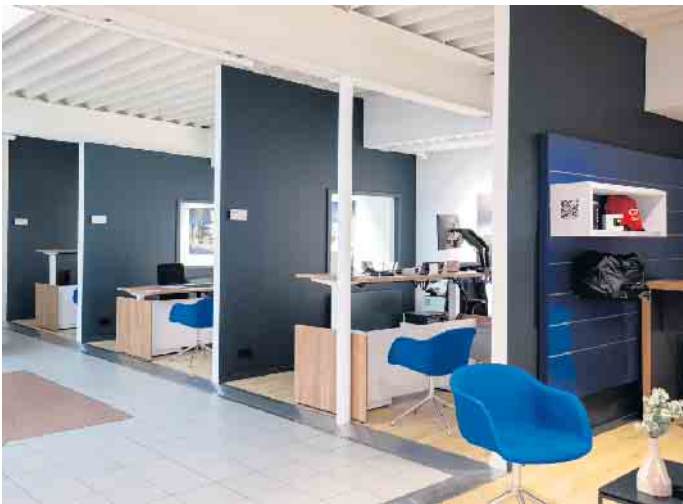
In gemütlicher und ansprechender Atmosphäre wird die Kundschaft über alle Fragen rund um das Auto beraten