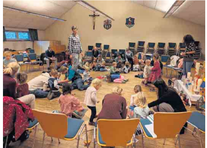
Alle basteln begeistert

Ziel von Integration ist es laut BMI „den Zusammenhalt in der ganzen Gesellschaft zu stärken. Von einer möglichst schnellen und nachhaltigen Integration profitieren nicht nur die Menschen, die zu uns kommen, sondern wir alle. Integration betrifft dabei Alteingesessene ebenso wie Zugewanderte. Unser Welcome-Cafè bietet allen Menschen die Gelegenheit aufeinander zugehen zu können.