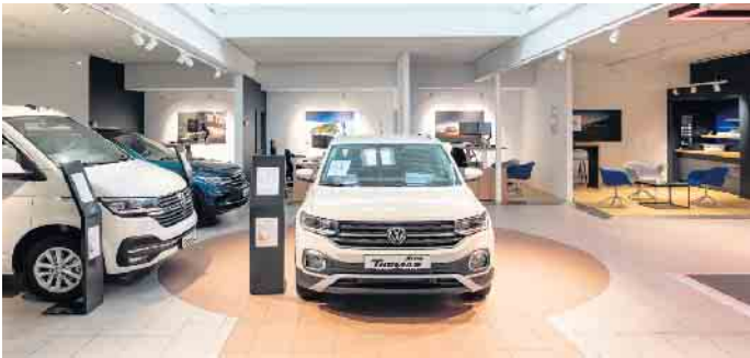
Auto Thomas an der Frankfurter Straße in Hennef profitiert von dem großen Portfolio der Firmengruppe