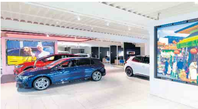
Die Verkaufsfläche bei Auto Thomas in Hennef wurde neu gestaltet und erstrahlt in attraktivem Design

Was macht die Firmengruppe Auto Thomas und damit auch den