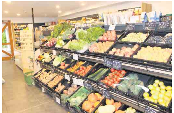
Im Bioladen des Eichhofs gibt es ein großes Angebot an Obst und Gemüse.

die in einem Hühner-Mobil auf dem Eichhof gehalten werden. Der Bioladen, in dem auch Demeter-Milchprodukte, Käse und Wurstwaren sowie Tee, Kaffee, Süßigkeiten und Gewürze angeboten werden, dient den Bewohnern des Eichhofs als Arbeitsplatz. Etwa 150 Menschen mit Assistenzbedarf arbeiten auf dem Eichhof in den Metall-, Holz-, Keramik-Kerzen- oder Kreativ-Werkstätten sowie in der Küche, der Kantine, der Bäckerei oder der Wäscherei. Manche arbeiten auch in der hofeigenen Landwirtschaft und betreuen die Hühner und Rinder oder übernehmen Fremd-Aufträge im Bereich Garten- und Landschaftsbau.