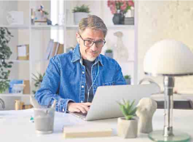
Ob jung oder nicht mehr ganz so jung: Eine Umschulung ist für jeden zu bewältigen und kann zum neuen Traumjob führen.

Umschulung: Finanzielle und persönliche Unterstützung ebnet den Weg zum Neustart