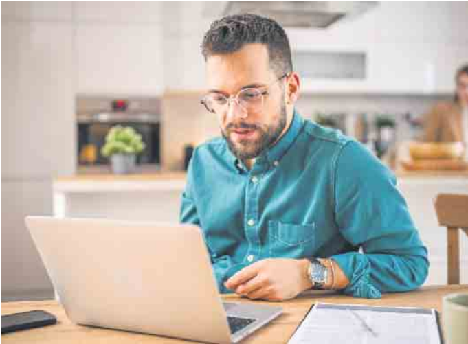
Online-Unterricht machts möglich: Moderne Umschulungen bieten ein Höchstmaß an räumlicher, zeitlicher und inhaltlicher Flexibilität.

Das ganze Leben besteht aus Veränderung - das gilt auch für den Beruf. Manche Menschen wollen oder müssen sich in Sachen Job neu orientieren, andere möchten nach längerer Pause - etwa we-