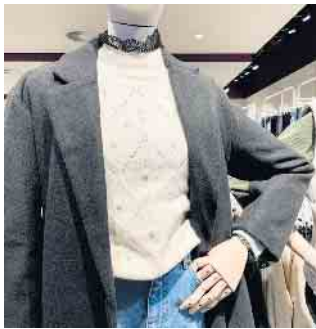
Tolle Mode auf größerer Fläche erwartet Sie im neuen ONLY.

kurzen Wegen bequem und zeitsparend ins Auto einzuladen. Und damit Sie immer aktuell informiert sind über die huma Shoppingwelt, alle Events, Aktionen, Angebote und Gewinnspiele, folgen Sie doch der huma auf Facebook oder Instagram unter @humaSanktAugustin . Oder schauen Sie einfach regelmäßig auf der Website huma.de in den News vorbei. Die huma freut sich auf Ihren Besuch - virtuell auf den digitalen Medien und am liebsten persönlich im Center in Sankt Augustin!