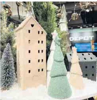
Im neuen Depot auf der Straßenebene wird jeder Dekofan fündig!

Fashionshop ONLY - jetzt auch mit Kinderkleidung Auch der Fashionstore ONLY hat sich neu erfunden! Mit einer großzügigen Flächenerweiterung präsentiert der Laden nicht nur eine erweiterte Auswahl an trendiger Damenmode, sondern begeistert ab sofort auch kleine Mode-Enthusiasten mit seinen trendigen Kinderkollektionen - von lässiger Freizeitbekleidung bis zu bezaubernden Kleidern. Modebewusste Eltern und kleine