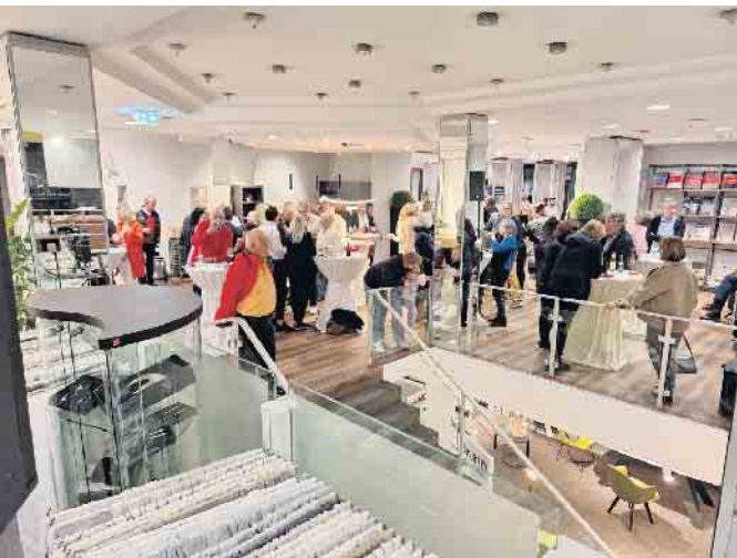
Auf 2 Etagen können sich die Kunden tolle Eindrücke holen

erfolgreich betrieben und so haben sich zwei Spezialisten zusammengetan, um mit professionellem und persönlichem Service ihren Kunden zur Seite zu stehen. „Individuelle Beratung kombiniert mit kreativen Ideen ist exakt das, was sich unsere Kunden wünschen“, so die beiden unisono. Der Service geht über das normale Maß hinaus und bezieht unter Berücksichtigung aller Rahmenbedingungen auch den Komfort, die Funktionalität, Licht- und Akustikverhältnisse