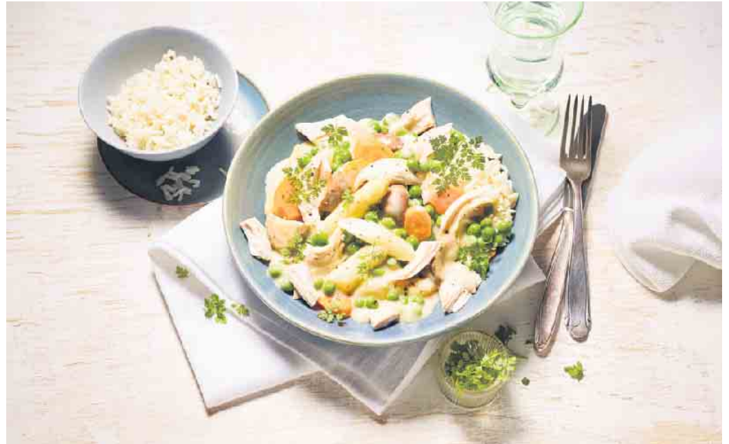
Rezeptklassiker mit leckeren Zutaten: Hühnerfrikassee mit Champignons, Möhren, Erbsen und Spargel.