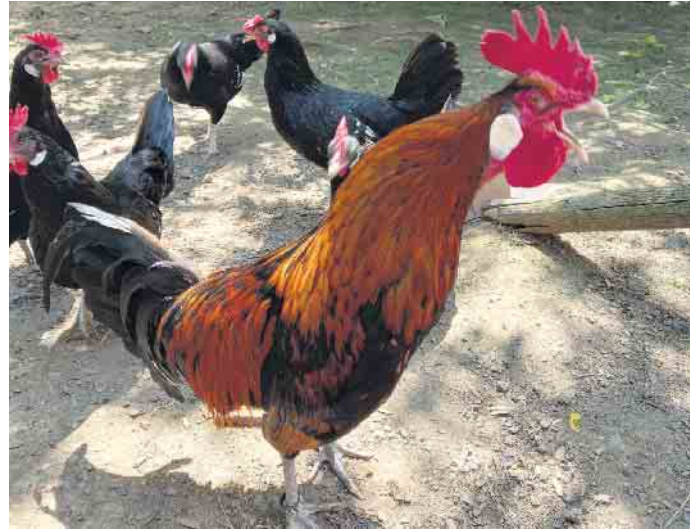
Bergischer Zwergkräher, Hahn mit seinen Hennen