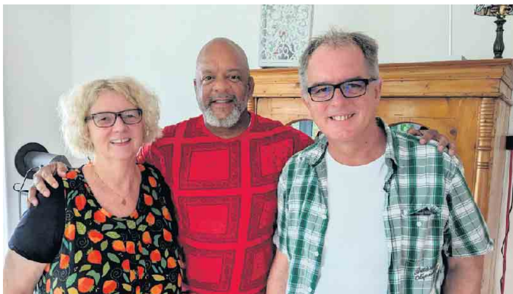
Der Gospelchor Good News

Wir freuen uns über viele motivierte Sängerinnen und Sänger und auf ein tolles Wochenende mit Euch. Bitte meldet Euch an, damit wir alles gut planen können.