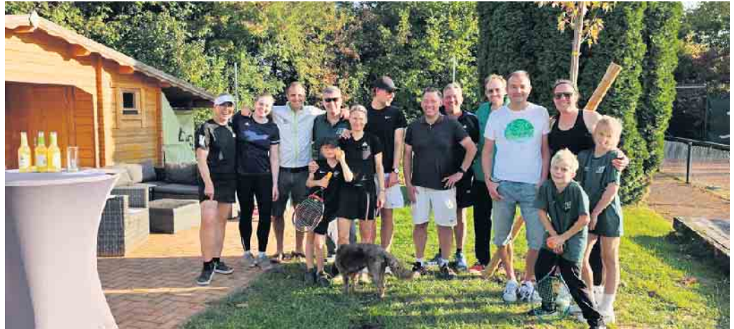
Teilnehmer der Clubmeisterschaften

Besonders die Endspiele sorgten für Nervenkitzel: Sowohl das Herren-Einzel-Finale als auch beide Mixed-Matches (Finale und Spiel um Platz 3) wurden erst im Champions-Tie-Break entschieden. Bis zum letzten Ballwechsel blieb unklar, wer am Ende die Trophäe in die Höhe stemmen würde. Präzise Aufschläge, lange Grundlinienduelle und clevere Netzangriffe - die Finalisten zeigten Kampfgeist und Tennisleidenschaft pur. Doch nicht nur sportlich war einiges geboten: Eine kleine, aber feine Kaffeebar mit Espresso, Cap-