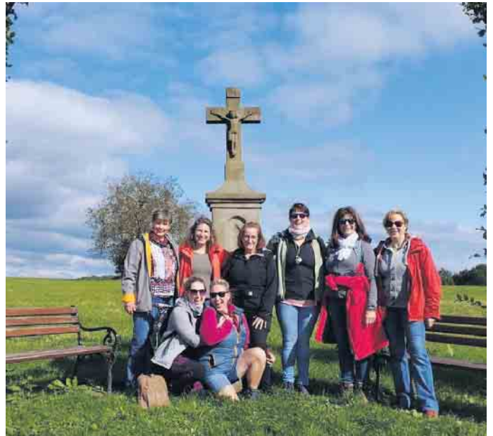
Elferrat Frohgemut Eischeid e.V.

Ein besonderer Dank geht an unser Organisationsteam, das den Tag perfekt geplant und uns an