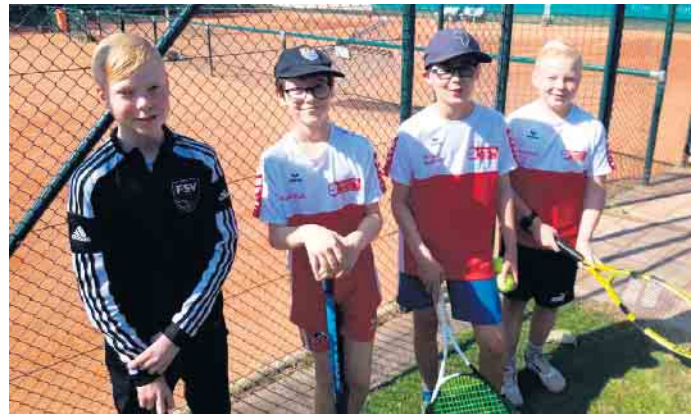
U 12 Jugend Großfeld