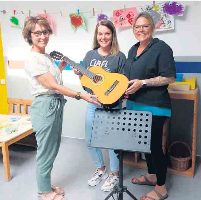
Übergabe der Gitarre

Kinderschutzbund OV Neunkirchen-Seelscheid