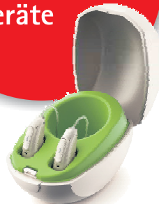
Phonak Audéo™ Paradise