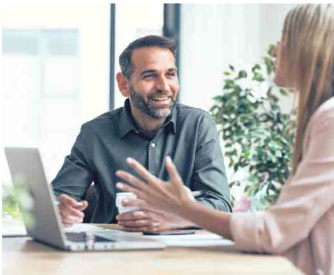
Beim Bewerbungsgespräch darf man ruhig selbstbewusst auftreten.

„Personalverantwortliche suchen zwar nach passenden Fachkräften. Sie müssen umgekehrt aber auch jeden Bewerber und jede Bewerberin von sich als gutem Arbeitgeber überzeugen. (djd)