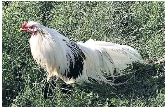
Yokohamahahn im hohen Gras

Der Rasse- und Ziergeflügelgeflügelzuchtverein Neunkirchen- Seelscheid, Much und Umgebung informiert