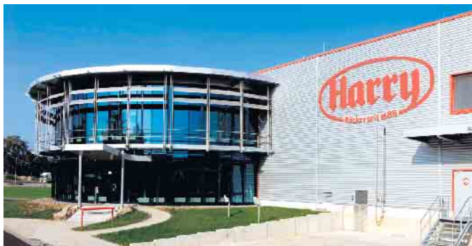
Werk in Troisdorf.

Die 3. Nacht der Technik in Bonn und dem Rhein-Sieg-Kreis