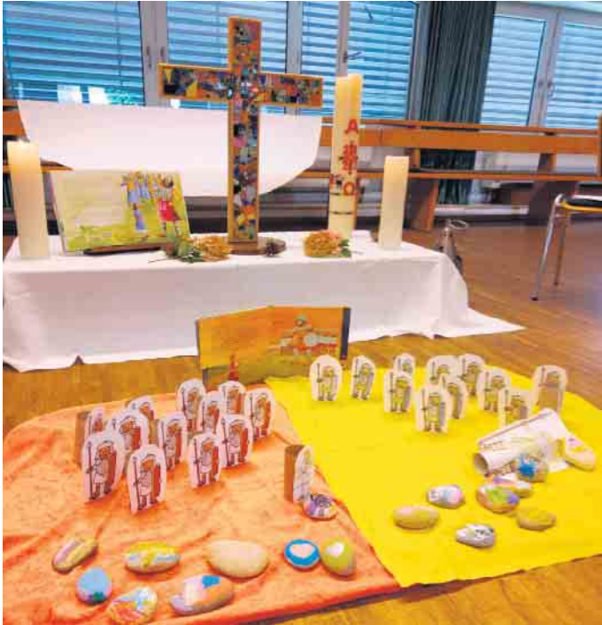
Kirchen-Kids im Pfarrheim