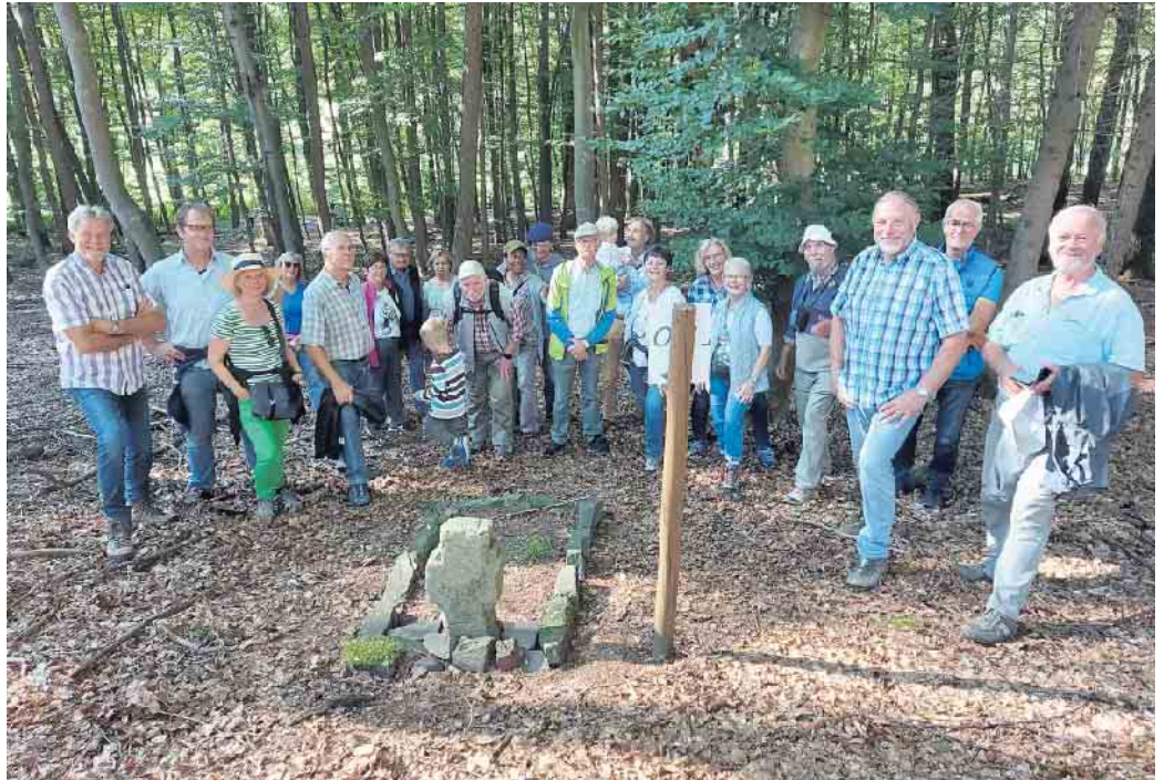
MGV am Schwedenkreuz

Die Geschichte des Schwedenkreuzes führt bis in den dreißigjährigen Krieg zurück: „Ein verwundeter deutscher Soldat schleppte sich 1637 mühsam heimwärts. Kurz vor seinem Heimatort Köbach verließen ihn die Kräfte. Um sein Vaterhaus noch einmal sehen zu können, kletterte er auf eine hohe Kiefer. Von Köbach aus wurde er erspäht und da er eine schwedische Uniform trug, schossen sie auf ihn und trafen ihn tödlich. An dieser Stelle im Wald begrub man den unglücklichen Soldaten und errichtete das Schwedenkreuz.“ Unser Weg führte uns weiter nach Much - Feld. Hier gab es zur Erfrischung ein paar kühle Getränke, denn die Sonne meinte es an diesem Tag sehr gut mit