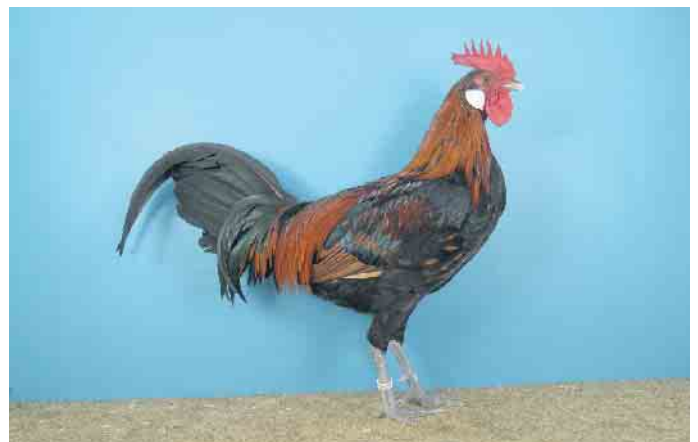
Bergischer Zwerg-Kräher Hahn

Der Verein wünscht ein schönes Oktoberwochenende und freut sich über ihren Besuch auf der 44. Ortsschau.