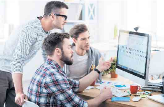
Fachkräfte werden in der IT-Branche händeringend gesucht. Für Quereinsteiger und Arbeitssuchende eröffnen sich mit einer Weiterbildung gute Berufschancen.

Kurse sind zertifiziert und werden von der Agentur für Arbeit sowie dem Jobcenter anerkannt. Interessant für Arbeitssuchende: Durch einen Bildungs- oder Vermittlungsgutschein können sie von einer 100-prozentigen Kostenübernahme der Qualifizierungskosten profitieren. Direkter Bezug zur Praxis Schon während der Qualifizierung ist es sinnvoll, die nächsten Karriereschritte zu planen. Deshalb beinhalten die Kurse