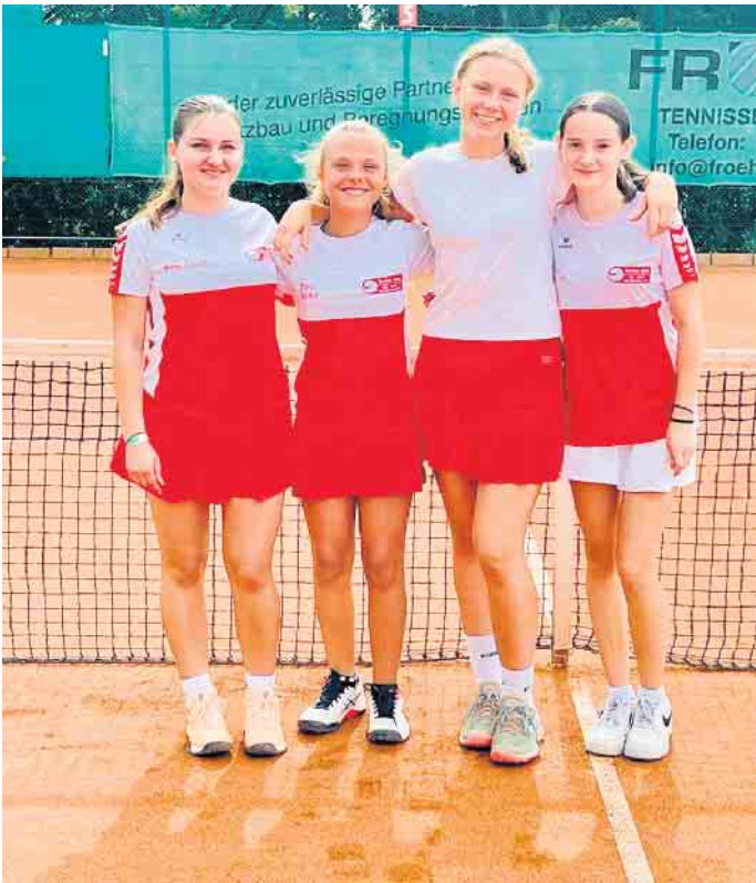
U 15 Mädchen Sommer 23