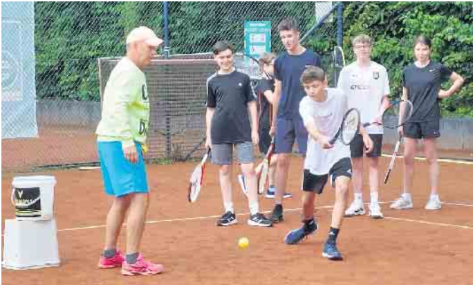
Übungen auf dem Tennisplatz

werden, was während des ein oder anderen Regenschauers gerne in Anspruch genommen wurde. Letztlich hoffen alle Beteiligten auf eine baldige Wiederholung dieser schönen und sportlichen Tage. Der Spaß am Tennissport