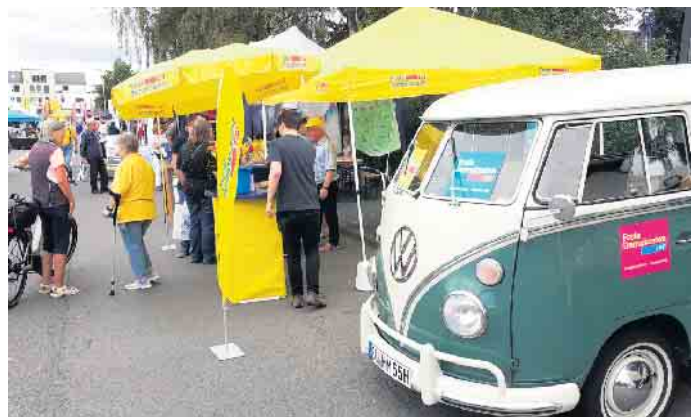
Gute Gespräche am Infostand der Freien Demokraten