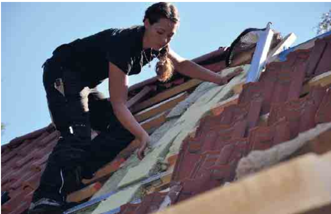
Dachdeckerinnen sind auf dem Vormarsch: schweres Tragen ist out, das übernehmen Lastenaufzüge.

dungsbetriebe und alle wichtigen Infos zum Dachdeckerberuf: www.dachdeckerdeinberuf.de Handwerk ist innovativ Das Dachdeckerhandwerk ist modern und innovativ. Mit Drohnen werden Dächer inspiziert, Lastenaufzüge lassen schweres Tragen der Vergangenheit angehören und Apps speziell fürs Handwerk erleichtern die Büroarbeit. So verbindet das Dachdeckerhandwerk handwerkliches und gestalterisches Geschick mit aktivem Umweltschutz und neuen Technologien: Schieferhammer und iPad. Dächer von heute sind Schutz- aber auch Nutzdach: Sie schützen vor Regen und Wind, liefern Energie und als begrüntes Dach leisten sie einen Beitrag zur Artenvielfalt, kühlen im Sommer und vermindern die Feinstaubbelastung in der Luft. Vor allem in Bal-