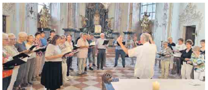
In der Basilika von Kloster Eberbach genossen die Sängerinnen und Sänger die einmalige Atmosphäre.