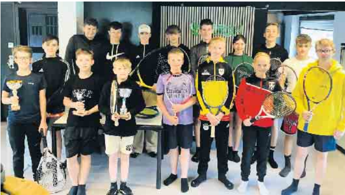
Gemeinsames Tennisprojekt vom Antoniuskolleg und dem TC Much

Im Rahmen der Projektstage fand in diesem Sommer das erste gemeinsame Tennisprojekt des Antoniuskollegs in Neunkirchen und des Tennisclubs Much statt. Für 18 Kinder und Jugendliche hieß es vier Tage lang „Vorhand“, „Rückhand slice“ und „40-15“ statt normalem Unterricht im Klassenraum. Und die Nachwuchstalente gingen motiviert ans Werk. Ausgestattet mit Schlägern des AK und Bällen der Tennisschule Matthias Sonnenberg, die freundlicherweise mitgenutzt werden durften, wurde intensiv an Vor- und Rückhand, Aufschlag und Return gearbeitet. Bereits nach wenigen Minuten gelangen erste Ballwechsel bei den Anfängern, während die Fortgeschrittenen schon richtige Punkte ausspielten. Dank der vorhandenen Methodikbälle und