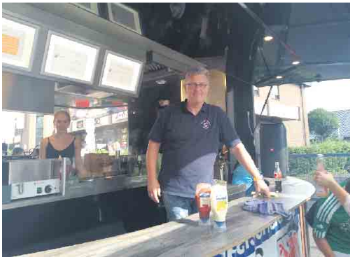
Unser Schatzmeister in Aktion