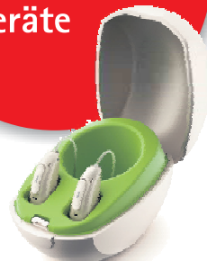
Phonak Audéo™ Paradise