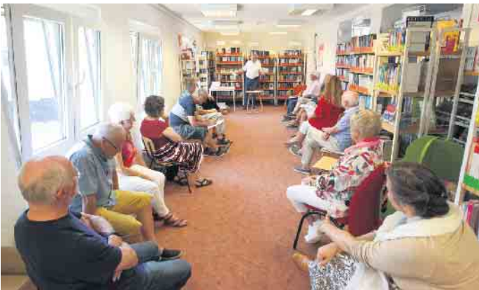
Vorstellung in der Bücherei Seelscheid