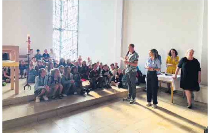
Klassenzuteilung der neuen fünften Klassen

Im Anschluss an den musikalischen Auftakt gestaltete Herr Roebke, Pfarrer der evangelischen Kirche Neunkirchen-Seelscheid, einen inspirierenden christlichen Impuls. Mit herzlichen Worten vermittelte er den neuen Schüler*innen gute Wünsche für ihren Schulstart und betonte die Bedeutung des Miteinanders in der Schulgemeinschaft. „Hals und Beinbruch“ - so wünschte er den Kindern und Eltern viel Glück für die kommenden Herausforderungen. Der Ursprung dieser Redewendung stamme aus dem hebräischen Ausdruck „hazlacha uwracha“ - und so lernten nicht nur die Kinder, sondern alle Anwesenden wieder etwas Neues. Die Schulleiterin des AK, Frau Hensen, richtete ebenfalls bewegende Worte an die neuen Schüler*innen. Sie ermutigte sie, jeden Tag mit Freude zur Schule zu kommen und dabei aber auch