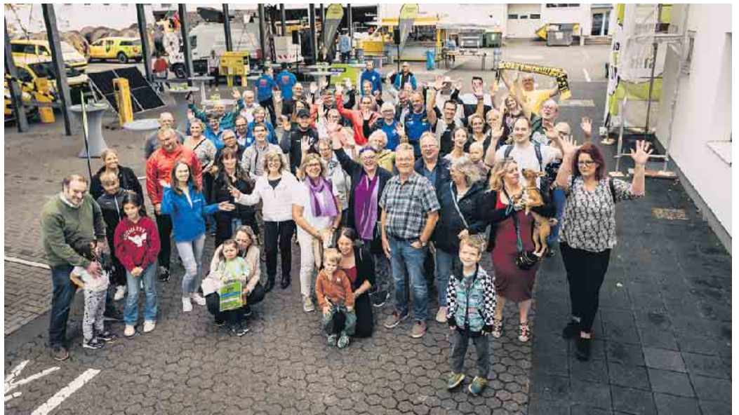
Bereits 2023 haben die Stadtwerke Troisdorf einen Nachhaltigkeitspreis ausgelobt. Auch in diesem Jahr stellt der Lokalversorger wieder 3.000 Euro für den guten Zweck zur Verfügung.

Am 31. August beginnt das Voting für den Sonderpreis der Stadtwerke Förder.Ei, mit dem die Stadtwerke Troisdorf drei besonders nachhaltige Projekte fördern. Bis zum 4. September kann unter www.foerderei.de abgestimmt werden, welche der vorgestellten Herzensprojekte den Nachhaltigkeitspreis besonders verdient haben. Hierfür stellt der Lokalversorger einen Sonderbonus in Höhe von insgesamt 3.000 Euro zur Verfügung. Auch in diesem Jahr präsentieren sich wieder etliche eingetragene Vereine und gemeinwohlorientierte Initiativen aus Troisdorf und der Region auf der Förder.Ei-Website mit ihren Herzensprojekten und hoffen auf Spenden für deren Umsetzung. Die Troisdorfer ließen sich nicht lange bitten und machten engagiert mit. Vom 14.