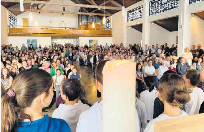
Einschulungsfeier in der Kapelle des AK

Ein herzlicher Start ins neue Schulleben