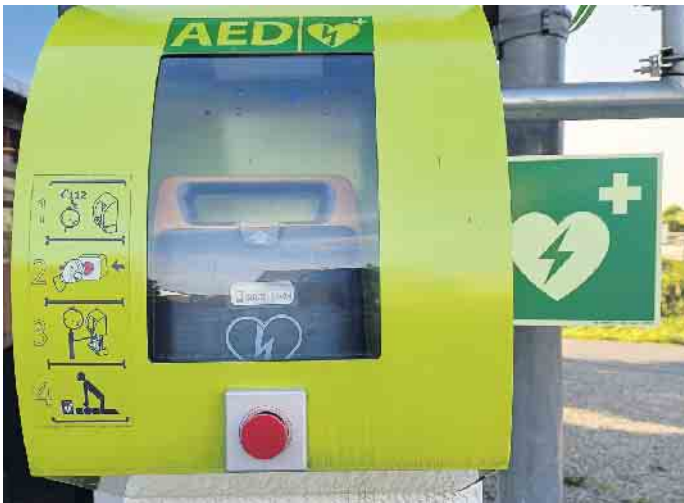
ADE Feuerwehrhaus Seelscheid.

benschance haben, wenn sie eine frühzeitige qualitativ hochwertige Wiederbelebung und AED Defibrillation bekommen, noch vor der Ankunft des Rettungsdienstpersonals. Die angeschafften Geräte der neusten Generation unterstützen durch Video- und Audioerklärungen mit entsprechenden Anweisungen über Dauer und Intensität der Wiederbelebungsmaßnahme, ggfs. bis zum Startbefehl eines notwendigen, elektrischen Schocks. Mehr als 30.000 Euro stellte die Bürgerstiftung Seelscheid für Geräte und die dazugehörigen, klimatisierten Aufbewahrungsschränke zur Verfügung. Die Finanzierung erfolgte aus Spenden und ehrenamtlicher Unterstützung des befreundeten Helferkreises bei Konzerten und Veranstaltungen der Bürgerstiftung Seelscheid. Die Standorte der Defibrillatoren in Seelscheid: • Evangelisches Altenheim • Evangelische Kirchengemeinde