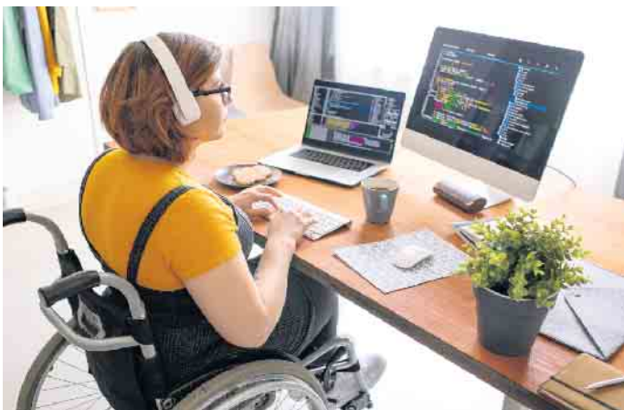
Menschen mit Behinderung können im Job genauso glücklich werden wie Nicht-Behinderte auch.

wältigen. Doch gibt es von einstellenden Unternehmen in vielen Fällen große Unterstützung, mit einer Behinderung in der Arbeitswelt erfolgreich zu sein. Bei der Siemens AG beispielsweise liegt ein Schwerpunkt unter anderem darauf, dass Software-Programme für alle nutzbar sind, also dass etwa auch hör- und sehbehinderte Mitarbeitende damit gut zurechtkommen. Diversität punktet „Eine der wichtigsten Voraussetzungen, damit Menschen mit Behinderung ihre Stärken auf dem Arbeitsmarkt so einsetzen können wie Nicht-Behinderte, ist die bauliche und vor allem die digitale Barrierefreiheit“, weiß der Inklusionsbeauftragte bei Siemens, Andreas Melzer. „Wir haben großes Interesse daran, Menschen mit Behinderung in unser Unternehmen zu holen, da viele von ihnen gut qualifiziert und oft hoch motiviert sind“, berichtet er. Während des Bewerbungsprozesses sollte direkt offen und ehrlich angesprochen werden, was der jeweilige Mensch braucht. Und auch wenn eine Jobbeschreibung nicht zu 100 Prozent passt, kann sich eine Bewerbung trotzdem lohnen. „Wir sind davon überzeugt, dass ein diverses Team am leistungsfähigsten ist“, so Melzer. „Wenn Menschen mit unterschiedlichen Hintergründen und Perspektiven zusammenarbeiten, ist das doch meistens sehr fruchtbar.“ (djd)